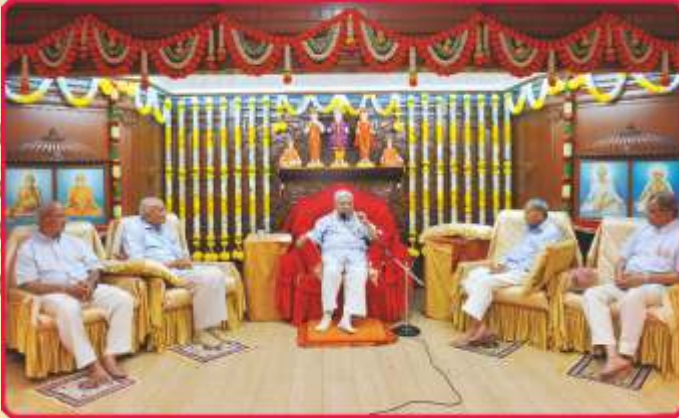
'પારમિતા' સભાખંડમાં યોજિત સ્વાગત સભામાં સાહેબજીની કૃપાશિષ