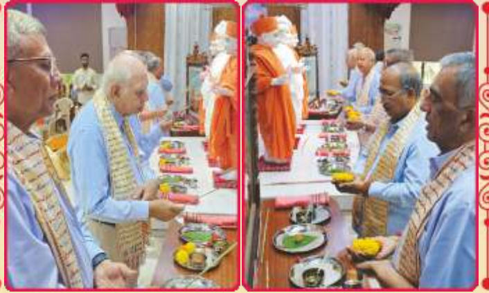
બારધર-નવી મુંબઈ સ્થિત મંદિરજીમાં બિરાજમાન શ્રી ઠાકોરજીનાં સંતો દ્વારા પાટોત્સવ પૂજન