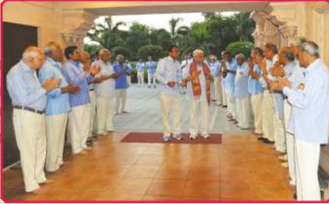
વિદેશની ધર્મયાત્રાથી પરત પધારતા સાહેબજીનાં બ્રહ્મજ્યોતિ, મોગરી ખાતે સ્વાગત