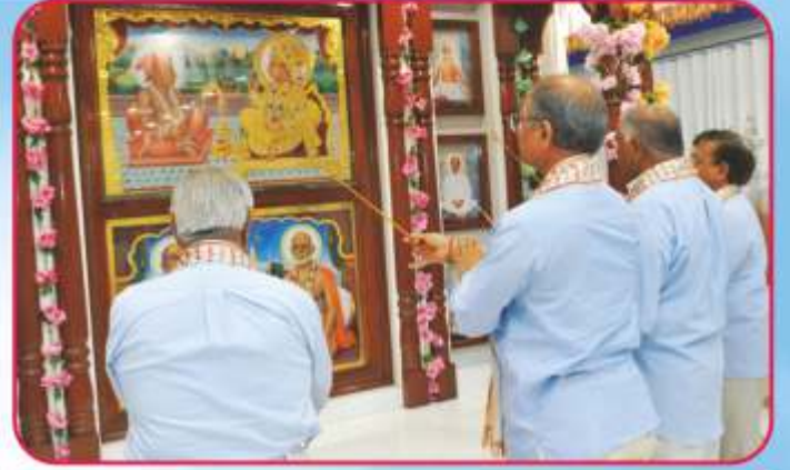
શ્રી અક્ષરદેરી તુલ્ય માણાવદર મંદિરનાં પાટોત્સવ પૂજન કરતા વડીલ સંતો