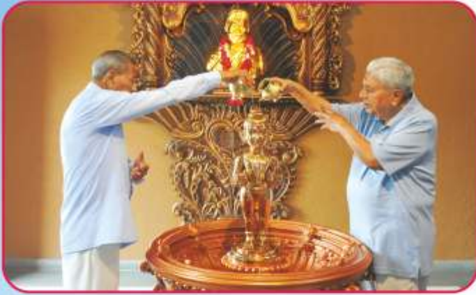
પ્રાસાદિક અભિષેક મંડપમાં સૌનાં કલ્યાણ અર્થે અભિષેક અર્પણ