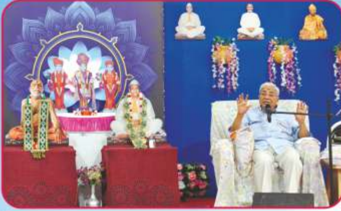
માણાવદર મંદિર પાટોત્સવ અને કાકાજી પ્રાગટ્યપર્વની સભામાં સાહેબજીનાં આશીર્વાદન