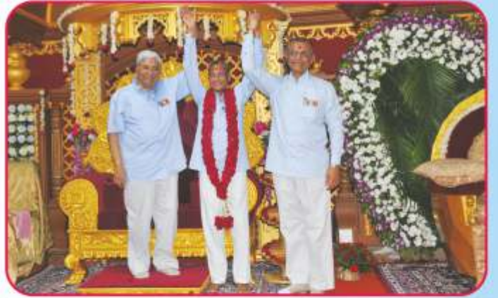
પૂ. અશ્વિનદાદા તિથિ પ્રાગટ્યદિનની સભામાં સંતભગવંત સાહેબજીની પ્રસન્નતાનાં દિવ્ય દર્શન