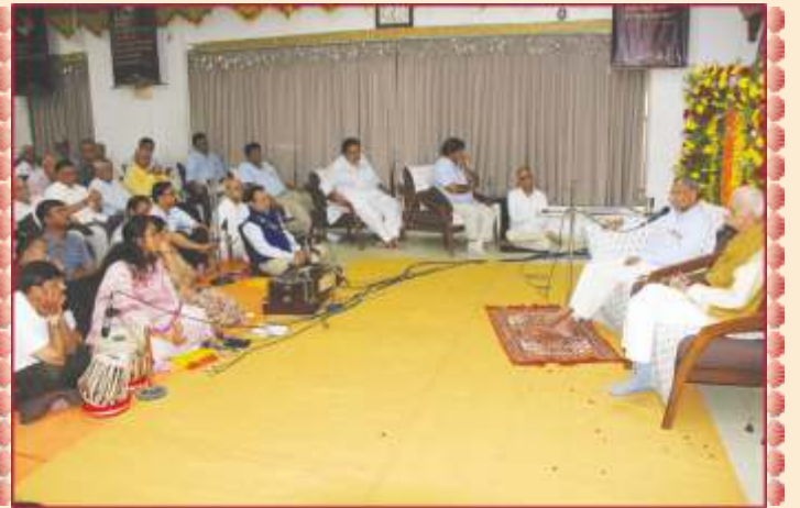
ઉપાસના ધામ, અમદાવાદ મંદિરે પૂ. અશ્વિનદાદાના પ્રાગટ્યદિનની સભામાં આશીર્વાદન