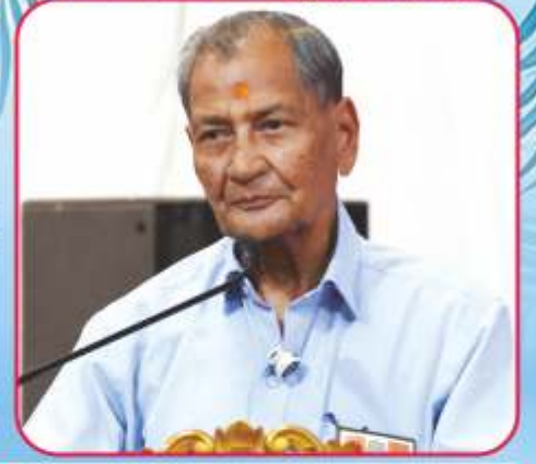
માણાવદર મંદિરે 'શ્રી ગુરુ આજ્ઞાપાલન દ્વારા શ્રી ગુરુહરિની પ્રસન્નતા' વિષય પર યોજિત સંતશિબિરમાં સદ્ગુરુ સંતો દ્વારા આધ્યાત્મિક માર્ગદર્શન અને આશીર્વાદન