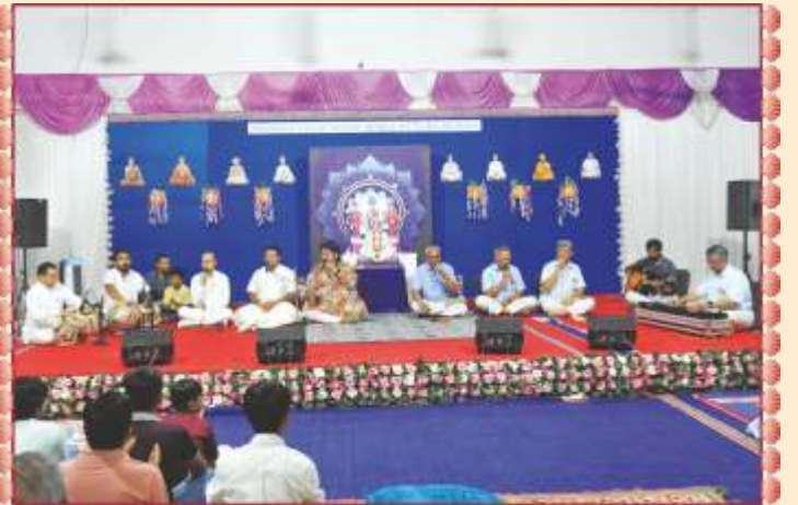
માણાવદર તીર્થમાં સાહેબજીના સાંનિધ્યે સંતો-યુવાનો દ્વારા અર્પણ કીર્તન આરાધના