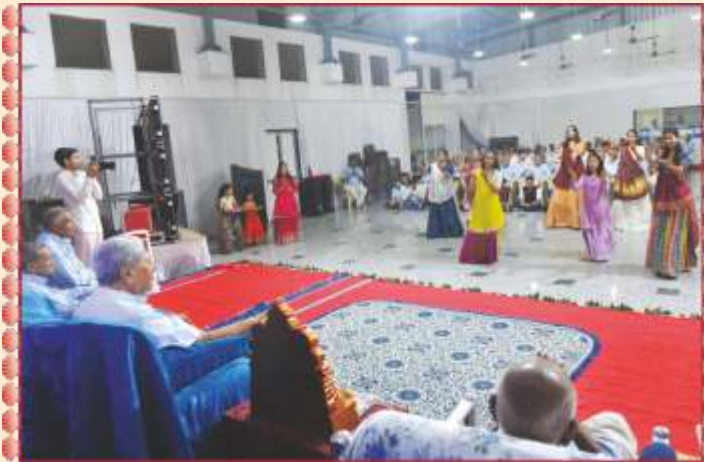
સ્વાગતનૃત્ય દ્વારા સાહેબજી અને સંતોનાં માણાવદર તીર્થમાં સ્વાગત

પાટોત્સવ વિધિ બાદ મંદિરની બહાર હોલમાં મુખ્ય સભાનું આયોજન કરવામાં આવ્યું. શ્રી ઠાકોરજી મહારાજ અને મંચસ્થ સૌનાં