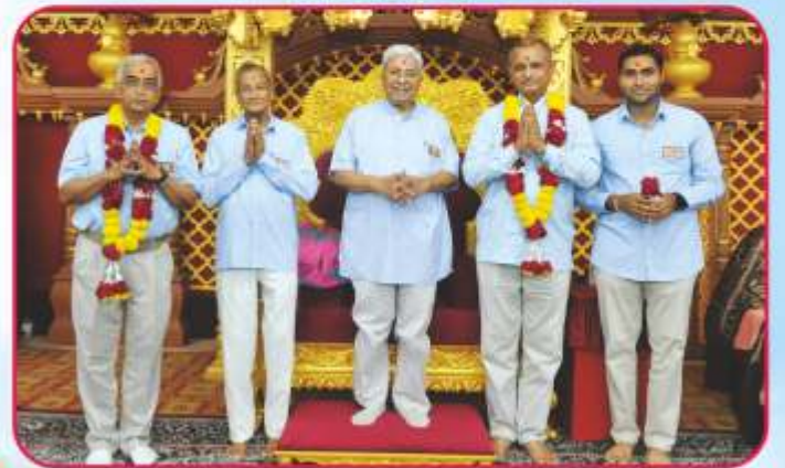
અમેરિકા-ઈંગ્લેન્ડની ધર્મયાત્રાએ પધારતા સંતોને આશીર્વાદન