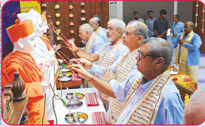
મુંબઈ-ખારધર મંદિરમાં મૂર્તિઓની પાટોત્સવ પૂજન વિધિ કરતા સંતો