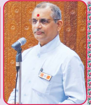
પાટોત્સવ સભામાં સદ્ગુરુ સંતો દ્વારા આશિષવર્ષા