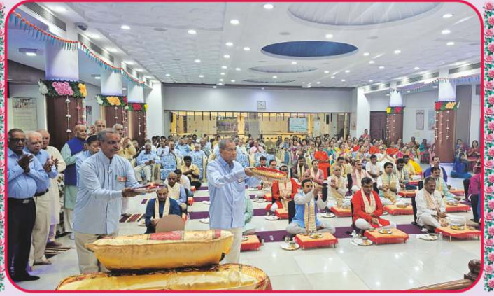
પાટોત્સવ આરતી અર્પણ કરતા સંતો અને યજમાન અક્ષરમુક્તો