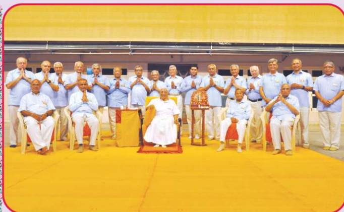
મુંબઈ-ખારધર મંદિરના પાટોત્સવ પ્રસંગે પધારેલ સંતોનાં તપોભૂમિ બ્રહ્મજ્યોતિમાં સ્વાગત