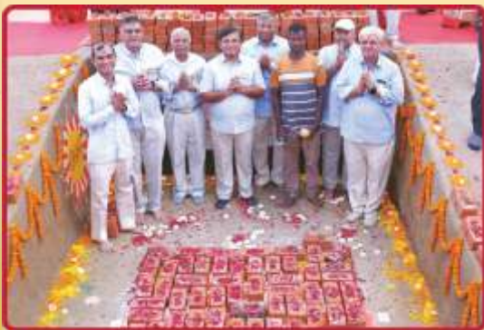
ખાતગર્તમાં ઇષ્ટિકા સ્થાપન સેવા કરનાર સંતો