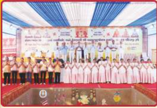
આતપંચેષ્ટિકા મહાપૂજન વિધિના આચાર્યો, ઋષિદુમારો-ઋષિકન્યાઓ