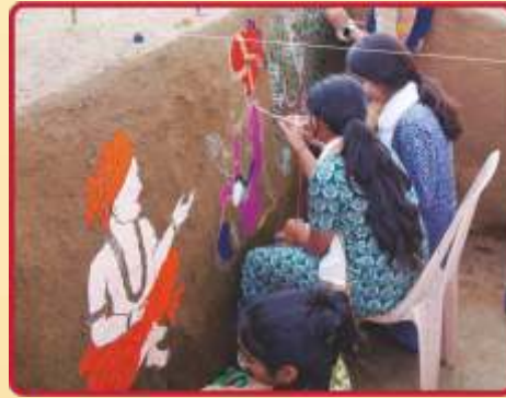
ખાતગર્તમાં શ્રી અક્ષરપુરુષોત્તમની છબિ...