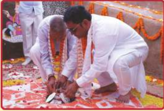
અલ્પ ખાતગર્તમાં પ્રાસાદિક નિધિકુંભનાં સ્થાપન