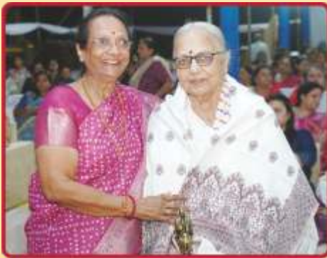
શ્રીમતી નિરંજનાબહેન કલાર્થીનાં સન્માન