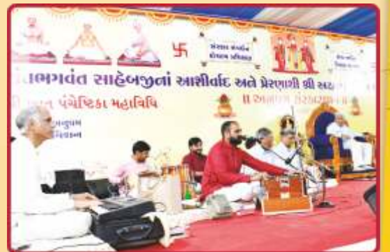
અનુપમ સૂરવંદના સંતો-યુવાનો દ્વારા કીર્તનભક્તિ અર્પણ