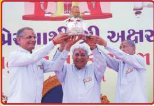
સાહેબજી અને સદ્ગુરુઓનાં હસ્તકમળમાં નિધિકુંભ