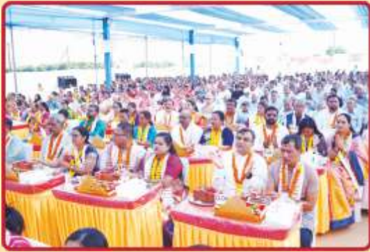
ખાતપંચેષ્ટિકા મહાપૂજનવિધિમાં બિરાજમાન ભાવિક યજમાનો