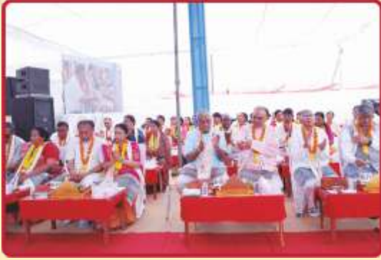
ખાતપંચેષ્ટિકા પૂજનવિધિમાં બિરાજમાન ભક્તિવંત યજમાનો