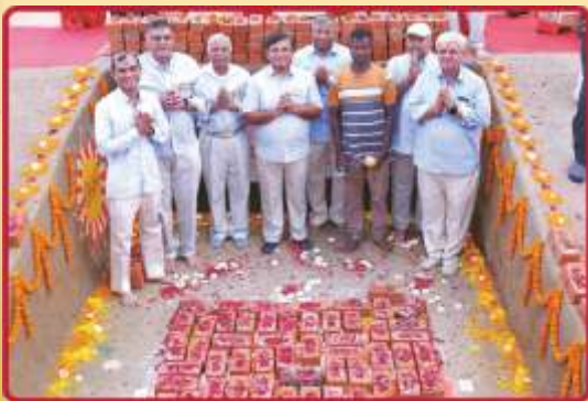
ખાતગર્તમાં ઈશ્ટિકા સ્થાપન સેવા કરનાર સંતો