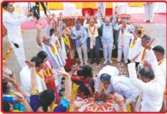
નિધિકુંભ ઉપર યજમાનો દ્વારા 'પૂર્ણા' ઈશ્ટિકાનાં સ્થાપન