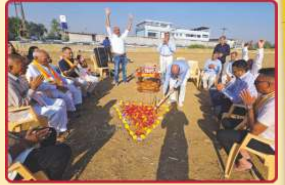
સંતોનાં સાંનિધ્યે ભૂમિપૂજન અને ખાતગર્ત નિર્માણ પ્રારંભ