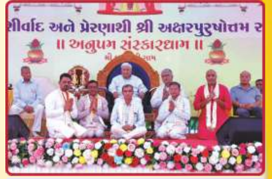
અનુપમ સંસ્કારધામના શિલ્પીઓને આશીર્વાદ