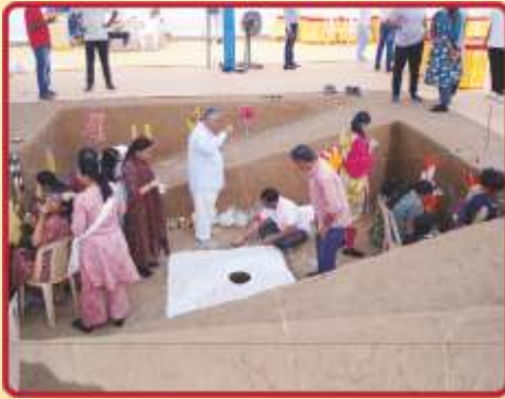
સંતોનાં માર્ગદર્શને ખાતગર્ત તૈયાર કરવાની સેવામાં રત સેવકો