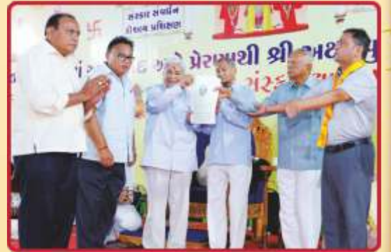
કાન્તુદાદા અને પરિવારજનો દ્વારા જમીનના દસ્તાવેજ અર્પણ