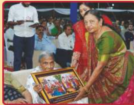
સમર્પિત અક્ષરમુક્ત પૂ. રૂખીબાનાં સન્માન