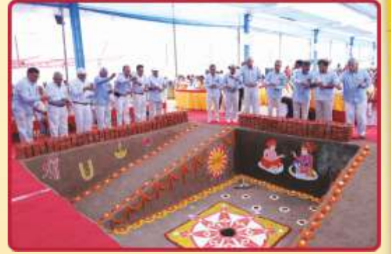
સંતો દ્વારા ખાતગર્તનાં પૂજન