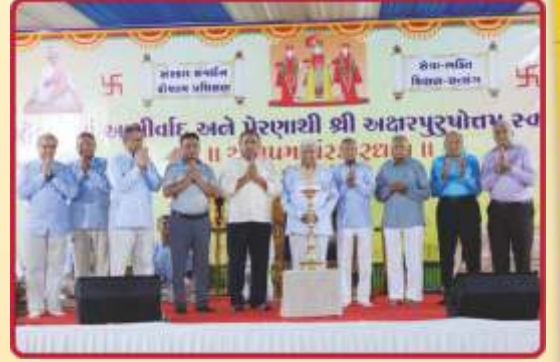
દીપપ્રાગટ્ય દ્વારા મહોત્સવના શુભારંભ