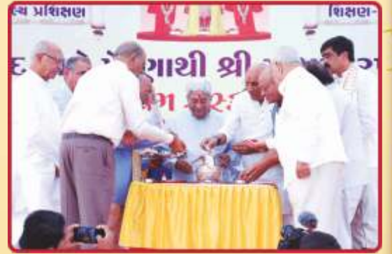
સાહેબજી અને મહાનુભાવો દ્વારા નિધિકુંભમાં પવિત્ર દ્રવ્યો અર્પણ