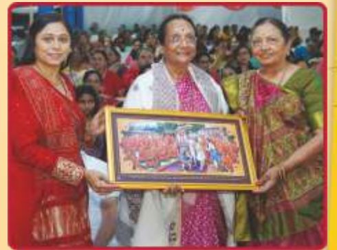
સમર્પિત અક્ષરમુક્ત પૂ. રંજનબાનાં સન્માન