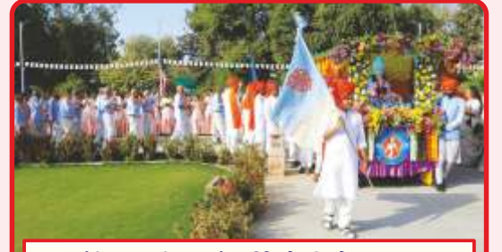
મંદિરજી પરિસરમાં મૂર્તિઓની શોભાયાત્રા