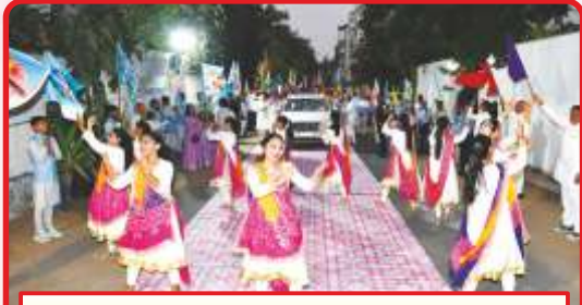
મહોત્સવ સ્થળે સાહેબજીનાં નૃત્યભક્તિ દ્વારા સ્વાગત