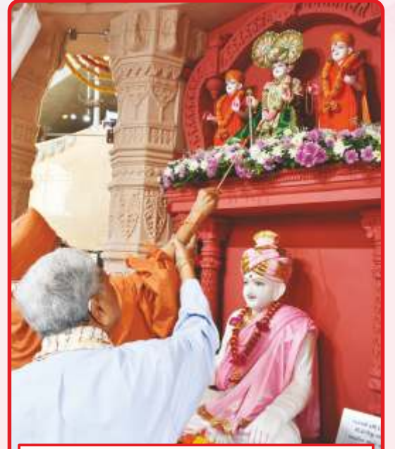
શ્રી ઠાકોરજી મહારાજ મૂર્તિ સ્થાપનવિધિ

ત્યારબાદ સૌ કોઈ અલકાપુરી ખાતે મહોત્સવસભા સ્થળે પધાર્યા. સભા પ્રારંભે મહોત્સવ સ્થળ પર સંતભગવંત સાહેબજી અને સદ્ગુરુ સંતોનાં શોભાયાત્રા અને નૃત્યભક્તિ સાથે વડોદરા, વેમાર, ભરૂચ અને અંકલેશ્વર મંડળના ભક્તોએ ભવ્ય સ્વાગત કર્યાં. સ્વાગતયાત્રા બાદ યુવાનોએ શ્રી ભગતજી તીર્થના નિર્માણની અને ગુરુઆજ્ઞાના