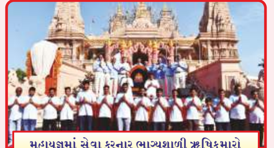
મહાયજ્ઞમાં સેવા કરનાર ભાગ્યશાળી ઋષિકુમારો