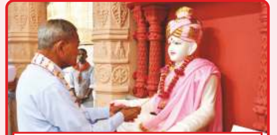
શ્રી ભગતજી મહારાજ મૂર્તિ સ્થાપનવિધિ