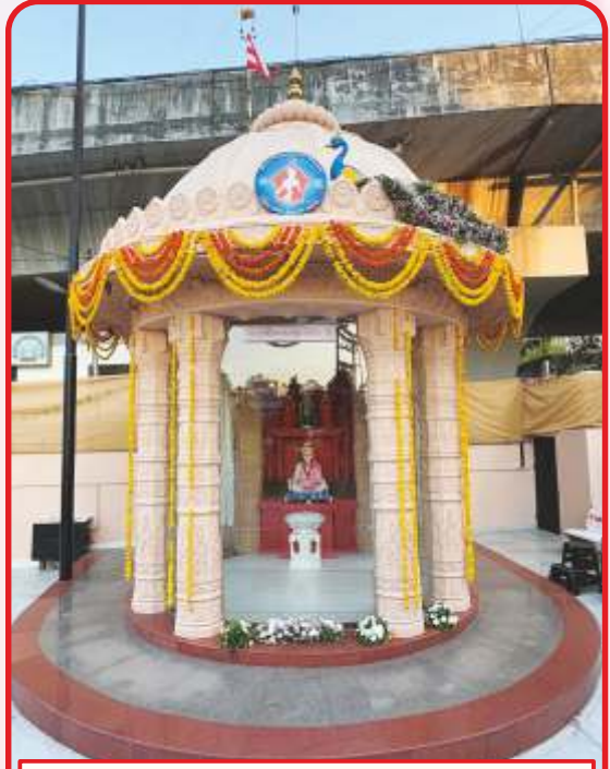
પ્રાસાદિક શ્રી ભગતજી તીર્થ, અટલાદરા