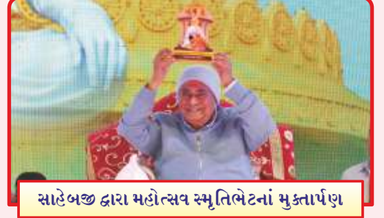
સાહેબજી દ્વારા મહોત્સવ સ્મૃતિભેટનાં મુક્તાર્પણ