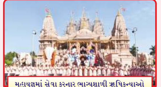
મહાયજ્ઞમાં સેવા કરનાર ભાગ્યશાળી ઋષિકન્યાઓ