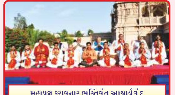
મહાયજ્ઞ કરાવનાર ભક્તિવંત આચાર્યવુંદ