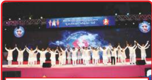
વડોદરા પ્રદેશના યુવાનો દ્વારા નૃત્યભક્તિ