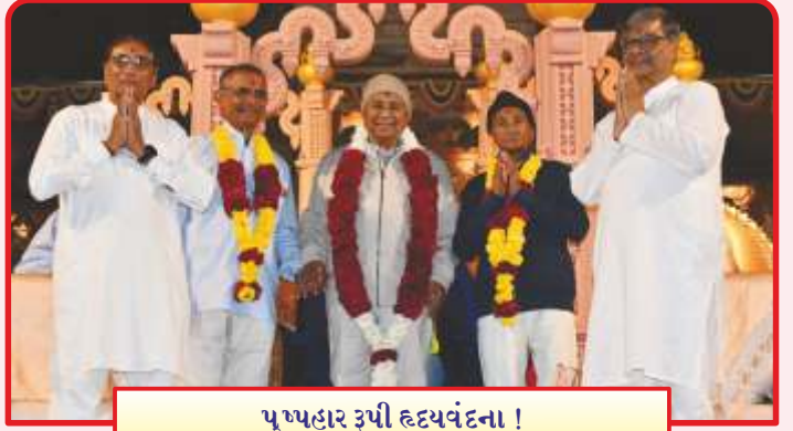
પુષ્પહાર રૂપી દ્વયવંદના !