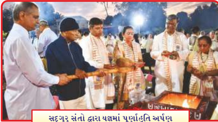
સદ્ગુરુ સંતો દ્વારા યજ્ઞમાં પૂર્ણાહુતિ અર્પણ