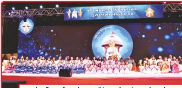
સાંસ્કૃતિક કાર્યક્રમમાં ભાગ લીધેલ અને મહોત્સવ સેવામાં પ્રવૃત્ત વડોદરા અને કાનમ પ્રદેશનાં જોશીલા ભક્તિવંત યુવાનો-યુવતીઓ