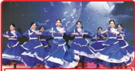
અંકલેશ્વર મંડળની દીકરીઓ દ્વારા નૃત્યભક્તિ