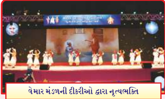
વેમાર મંડળની દીકરીઓ દ્વારા નૃત્યભક્તિ