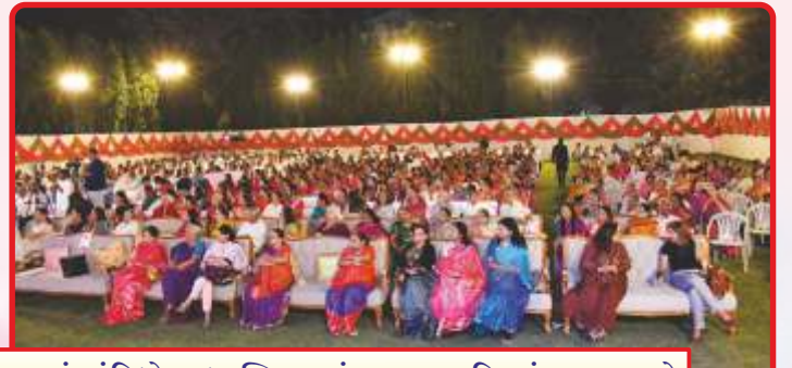
વડોદરા ખાતે યોજિત શ્રી ભગતજી તીર્થ મહોત્સવનો સંતભગવંત સાહેબજીનાં સાંનિધ્યે આધ્યાત્મિક આનંદ માણતા મહિમાવંત અક્ષરમુક્તો