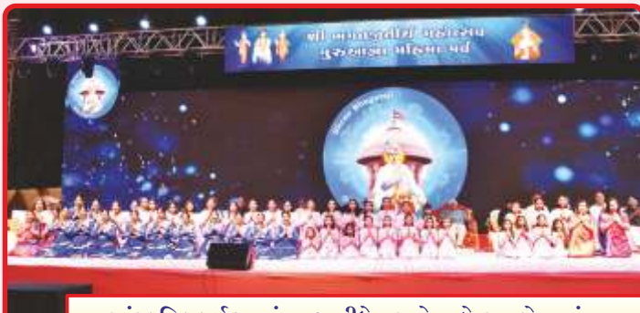
સાંસ્કૃતિક કાર્યક્રમમાં ભાગ લીધેલ અને મહોત્સવ સેવામાં પ્રવૃત્ત વડોદરા અને કાનમ પ્રદેશનાં જોશીલા ભક્તિવંત યુવાનો-યુવતીઓ