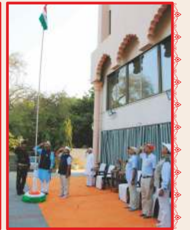
ભારતના ૭૬મા પ્રજાસત્તાક પર્વની ઉજવણી : નડિયાદ... શિણાય-કચ્છ... ધારી... ઉપાસના ધામ-અમદાવાદ