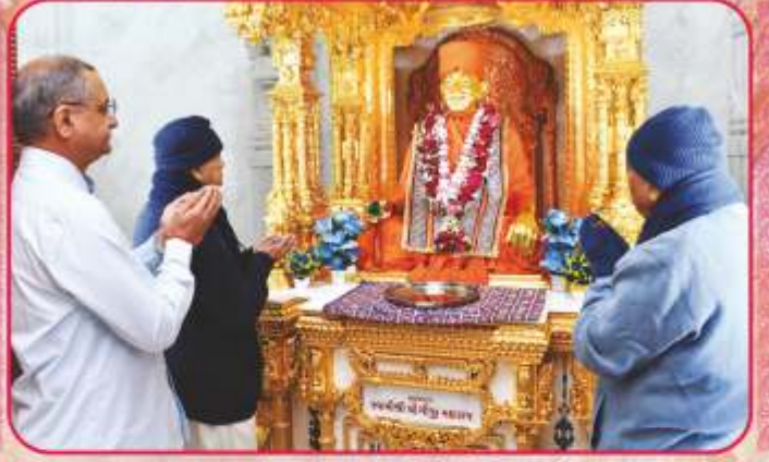
શ્રી યોગી શાશ્વત સ્મૃતિદિને મંદિરજીમાં પ્રાર્થનાંજલિ અર્પણ