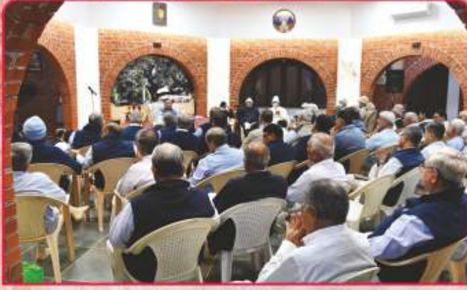
પોષીપૂર્ણિમા નિમિત્તે સંતસભામાં સંતભગવંત સાહેબજીનાં આશીર્દાન