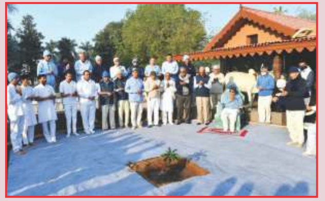
પ્રાસાદિક આમ્રવૃક્ષના વાવેતર પ્રસંગે સંતો સાથે ધૂન-પ્રાર્થના અર્પણ

૩૧ જાન્યુઆરી, શુક્રવાર... 'ઉપાસના'ના 'સામીપ્ય'માં સંતો-ભક્તોને ગોષ્ઠિનો લાભ આપ્યો. ◆