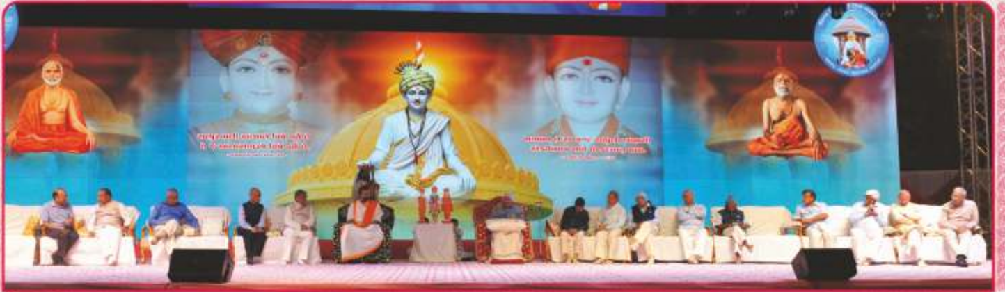
શ્રી ભગતજી તીર્થ મહોત્સવની પૂર્ણાહુતિ સભાનાં મંચદર્શન