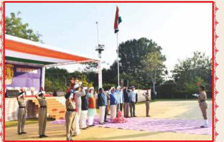
પ્રજ્ઞાનતીર્થ, મોગરી ખાતે ભારતના ૭૬મા પ્રજાસત્તાક પર્વની ઉજવણી