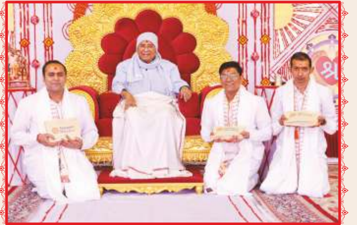
નવદીક્ષિત સંતોને સાહેબજીનાં આશીર્દાન