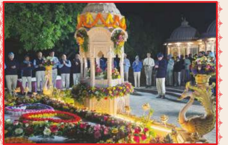
પૂ. શાંતિદાદાના નિર્વાણ સ્મૃતિદિને તેઓના સમાધિસ્થાને પ્રાર્થનાંજલિ અર્પણ