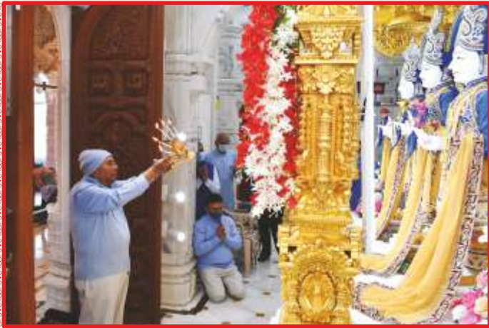
બ્રહ્મજ્યોતિ, મોગરીના મંદિરજીની મૂર્તિઓના પંચમ પાટોત્સવની આરતી અર્પણ