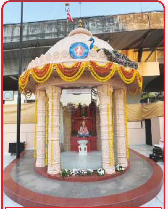
પ્રાસાદિક શ્રી ભગતજી તીર્થ, અટલાદરા

પાલનની અલૌકિક ગાથાને નૃત્ય અને પ્રિરે કોર્ડેડ વિડિયો સંવાદ સાથે અત્યંત ભકિતસભર સાંસ્કૃતિક કાર્યક્રમ દ્વારા પ્રસ્તુત કરી. ભગવાન શ્રી સ્વામિનારાયણ, શ્રી ગુણાતીતાનંદ સ્વામી, શ્રી ગોપાળાનંદ સ્વામી, શ્રી ભગતજી મહારાજ, શ્રી શાસ્ત્રીજી મહારાજ, શ્રી યોગીજી મહારાજ અને સંતભગવંત સાહેબજીના મહિમા સાથે શ્રી અક્ષર પુરુષોત્તમ