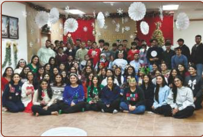
શ્રી યોગી યુવા લીડરશિપ રિટ્રીટમાં સંતોનાં સાંનિધ્યે સૌ શિબિરાર્થીઓ