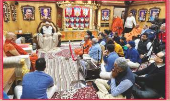
દિલ્લી મંદિરે પ.પૂ. ગુરુજીના સાંનિધ્યમાં યોજિત સભામાં સાહેબજીનાં આશીર્વાદન