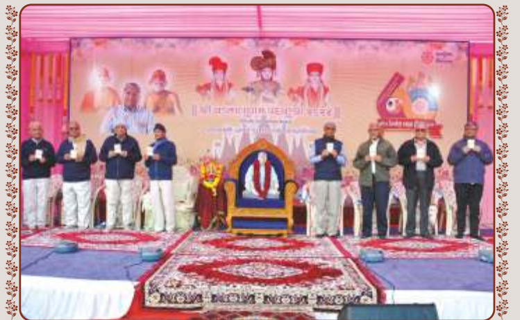
શ્રી વડતાલધામ પદયાત્રા પ્રસંગે 'સ્મરણ સુધા' પુસ્તિકાનાં મુક્તાર્પણ