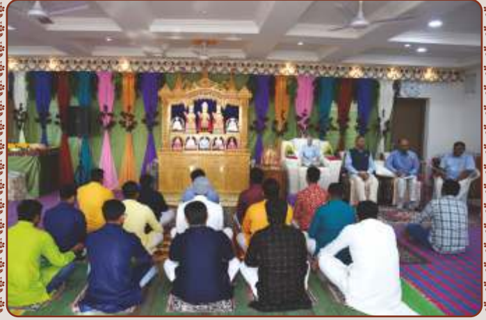
ઉપાસના ધામ, શિણાય-કચ્છ મંદિરમાં પ્રથમ પાટોત્સવ પૂજા