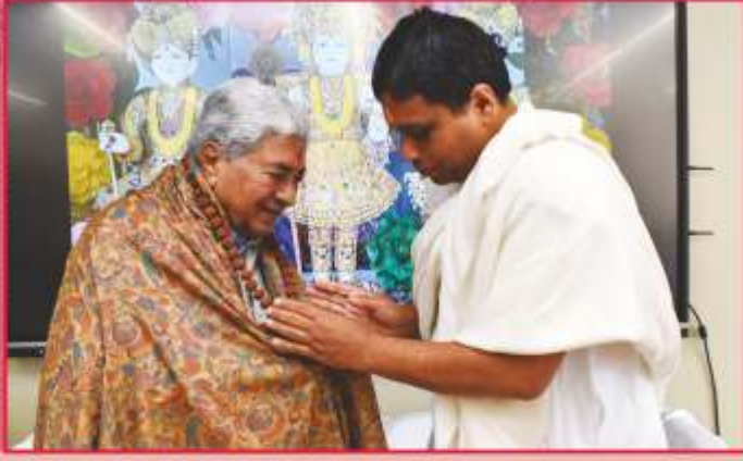
પતંજલિ યોગપીઠ, હરિદ્વારના આચાર્ય શ્રી બાલકૃષ્ણજી દ્વારા સાહેબજીનાં સન્માન