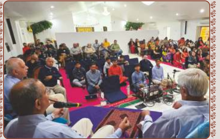
લૉસ એન્જલસ-યુ.એસ.એ. મંદિરે સત્સંગસભામાં સંતો-અક્ષરમુક્તો