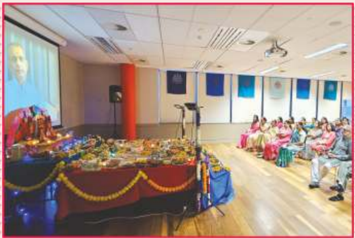
ઓસ્ટ્રેલિયાના સિડની મંડળનો ભક્તો દ્વારા અન્નકૂટ ઉત્સવની ઉજવણી