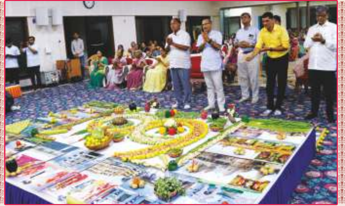
ઉપાસના ધામ, વેમાર મંદિરે સંતોનાં સાંનિધ્યે શાકોત્સવ