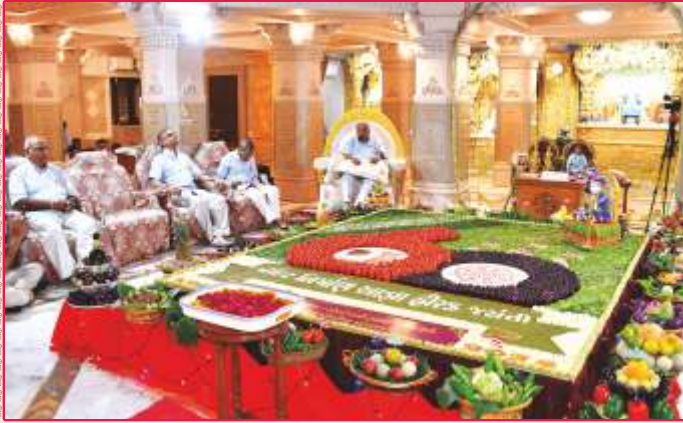
તપોભૂમિ બ્રહ્મજ્યોતિ, મોગરીમાં શાકોત્સવ પ્રસંગે સાહેબજીનાં આશીર્દાન