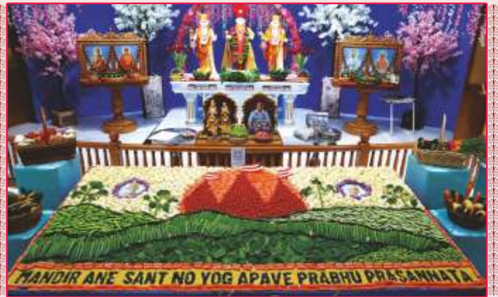
અમેરિકાના એવનટાઉન મંદિરે શાકોત્સવ ભક્તિ અર્પણ