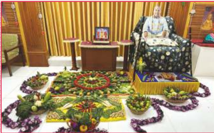
ઉપાસના ધામ, સુરત મંદિરમાં શાકોત્સવની ભક્તિવંત ઉજવણી