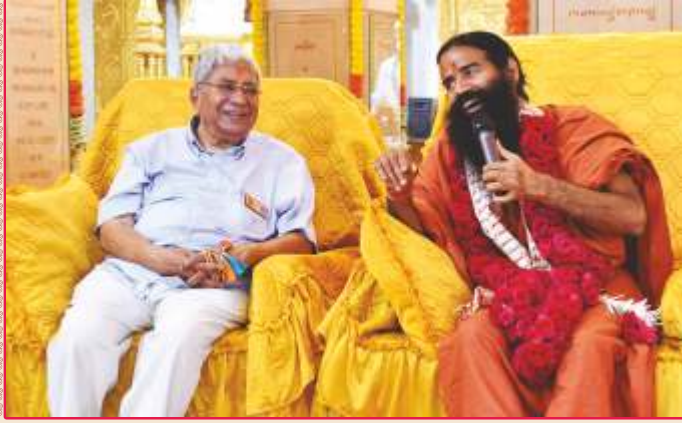
તપોભૂમિ બ્રહ્મજ્યોતિ પર સભામાં યોગગુરુ સ્વામી પ.પૂ. રામદેવજીનાં આશીર્દાન