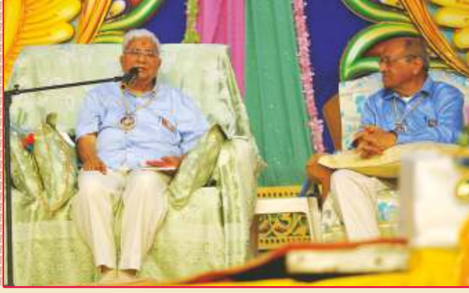
પપ્પાજી તીર્થ, ગાના ખાતે 'પપ્પાજી દિવ્ય પ્રકાશપર્વ'માં સાહેબજીનાં આશીર્દાન