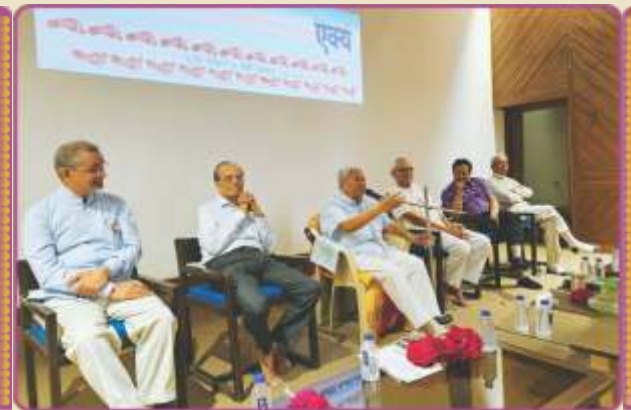
સિનિયર સિટિઝન ફોરમ દ્વારા યોજિત 'ઐક્ય' કાર્યક્રમમાં આશીર્દાન

૧૪ નવેમ્બર, ગુરુવાર... સવારે રાજભોગ આરતીમાં પધારી કીર્તનભક્તિનો આનંદ માણ્યો તથા સભામાં ઉપસ્થિત સૌ ભક્તોને આશીર્વાદ આપ્યા.