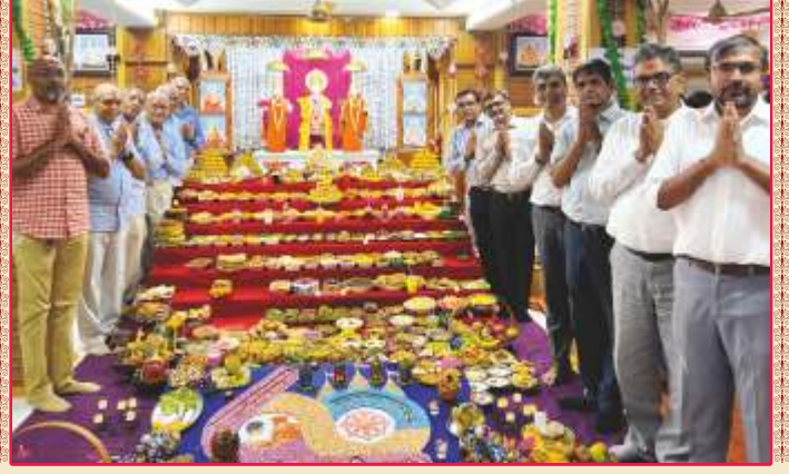
ઉપાસના ધામ, સુરત મંદિરમાં અન્નકૂટ ભક્તિ અર્પણ