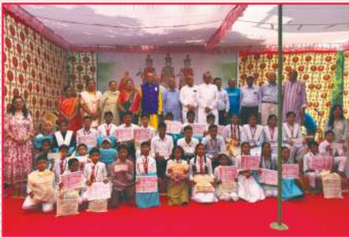
गुरगौलामां साहेबजी शिखरेंशन द्वारा तेजस्वी विद्यार्थियोंनां सन्मान