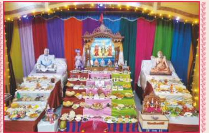
શ્રી અક્ષરપુરુષોત્તમ સ્વામિનારાયણ મંદિર, સાઠંબામાં અન્નકૂટ ઉત્સવ