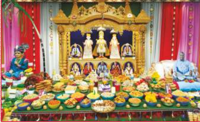
ઉપાસના ધામ, શિણાય-કચ્છ ખાતે અન્નકૂટ ભક્તિ અર્પણ