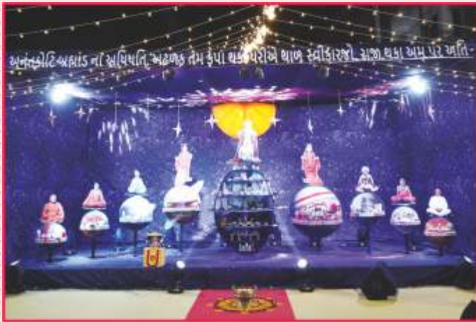
ઉપાસના ધામ, અંકલેશ્વરમાં અન્નકૂટ ઉત્સવ

ઉપાસના ધામ, અમદાવાદ : ૧૫ નવેમ્બર ૨૦૨૪, શુક્રવારના રોજ દેવદિવાળીના પવિત્ર અવસરે અમદાવાદ પ્રદેશના ભક્તોએ ઉપાસના ધામ, અમદાવાદ ખાતે સંતો, ભક્તોનાં સાંનિધ્યે અન્નકૂટ