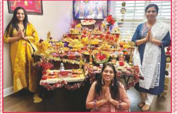
અમેરિકાના અલાબામા મંડળમાં અન્નકૂટ ઉત્સવની ઉજવણી

સત્સંગલાભ મેળવ્યો અને ભક્તિ વહાવી. વિવિધ થાળનાં ભાવવાદી ગાન કરીને શ્રી ઠાકોરજીને જમાડ્યા અને અંતે આરતી અર્પણ કરી. સૌએ સંપ, સુહૃદભાવ અને એકતાથી ભેગાં મળીને ખૂબ સેવાઓ કરી, સ્મૃતિઓ મેળવી આનંદ માણ્યો. ◆