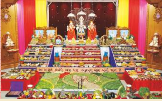
ઉપાસના ધામ, અમદાવાદ મંદિરમાં અન્નકૂટ અર્ધ અર્પણ