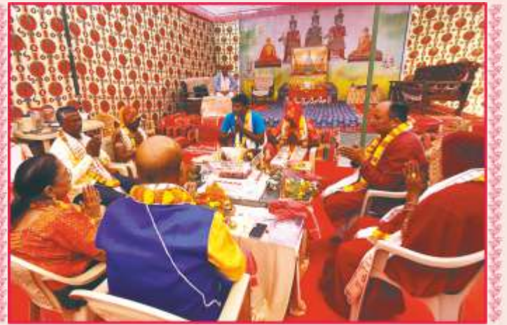
વ્રતધારી સંતો દ્વારા ગુરગૌલા સ્થિત મંદિરજીનાં પાટોત્સવ પૂજનયજ્ઞ