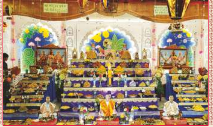
અમેરિકાના ઉપાસના ધામ, ફ્લોરિડા મંદિરમાં અન્નકૂટ ઉત્સવની ભક્તિભાવે ઉજવણી