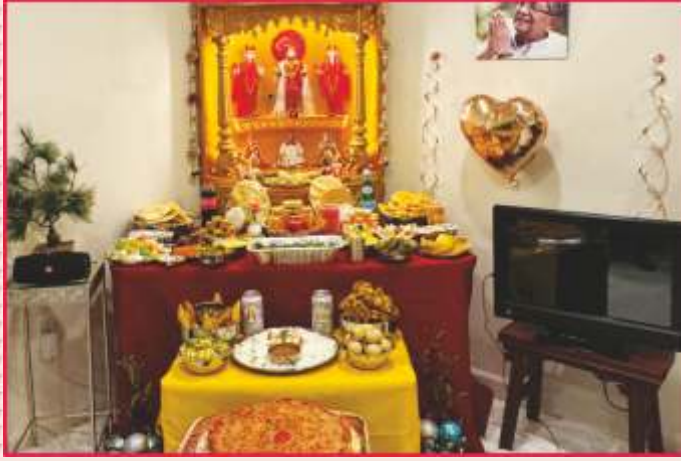
અમેરિકાના મિશિગન મંડળના ભક્તો દ્વારા અન્નકૂટ ભક્તિ અર્પણ