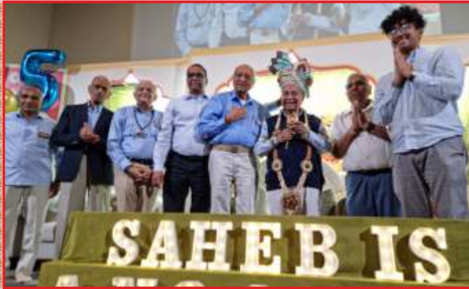
शिकागो-यु.अस.अ.मां प.पू. दिनकर अंकलना ८०मा तथा संतभगवंत साहेबज्जना ८५मा प्रागट्योत्सव प्रसंगे साहेबज्जनां पूजन-अभिवादन... आशीर्दान