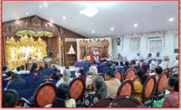
नोरवॉक-वॉस अंन्ववस मंदिरे सभामां संतभगवंत साहेबज्जना आशीर्वाद