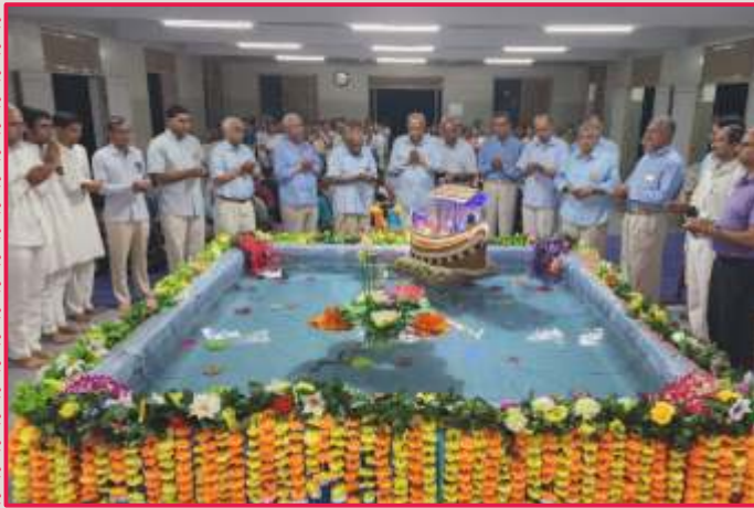
ગુરુસભામાં જળજીવણી ઉત્સવમાં સંમિલિત સંતો-ભક્તો