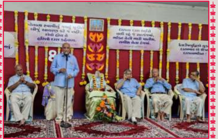
ગુરુસભામાં પ્રાગટ્યપર્વની ઉજવણી પ્રસંગે સદ્ગુરુ સાધુ પૂ. રતિકાકાનાં આશીર્વાદ