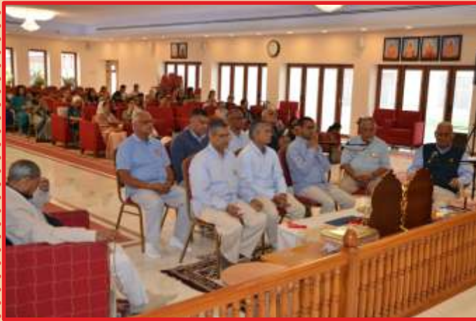
ડેનહમ-ઈંગ્લેન્ડ મંદિરે સર્વપિતૃ શ્રાદ્ધની મહાપૂજામાં પ્રાર્થનારત સંતો