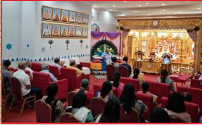
रिचमंड मंदिरे महापूजामां संतभगवंत साहेबज्जना आशीर्वाद