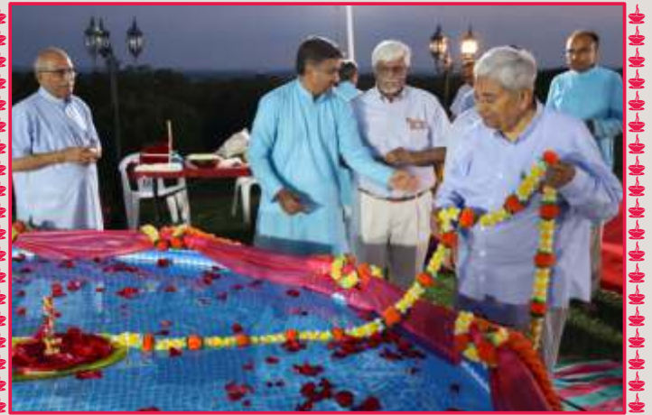
એલનટાઉન-યુ.એસ.એ. મંદિરે શ્રી ઠાકોરજીને જળવિહાર કરાવતા સંતભગવંત સાહેબજી