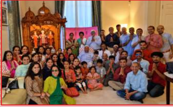
सानझान्सिસ્કોથી विदाय पूर्वें मंडगना सौ भक्तोने संतभगवंत साहेबज्जना आशीर्वाद