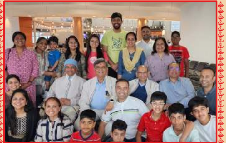
બ્રિસ્બેન એરપોર્ટ પર સૌ ભક્તો દ્વારા સંતોને ભાવભરી વિદાય