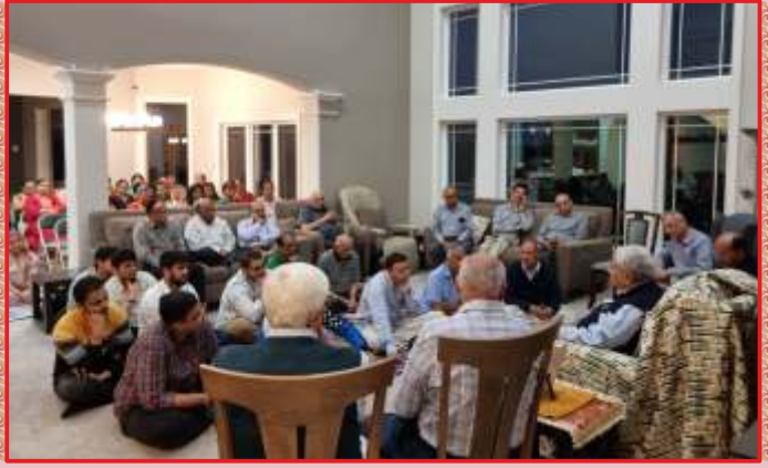
मिलवॉकी-यु.अस.अ. मंडगनी सभामां संतभगवंत साहेबज्जना आशीर्वाद