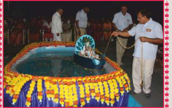
ઉપાસના ધામ-અમદાવાદ મંદિરે સંતો દ્વારા શ્રી ઠાકોરજીને જળકુંડમાં જળવિહાર