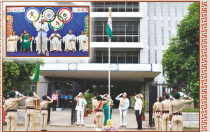
પ્રજ્ઞાનતીર્થ, મોગરીમાં સ્વતંત્રતા પર્વની ઉજવણી