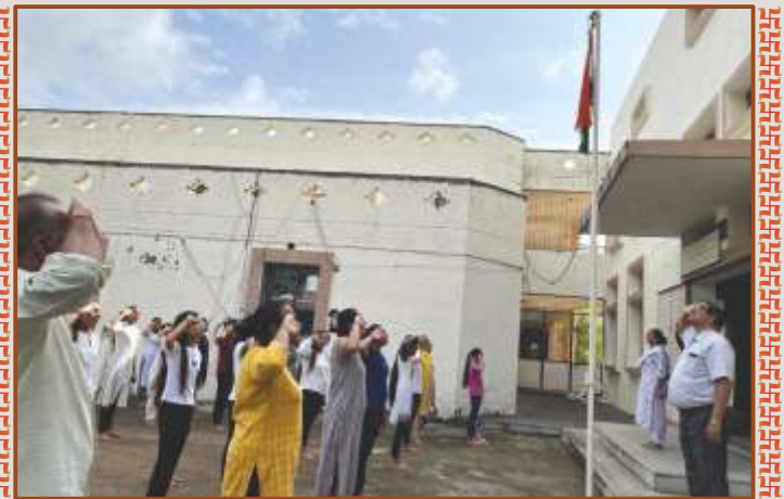
યોગીજી મહારાજ મહાવિદ્યાલય, ધારીમાં સ્વતંત્રતા પર્વની ઉજવણી