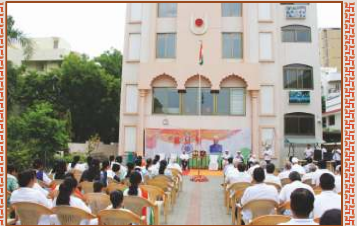
ઉપાસના ધામ, અમદાવાદમાં સ્વતંત્રતા પર્વની ઉજવણી