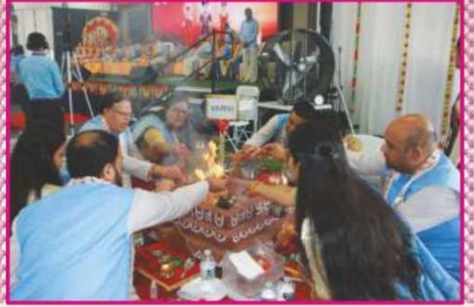
'શ્રી જી' વેદી પર યજ્ઞવિધિમાં રત યજ્ઞમાન ભક્તો

બંસરી, સહેલીની આગેવાની હેઠળ રિયમંડ-વર્જિનિયાનાં બહેનો-ભાઈઓ અને સૌ યુવાનો-યુવતીઓ-ભક્તોએ યજ્ઞની પૂર્વતેયારી તથા