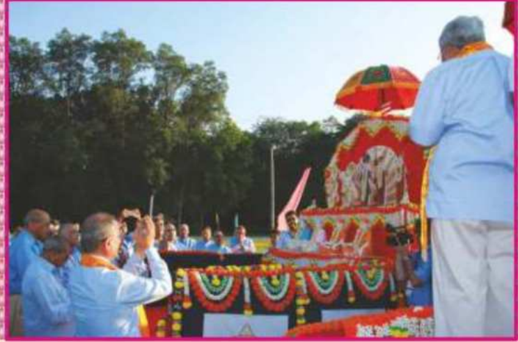
નગર શોભાયાત્રા માટે કલાત્મક રથમાં બિરાજમાન શ્રી ઠાકોરજી સમક્ષ ધૂન-પ્રાર્થના