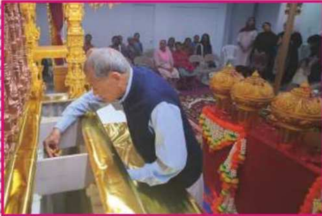
ગર્તપૂજન... ગર્તમાં માટી અર્પણ... શ્રી કળશપૂજન