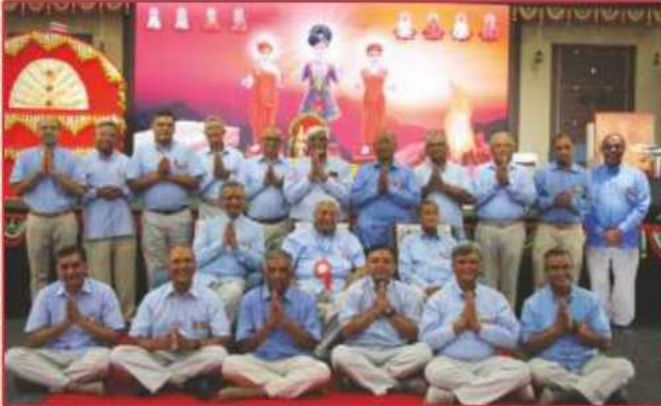
મંદિર મૂર્તિપ્રતિષ્ઠા મહોત્સવ પ્રસંગે સંતભગવંત સાહેબજીનાં સાંનિધ્યમાં વ્રતધારી સંતો