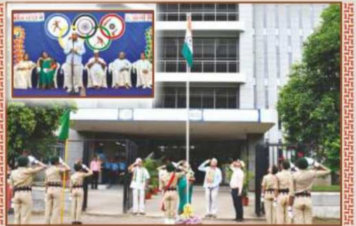
પ્રજ્ઞાનતીર્થ, મોગરીમાં સ્વતંત્રતા પર્વની ઉજવણી