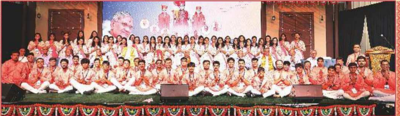
શ્રી સ્વામિનારાયણ મંદિર મૂર્તિપ્રતિષ્ઠા મહોત્સવનાં સ્વયંસેવક યુવકો-યુવતીઓને સંતભગવંત સાહેબજી અને સદ્ગુરુ સંતોના આશીર્વાદ