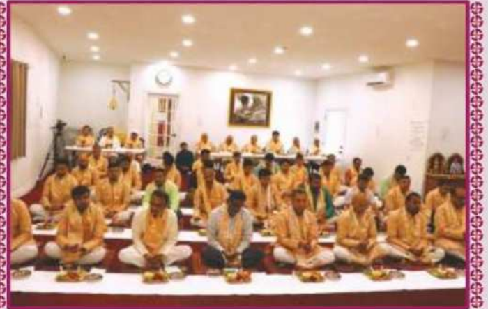
પાટોત્સવ પૂજનવિધિનો લાભ લેતા કેનેડાના અભ્રમુક્તો