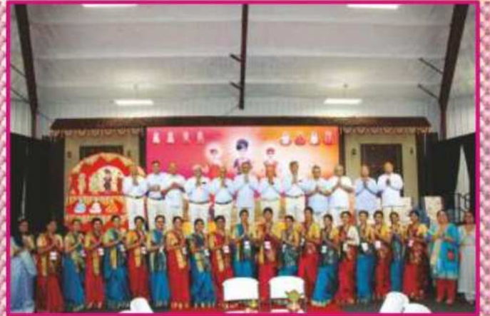
મહાયાગની સેવા માટે ઋષિકન્યાઓને અધિકાર અર્પણ