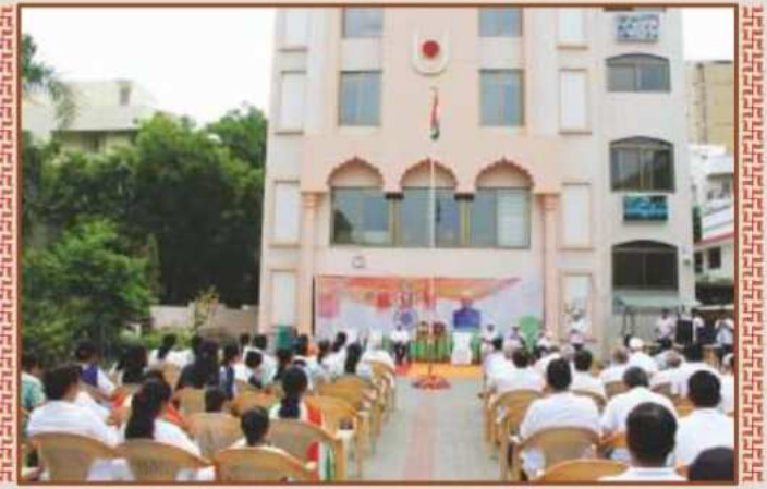
ઉપાસના ધામ, અમદાવાદમાં સ્વતંત્રતા પર્વની ઉજવણી