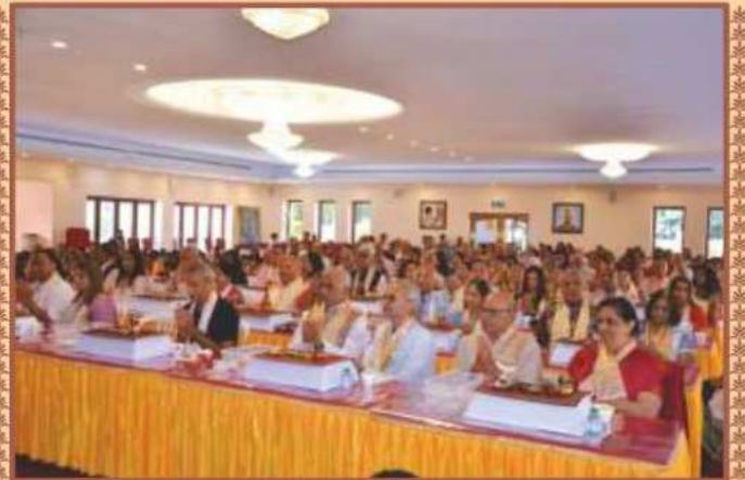
ૐનંદમ-યુ.કે. સ્થિત મંદિરજનાં પાટોત્સવ પૂજન અને શ્રાવણ માસની સમૂહ મહાપૂજા વિધિમાં શ્રદ્ધાપૂર્વક ભાગ લેતા ભાવિક અક્ષરમુક્તો