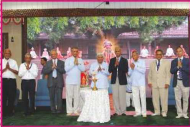
સંતભગવંત સાહેબજીની દિવ્ય નિશ્રામાં દીપપ્રાગટ્ય દ્વારા મહોત્સવના શુભારંભ

ત્યારબાદ સંતભગવંત સાહેબજીએ આશીર્વાદ આપતાં જણાવ્યું કે, "ભગવાન સદા સાકાર છે અને પ્રગટ છે. આપણા જીવનમાં જે કંઈ થયું છે, જે કંઈ થઈ રહ્યું છે અને જે કંઈ થશે એના કરનારા આપણા પ્રભુ જ છે. અને તેઓ જે કંઈ કરે છે તે આપણા સારા માટે જ કરે છે, કારણ કે, પ્રભુ ભક્તોના સદાય હિતકારી છે, હેતકારી છે. આવું માનવું તે પ્રભુ તરફની આપણી નિષ્ઠા છે. ગુણાતીતભાવને પામેલા સાધુ થકી ભગવાન હંમેશાં પ્રગટ છે. એવા સાધુમાં આત્મબુદ્ધિ ને પ્રીતિ કરવી એ આપણા જીવનનું મૂળ કાર્ય છે. બે હાથ જોડીને તેઓની આજ્ઞા પાળવી એ પ્રભુને રાજ કરવા માટેની