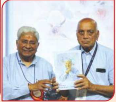
'ગુરુહરિ સાહેબજી કહે છે : સો વાતની એક વાત !' લાલાસાહેબ દ્વારા મુક્તાર્પણ