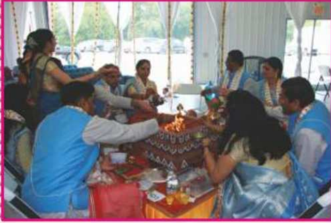
'શ્રી હરિ' વેદી પર યજ્ઞવિધિમાં રત યજ્ઞમાન ભક્તો

સમગ્ર મહાયજ્ઞ અત્યંત ભક્તિભાવથી અર્પણ થયો. મહાયજ્ઞના અંતભાગમાં ત્રણ મુખ્ય યજ્ઞવેદીઓમાં પૂર્ણાહુતિનાં શ્રીકૃષ્ણ સંતભગવંત