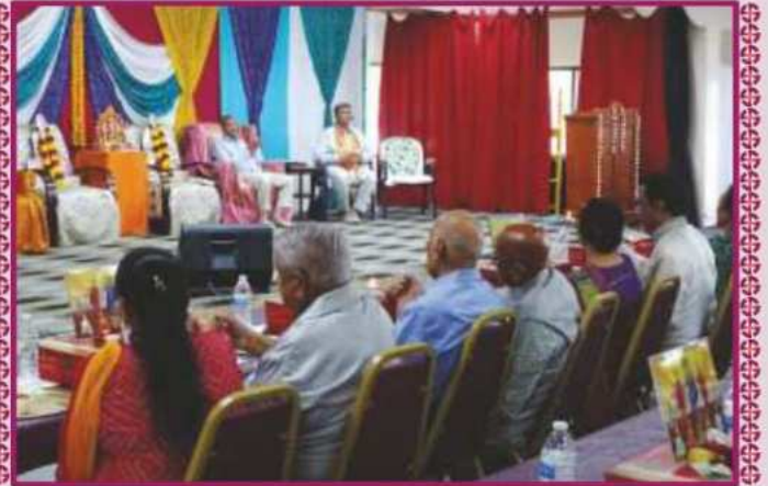
લેકલેન્ડ, ક્વોરિડાના ઉપાસના ધામ ખાતે સંતોની સંનિધિમાં સમૂહ મહાપૂજા