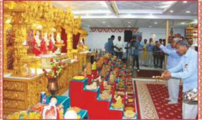
સંતભગવંત સાહેબજી અને સંતો દ્વારા આરતી અર્પણ