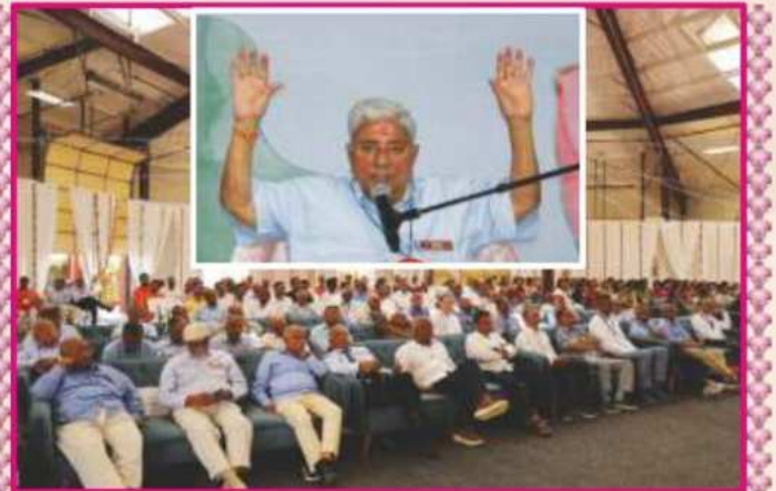
માહાત્મ્યદર્શન સભામાં ઉપસ્થિત સંતો-ભક્તો પર સાહેબજીનાં આશીર્દાન