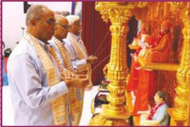
કેનેડા મંદિરના પ્રથમ પાટોત્સવે મૂર્તિઓની પૂજનવિધિ કરતા સંતો