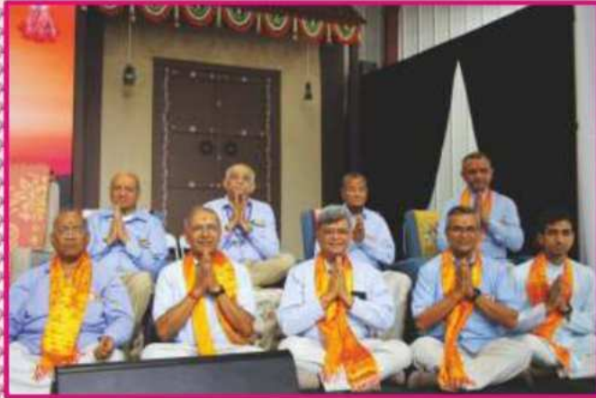
મહાયાગના ભક્તિસભર આચાર્યશ્રીઓ