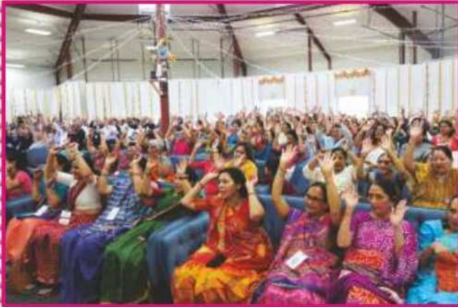
મંદિર મહોત્સવ સભામાં ભાગ લેનાર ભાગ્યશાળી દેશ-વિદેશના અક્ષરમુક્તો