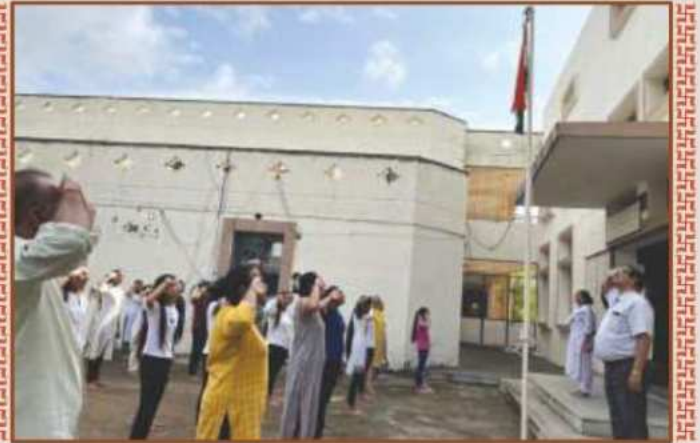
યોગીજી મહારાજ મહાવિદ્યાલય, ધારીમાં સ્વતંત્રતા પર્વની ઉજવણી