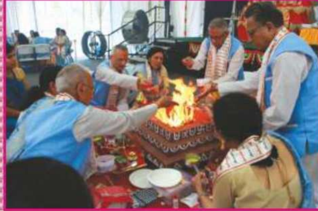
'શ્રી વર્ણી' વેદી પર યજ્ઞવિધિમાં રત યજ્ઞમાન ભક્તો

આનંદની અનુભૂતિ થઈ. આવા દિવ્ય મહાયાગમાં લાભ લેવાનું સૌભાગ્ય પ્રાપ્ત કરાવવા બદલ સૌ સાહેબજીને વંદી રહ્યાં.