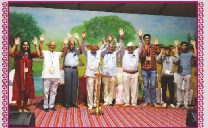
કેનેડામાં યોગી યૂથ કેમ્પનો દીપપ્રાગટ્ય દ્વારા શુભારંભ

અલગ અલગ ગ્રંથોના આધારે ગ્રુપ ચર્ચા દ્વારા શાસ્ત્રોક્ત બોધને રોજિંદા જીવનનાં આચરણમાં લાવી સુખમય જીવન જીવી શકાય તેની ખૂબ સુંદર સમજણ આપવામાં આવી. સંતો સાથે સુંદર પ્રશ્નોત્તરી સત્ર, ક્વિઝ, સાંસ્કૃતિક કાર્યક્રમનાં આયોજન કરવામાં આવ્યાં. રોજ સાંજે