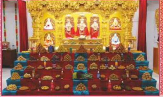
શ્રી ઠાકોરજીને અત્યંત ભાવથી અન્નકૂટ અર્ધ અર્પણ