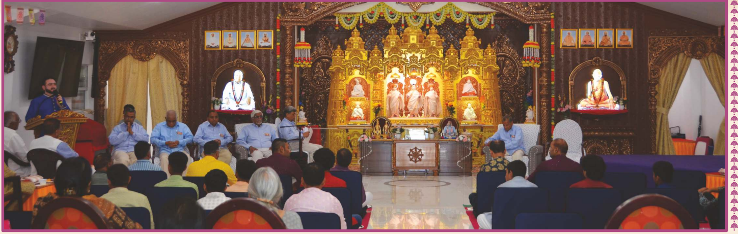
લોસ એન્જલસ-યુ.એસ.એ. મંદિરમાં બિરાજિત મૂર્તિઓના પ્રથમ પાટોત્સવપર્વની ભક્તિભાવે ઉજવણી