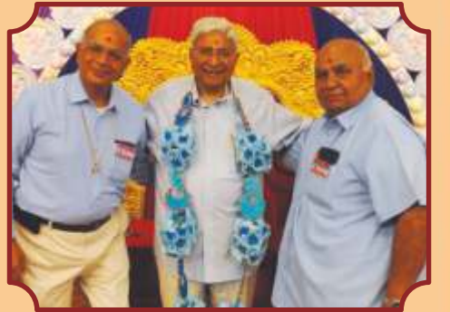
ગુણાતીત જ્યોતનાં સંત બહેનો અને વ્રતધારી સંતો વતી ભક્તિભાવ અર્પણ