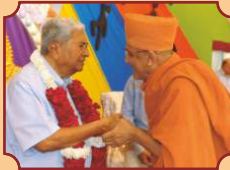
હરિધામ-સોખડાના સંતો-ભક્તો વતી પુષ્પહાર અર્પણ