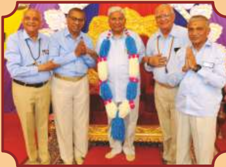
યોગી ઉવાઈન સોસાયટી-પવઈના સંતો વતી હૃદયભાવ અર્પણ

ગુરુહરિના પ્રાગટ્યના રંગે રંગાઈ, અંતરથી માહાત્મ્યધારામાં ભીંજાઈ, ભક્તિભાવથી સભર બની સૌ ધન્ય થયાં. અપાર આનંદ લઈ સૌ નવા જોશ, ઉમંગ અને આનંદ સાથે વિસર્જિત થયાં. આ મહાપર્વનાં આયોજન-વ્યવસ્થાપન માટે અનુપમ મિશનના સંતો સાથે પ્રત્યેક પ્રદેશના યુવા કાર્યકર્તાઓએ રસોડા, સુશોભન, સ્વાગત સરભરા, ઉતારા, સભા-બેઠક વ્યવસ્થા, મંચવ્યવસ્થા, ફોટોગ્રાફી, વિડિયોગ્રાફી, સંગીત, જીવંત પ્રસારણ, સફાઈ, સભાસંચાલન આદિ બધા વિભાગોની જવાબદારીઓ અત્યંત નિષ્ઠાપૂર્વક નિભાવી અને શોભાડી તો સમૈયો સર્વાંગે સર્વોપરી ઉજવાયો અને સૌ પર સંતભગવંત સાહેબજી અને સદ્ગુરુ સંતોની અંતરની પ્રસન્નતા વરસી. ◆