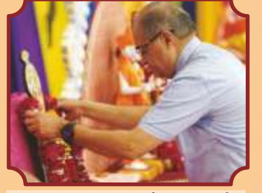
બ્રહ્મસ્વરૂપ ભગતજી મહારાજને પુષ્પહાર અર્પણ

જીવનવૃત્તાંતનાં દર્શન માણી સૌને થયું કે, આ જ ખરા અર્થમાં પ્રાગટ્યદિનની અભિવંદના છે ! ઉપસ્થિત શ્રોતાજનોનાં હૈયાં આ બ્રહ્મપ્રસાદની પ્રાપ્તિથી પરિવૃત્ત થયાં. સાધનામાર્ગે, ભક્તિપથ