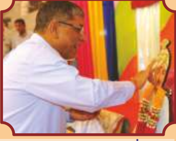
બ્રહ્મસ્વરૂપ ભગતજી મહારાજનાં પૂજન

૨૪ માર્ચ ૨૦૨૪, ફાગણ સુદ પૂર્ણિમા, હોળીના મંગલકારી દિવસે બ્રહ્મસ્વરૂપ ભગતજી મહારાજનો ૧૯૬મો પ્રાગટ્યદિન અપાર મહિમા અને ભક્તિભાવ સાથે ઉજવાયો. સભા પ્રારંભે કીર્તન-સ્તવન