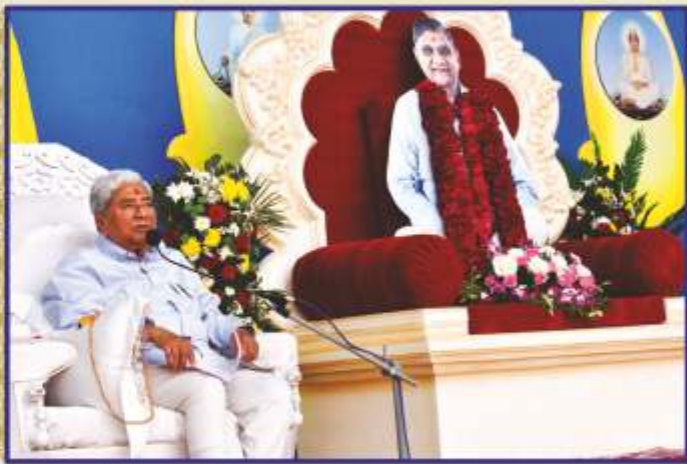
સદ્ગુરુ સાધુ પૂ. શાંતિદાદા શાશ્વત સ્મૃતિદિને સભામાં સાહેબજીનાં આશીર્દાન

સંતભગવંત સાહેબજીની આજ્ઞા અને પ્રેરણાથી ‘પ્રજ્ઞાનતીર્થ - સર્વાંગી શિક્ષણ સંસ્થાન’ ખાતે ૨૮ જાન્યુઆરી ૨૦૨૪ના રોજ સદ્ગુરુ સાધુ પૂ. શાંતિદાદાની પુણ્ય સ્મૃતિ સાથે ‘શાંતિ યુવા મહોત્સવ’ યોજાયો. આ ઉત્સવમાં યુવાનો અને યુવતીઓ માટે રમત-ગમતના વિશેષ કાર્યક્રમોનું આયોજન કરાયું. ભારતનાં વિવિધ સત્સંગકેન્દ્રોમાંથી યુવાનો-યુવતીઓ પધાર્યાં ને આ મહોત્સવમાં ઉત્સાહભરે ભાગ લઈ, સૌએ ખૂબ આનંદ કરી સ્મૃતિઓ એકત્ર કરી. મહોત્સવના આરંભે સવારે સદ્ગુરુ સાધુ પૂ. રતિકાકાના સાંનિધ્યે ઉદ્ઘાટન સભા યોજાઈ. પૂ. શાંતિદાદાના જીવનપ્રસંગોની સ્મૃતિ કરી તેઓ પ્રસન્ન થાય તે મુજબ ખેલદિલીની ભાવના સાથે રમતગમતમાં જોડાવાની પ્રેરણા સૌએ મેળવી. ત્યારબાદ અલગ અલગ વિભાગોમાં બહેનો અને ભાઈઓએ રમતગમતનો આનંદ માણ્યો. આ યુવા મહોત્સવ દ્વારા સૌ યુવાઓએ સંપ, સુહૃદભાવ અને એકતાના પાઠ પાકા કરાવવાની ભાવના દઢ કરી. સંતભગવંત સાહેબજી, સદ્ગુરુ સંતો, વ્રતધારી સંતો, વડીલ ભક્તોએ આ મહોત્સવમાં અને વિશેષ કરીને રમતગમતના