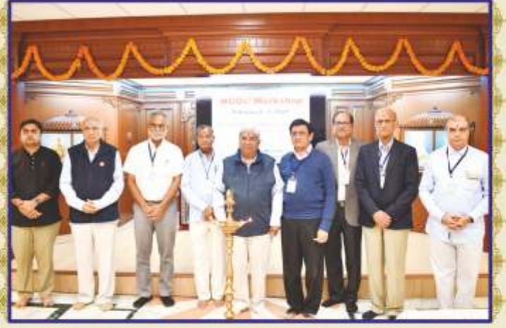
સ્વૈચ્છિક સંસ્થાઓના વર્કશોપનો દીપપ્રાગટ્ય દ્વારા શુભારંભ

શિક્ષણ, આરોગ્ય તેમજ સામાજિક ઉત્થાન માટે અમૂલ્ય સેવાઓ આપી રહેલ ગુજરાતની વિવિધ સેવાકીય સંસ્થાઓના પ્રતિનિધિઓએ આ દ્વિદિવસીય વર્કશોપમાં ભાગ લીધો. ભાગ લેનાર સૌ સંસ્થાઓના પ્રતિનિધિઓએ પોતપોતાની સંસ્થાની સેવાકીય પ્રવૃત્તિ અંગે રજૂઆત કરી અને વિવિધ સેવાકીયક્ષેત્રે થઈ શકનાર બહુમૂલ્ય પ્રદાન અંગે ચર્ચા-વિચારણા કરી. એકંદરે રાજ્યની બધી જ સ્વૈચ્છિક સંસ્થાઓનું સ્તર ઊંચું આવે, હાલની પરિસ્થિતિ અને તેના અનુસંધાને ભાવિકામગીરીઓ અંગેનાં દિશાસૂચનો મળે તેવો આ મીટિંગનો ઉદ્દેશ્ય રહ્યો. સેવાકાર્યમાં મદદ મેળવવા યોગ્ય રજૂઆત, સેવા કરવાની યોગ્ય પદ્ધતિ, દાતાની અપેક્ષા સંતોષાય તે પ્રકારનું સેવાકાર્ય કરવાનું માર્ગદર્શન વિશેષજ્ઞો દ્વારા આ વર્કશોપમાં અપાયું.