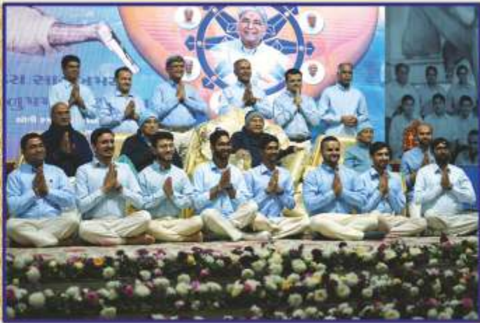
શ્રી યોગી સ્મૃતિદિન કીર્તન આરાધનામાં અનુપમ સૂરવંદના સંતો-સેવકોને આશીર્વાદ

૨૫ જાન્યુઆરી, પોષીપૂર્ણિમાના મહામંગલકારી ઉત્સવને સૌએ તપોભૂમિ બ્રહ્મજ્યોતિ, મોગરી ખાતે અનેરા ભક્તિભાવે ઊજવ્યો.