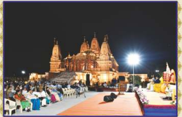
અયોધ્યામાં નવનિર્મિત ભગવાન શ્રી રામમંદિર મૂર્તિ પ્રાણપ્રતિષ્ઠા મહોત્સવનાં તપોભૂમિ બ્રહ્મજ્યોતિ, મોગરીમાં આનંદપૂર્ણ વધામણાં