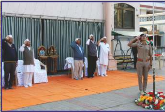
उपासना धाम, अमदावाद