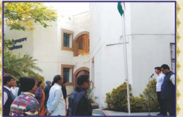
યોગીજી મહારાજ મહાવિદ્યાલય, ધારી