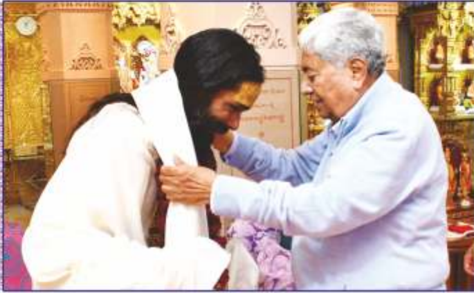
અયોધ્યા સ્થિત હનુમાન ગઢીના મહંત પ.પૂ. કલ્યાણદાસજીનાં બ્રહ્મજ્યોતિમાં સ્વાગત