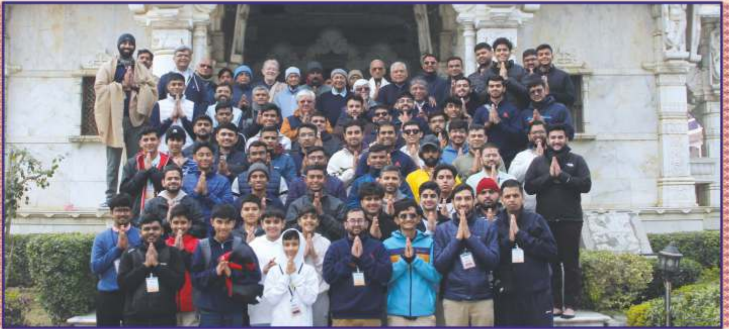
International youth (Yuvako) offering devotion at Shri Chhapaiya Dham- Shri Ghanshyam Maharaj Pragatya Tirth