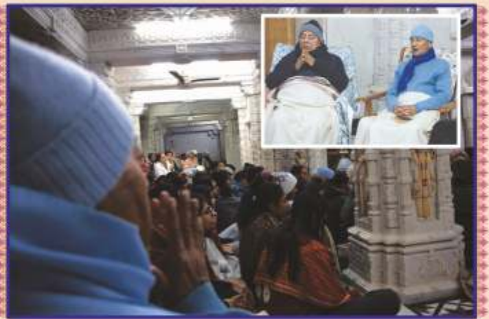
Offering Dhun-Prarthana at Shri Ghanshyam pragatya sthan