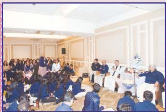
Sahebji showering blessings and satisfying curiosity of youth

Every chat, every smile, and every prayer turned into a celebration of our unity, transcending the physical and touching the very core of our souls. In the sacred precincts