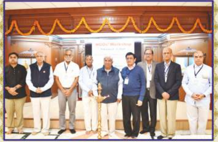
સ્વૈચ્છિક સંસ્થાઓના વર્કશોપનો દીપપ્રાગટ્ય દ્વારા શુભારંભ

શિક્ષણ, આરોગ્ય તેમજ સામાજિક ઉત્થાન માટે અમૂલ્ય સેવાઓ આપી રહેલ ગુજરાતની વિવિધ સેવાકીય સંસ્થાઓના પ્રતિનિધિઓએ આ દ્વિદિવસીય વર્કશોપમાં ભાગ લીધો. ભાગ લેનાર સૌ સંસ્થાઓના પ્રતિનિધિઓએ પોતપોતાની સંસ્થાની સેવાકીય પ્રવૃત્તિ અંગે રજૂઆત કરી અને વિવિધ સેવાકીયક્ષેત્રે થઈ શકનાર બહુમૂલ્ય પ્રદાન અંગે ચર્ચા-વિચારણા કરી. એકંદરે રાજ્યની બધી જ સ્વૈચ્છિક સંસ્થાઓનું સ્તર ઊંચું આવે, હાલની પરિસ્થિતિ અને તેના અનુસંધાને ભાવિકામગીરીઓ અંગેનાં દિશાસૂચનો મળે તેવો આ મીટિંગનો ઉદ્દેશ્ય રહ્યો. સેવાકાર્યમાં મદદ મેળવવા યોગ્ય રજૂઆત, સેવા કરવાની યોગ્ય પદ્ધતિ, દાતાની અપેક્ષા સંતોષાય તે પ્રકારનું સેવાકાર્ય કરવાનું માર્ગદર્શન વિશેષજ્ઞો દ્વારા આ વર્કશોપમાં અપાયું.