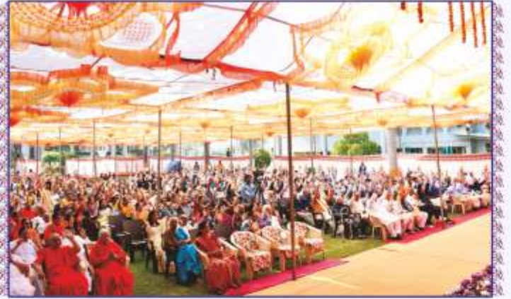
પોષીપૂર્ણિમા માહાત્મ્યદર્શન સભા મંચદર્શન તથા પધારેલ દિવ્ય સંતો અને અણરમુક્તો