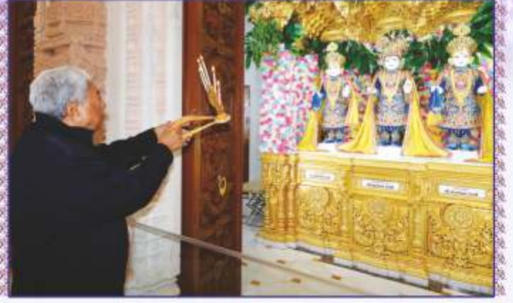
પોષીપૂર્ણિમાના પાવન પર્વે તપોભૂમિ બ્રહ્મજ્યોતિ, મોગરી સ્થિત મંદિરજીની મૂર્તિઓનાં ચતુર્થ પાટોત્સવ પૂજન અને આરતી અર્પણ