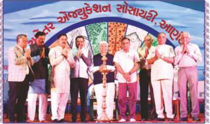
ચરોતર એજ્યુકેશન સોસાયટીના વાર્ષિકોત્સવનો દીપપ્રાગટ્ય દ્વારા શુભારંભ