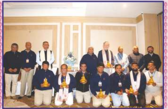
Honouring seva of santo and youth leaders of India for organizing retreat