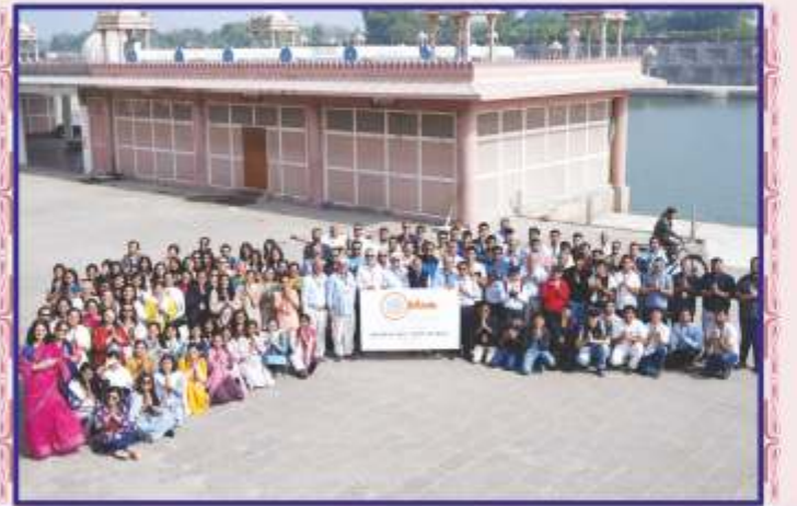
ગઢડા તીર્થનાં દર્શને શિબિરાર્થીઓ