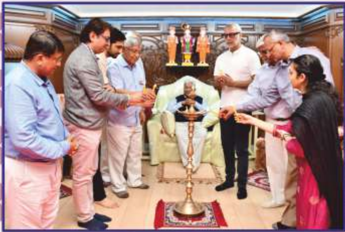
બ્રહ્મજ્યોતિ, મોગરી પર ઈન્ટરનેશનલ યૂથ રિટ્રીટના શુભારંભે દીપપ્રાગટ્ય