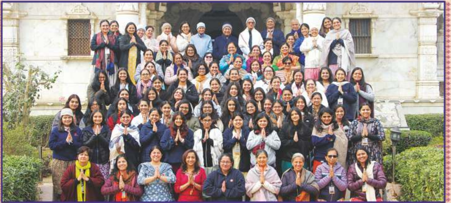
International youth (Yuvati) offering devotion at Shri Chhapaiya Dham- Shri Ghanshyam Maharaj Pragatya Tirth

During the Saurashtra yatra , we visited Sarangpur , where the samadhi sthan of Shastriji Maharaj and Pramukh Swami Maharaj are erected. We learned how Pramukh Swami Maharaj had chosen the location of his samadhi sthan in such a way that it couldn't be built higher than Shastriji Maharaj , so that his sight would be always on Swaminarayan Bhagwan and Shastriji Maharaj's sight would be on