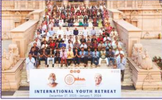
તપોભૂમિ બ્રહ્મજ્યોતિ પર પધારેલા ઈન્ટરનેશનલ યૂથ રિટ્રીટના શિબિરાર્થીઓ