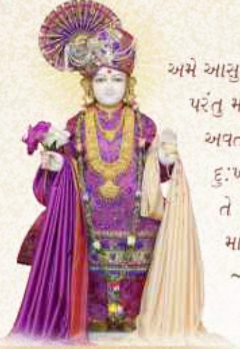
પરબ્રહ્મ પુરુષોત્તમ શ્રી સદ્ગાનંદસ્વામી (સ્વામિનારાયણ ભગવાન)

અમે આસુરી જનોના સંહાર માટે અવતાર ધારણ નથી કર્યો, પરંતુ માનવમાં રહેલા આસુરી ભાવનાના ઉન્મૂલન માટે અવતાર ધારણ કર્યો છે. માનવને માત્ર ગરીબી અને દુઃખોમાંથી ક્ષણિક મુક્તિ અપાવવા માટે નહિ, પરંતુ તે સર્વના કારણરૂપ જન્મ-મરણના ચક્રાવામાંથી માનવને મુક્ત કરવા અવતાર ધર્યો છે. ~ ભગવાન શ્રી સ્વામિનારાયણ