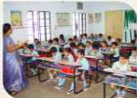
પ્રાથમિક અને માધ્યમિક શાળા