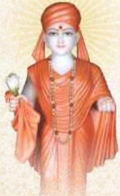
મહામુક્ત શ્રી મોપાળાનંદસ્વામી (ભગવાનના આદર્શ ભક્તરાજ)

ગુણાતીતાનંદસ્વામીના સંબંધ અને સમાગમથી બ્રાહ્મીસ્થિતિને પામેલા ભગતજી મહારાજ દ્વારા આ પૃથ્વી પર પ્રત્યક્ષ અને પ્રગટની ઉપાસના જીવંત રહી, તેઓની કૃપાથી શાસ્ત્રીજીમહારાજ તેવી બ્રહ્મરૂપની સ્થિતિને પામ્યા અને અક્ષરપુરુષોત્તમની શુદ્ધ-યુગલ ઉપાસનાનું પ્રવર્તન કર્યું.