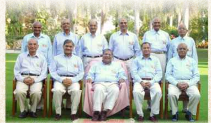
અનુપમ મિશનના સ્થાપક ગુરુવર્ષ પ.પૂ. સાહેબ સાથે સહભાગી સાથીઓ

ગુરુવર્ષ પ.પૂ. સાહેબ ભગવાન સ્વામિનારાયણને સાંગોપાંગ ધારનારી અક્ષરપુરુષોત્તમ પરંપરાના ગુણાતીત સંત છે અને ગુરુદેવ યોગીજીમહારાજના આર્પસર્જન નૂતન સાધના માર્ગ અને 'અનુપમ મિશન'ના પ્રણેતા છે.