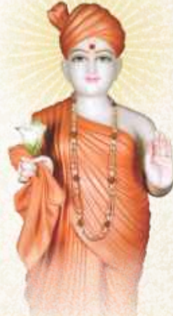
શક્ષરબ્રહ્મ શ્રી ગુણાતીતાનંદસ્વામી (ભગવાનને સહેવાનું ધામ)

આવા ગુણાતીત સત્પુરુષ સાથે આત્મબુદ્ધિ ને પ્રીતિ યવાથી જ અક્ષરધામરૂપ ધવાપ છે, પુરુષોત્તમની સેવાનો અધિકાર મળે છે અને મહામુક્તની સ્થિતિ પમાય છે.