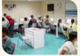
કોમ્પ્યુટર તાલીમ કેન્દ્ર