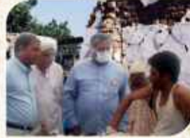
ભૂકંપ સહત પ્રવૃત્તિ