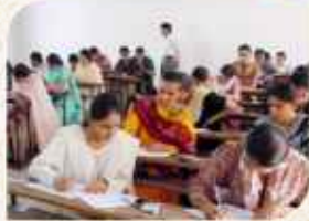
મહિલાઓ માટે આર્ટ્સ, કોમર્સ અને B.C.A. કોલેજ