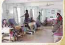
પ્રાકૃતિક ઉપચાર કેન્દ્ર