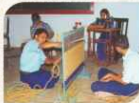
માનસિક પડકારવાળાં બાળકો માટે રોજગારલક્ષી તાલીમ