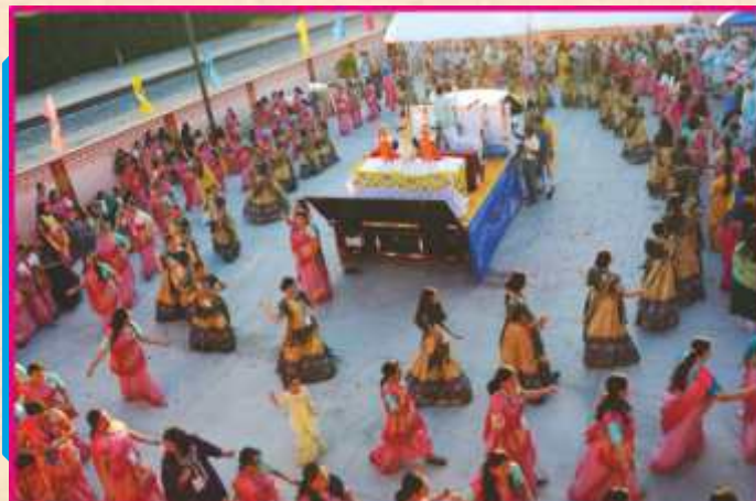
નિજ મંદિર પરિસરમાં પ્રભુ પધાર્યાની નૃત્યભક્તિ દ્વારા ઉમંગસભર વધામણી