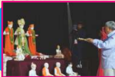
સંતભગવંત સાહેબજી અને સંતો દ્વારા આરતી અર્પણ