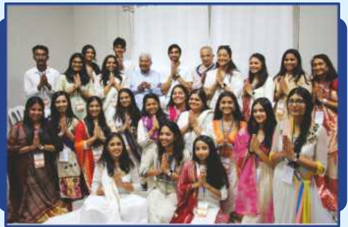
Core team of youth Sevaks with Guruhari Sahebji