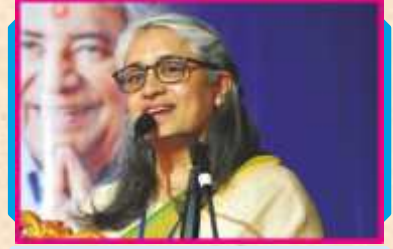
ભાવિશાબહેન ટેલર (યુ.કે.)

સમગ્ર મહોત્સવના સમાપન કરતાં સંતભગવંત સાહેબજીએ અત્યંત પ્રસન્નતા સાથે શુભ આશીર્વાદ વરસાવતાં કહ્યું કે, 'આ સમૈયામાં તો આખો વૈશ્વિક અનુપમ પરિવાર ભેગો થયો છે તેથી મંદિર મહોત્સવ ખૂબ અદ્ભુત રીતે ઉજવાયો છે, ખૂબ આનંદ આવ્યો છે. કારણ કે, આ સમૈયામાં સૌ સંતો, ભક્તો ભેગા મળી પ્રભુની ભક્તિમાં તરબોળ થયા છે. ગુરુ દેવ યોગીબાપાએ અમને લખેલા એક પત્રમાં લખ્યું હતું કે, ઠેરઠેર ભ્રમ્મવિદ્યાની કૉલેજ ચાલુ થશે, તેમાં પહેલો નંબર વિદ્યાનગરનો પછી મુંબઈ