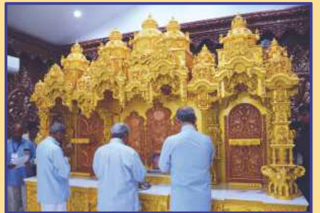
લોસ એન્જલસ મંદિરજીના ગર્ભગૃહમાં મૂર્તિઓની પીઠિકાનાં પૂજન