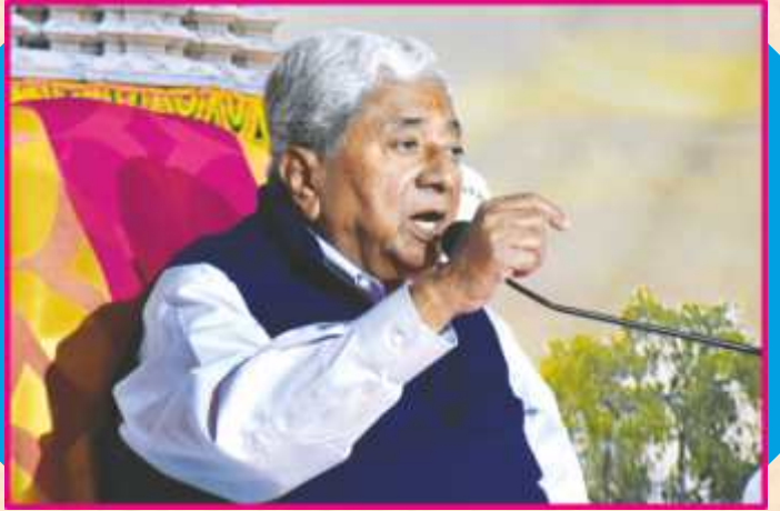
ગુરુપૂર્ણિમાએ ગુરુવર્ય પ.પૂ. સાહેબદાદાનો કૃપાપ્રસાદ