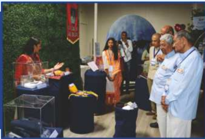
Guided exhibition tour by youths