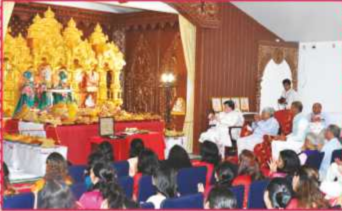
શ્રી ઠાકોરજીને ભક્તિભાવે અન્નકૂટ અર્ધ્ય અર્પણ