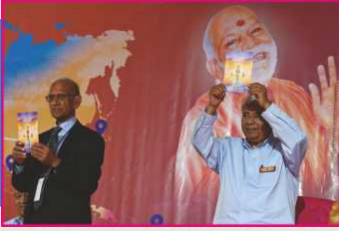
‘અનુપમની સ્વર સૂરાવલિ-ગુજલિશ’ કીર્તન ગ્રંથનાં મુક્તાર્પણ

અને પછી ગામોગામ બ્રહ્મવિદ્યાની કોલેજ ચાલુ થશે. આજે લોસ એન્જલસમાં આપણા નવા મંદિરમાં શ્રી ઠાકોરજી બિરાજમાન થયા છે એટલે અહીં પણ બ્રહ્મવિદ્યાની કોલેજ ચાલુ થઈ છે. એ બ્રહ્મવિદ્યાનો પાયાનો અને પહેલો સિદ્ધાંત એ છે કે, ભગવાનના પ્રત્યેક ભક્ત એ આપણા માથાના મુગટ સમાન છે. અને નિર્દોષબુદ્ધિ જાળવી, સુહૃદભાવે અને સ્વધર્મેયુક્ત તેઓની સેવા કરીએ તો ભગવાન રાજી થાય. ભગવાન રાજી થાય તો અહંકાર રહિત થવાય. અને અહંકાર રહિત થઈએ તો જીવનમાં ભગવાનનું સુખ અને આનંદ સહજ પ્રગટે. આ સમૈયામાં જેઓ જેઓ આવ્યા છે અથવા તો ડિજિટલ માધ્યમથી ભાગ લીધો છે, સમૈયામાં નાની-મોટી સેવાઓ કરી છે તેવાં સૌ દીકરાઓ અને દીકરીઓને પ્રભુ સર્વ વાતે સુખી કરી રૂડો બુદ્ધિયોગ આપે અને સૌ તન-મન-ધન અને પ્રભુના સુખે આત્માથી સુખી થાય તેવી પ્રભુચરણો-ગુરુચરણો પ્રાર્થના કરીએ છીએ.’