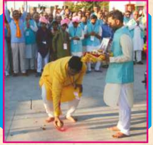
નિજ મંદિર પરિસર પ્રવેશે શ્રી ઠાકોરજીનાં પૂજન અને શ્રીકૃષ્ણ વઘેરી વધામણાં

બહેનો, અક્ષરમુક્તોએ ભક્તિસભર કીર્તનોના તાલે શ્રી ઠાકોરજી મહારાજની મૂર્તિઓની ફરતે ગરબા કરી આનંદ અને ઉમંગથી આ શુભ પ્રસંગને ચિરસ્મરણીય કર્યો.