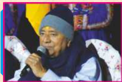
પ.પૂ. સાહેબજીના પ્રસન્નતાપૂર્ણ આશીર્વાદ

શાસ્ત્રીય નૃત્ય શૈલીઓ ભારતનાટ્યમ, કથક ઉપરાંત ભારતીય પરંપરાગત લોકનૃત્યો તથા સૂફી શૈલીની નૃત્ય પરંપરાઓના અદ્ભુત સર્જનાત્મક સમન્વયથી