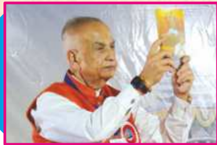
‘સાધુહૃદયની પ્રાર્થનાગંગા’ ગ્રંથનાં મુક્તાર્પણ

છે તે પૂ. શાંતિદાદાના સંકલ્પનું સુફળ છે. આવી પ્રતાપી મૂર્તિઓ આ મંદિરમાં બિરાજમાન થશે પછી ભવિષ્યમાં અત્યારે છે તેથી પણ મોટું મંદિર થશે ! તે દરમિયાન આપણે સૌ આજથી નિયમિત અડધો કલાક ‘સ્વામિનારાયણ’ મહામંત્રની ધૂન કરીએ, અઠવાડિક સત્સંગસભામાં નિયમિત હાજરી આપીએ તથા પરિવારમાં, સત્સંગમાં તથા સમાજમાં સંપ, સુહૃદભાવ ને એકતા જાળવી, તે વધુ દૃઢ થાય તે રીતે કાર્ય કરીએ. આ મંદિરનાં દર્શન કરતાં ખૂબ આનંદ થાય છે. સૌનાં સંપ, સુહૃદભાવ ને એકતાથી તૈયાર થયેલા આ પ્રભુના મંદિરમાં ભગવાન બિરાજશે તે સૌને તન-મન-ધન ને આત્માથી સુખી કરશે.’ ❀