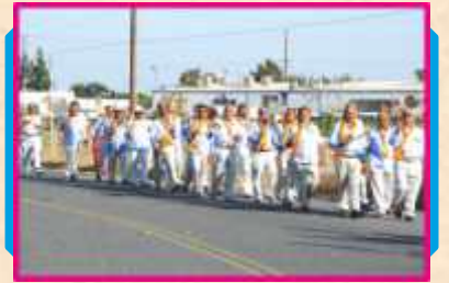
શોભાયાત્રામાં વ્રતધારી સંતો