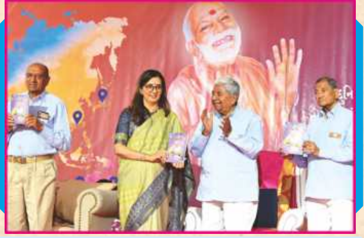
‘સ્પિરિચ્યુઅલ એવેન્સ-૦’નાં મુક્તાર્પણ

અને પછી ગામોગામ બ્રહ્મવિદ્યાની કોલેજ ચાલુ થશે. આજે લોસ એન્જલસમાં આપણા નવા મંદિરમાં શ્રી ઠાકોરજી બિરાજમાન થયા છે એટલે અહીં પણ બ્રહ્મવિદ્યાની કોલેજ ચાલુ થઈ છે. એ બ્રહ્મવિદ્યાનો પાયાનો અને પહેલો સિદ્ધાંત એ છે કે, ભગવાનના પ્રત્યેક ભક્ત એ આપણા માથાના મુગટ સમાન છે. અને નિર્દોષબુદ્ધિ જાળવી, સુહૃદભાવે અને સ્વધર્મેયુક્ત તેઓની સેવા કરીએ તો ભગવાન રાજી થાય. ભગવાન રાજી થાય તો અહંકાર રહિત થવાય. અને અહંકાર રહિત થઈએ તો જીવનમાં ભગવાનનું સુખ અને આનંદ સહજ પ્રગટે. આ સમૈયામાં જેઓ જેઓ આવ્યા છે અથવા તો ડિજિટલ માધ્યમથી ભાગ લીધો છે, સમૈયામાં નાની-મોટી સેવાઓ કરી છે તેવાં સૌ દીકરાઓ અને દીકરીઓને પ્રભુ સર્વ વાતે સુખી કરી રૂડો બુદ્ધિયોગ આપે અને સૌ તન-મન-ધન અને પ્રભુના સુખે આત્માથી સુખી થાય તેવી પ્રભુચરણો-ગુરુચરણો પ્રાર્થના કરીએ છીએ.’