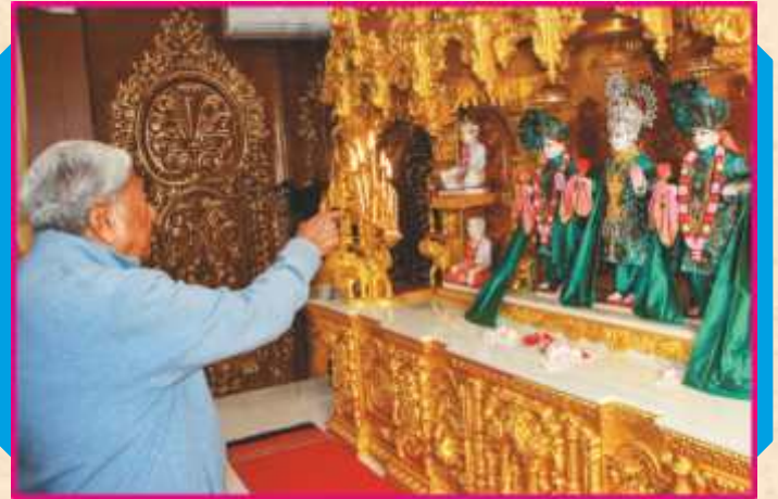
નોરવોક-લોસ એન્જલસના નૂતન મંદિરજીમાં શ્રી ઠાકોરજીનાં પ્રથમ પૂજન તથા પ્રથમ આરતી અર્પણ