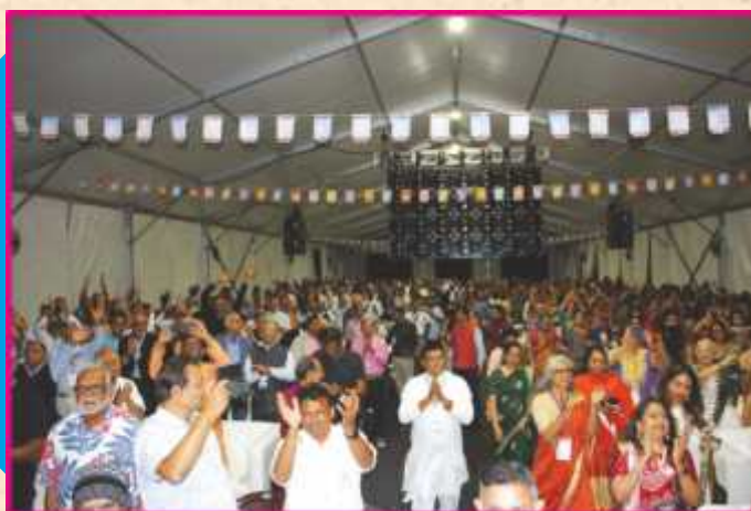
સાંસ્કૃતિક કાર્યક્રમને ધન્યભાવે વધાવી લેતા ઉપસ્થિત સૌ સંતો-અક્ષરમુક્તો