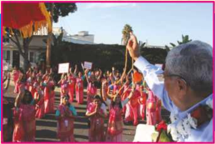
શોભાયાત્રામાં ભક્તોના ભાવ ઝીલતા સંતભગવંત સાહેબજી

યજ્ઞશાળાથી નિજમંદિરમાં પ્રવેશ દરમિયાનની શ્રી ઠાકોરજી મહારાજની આ શોભાયાત્રા બહુવિધ અર્પણ સાથે પ્રત્યેક અક્ષરમુક્તોને હૃદયમાં શાશ્વતકાળ પર્યંત જીવંત સ્મૃતિરૂપે સ્થાન પામી. ❀