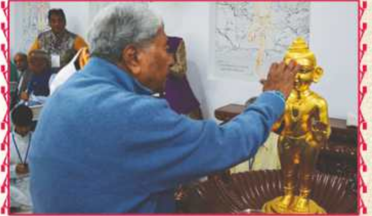
શ્રી હરિકૃષ્ણ મહારાજની અભિષેક મૂર્તિનાં પૂજન