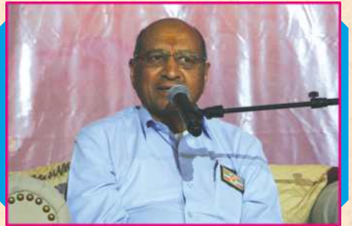
પૂ. દિનકરઅંકલના આશીર્વાદ