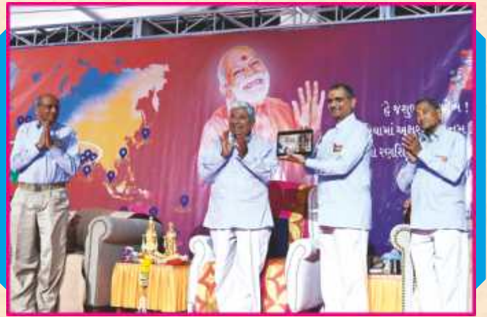
‘ભક્તિદર્શન’ વિડિયો આલ્બમનાં મુક્તાર્પણ