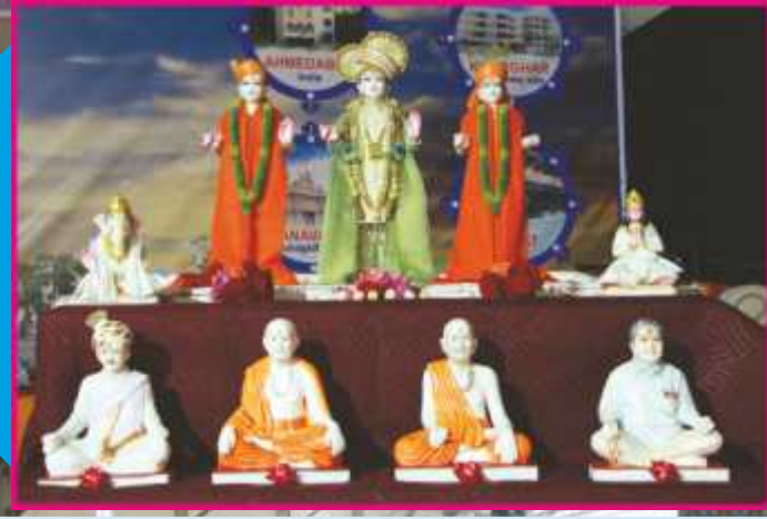
નૂતન મંદિરજીમાં બિરાજમાન થનાર મૂર્તિઓની સંનિધિમાં મહાયજ્ઞ