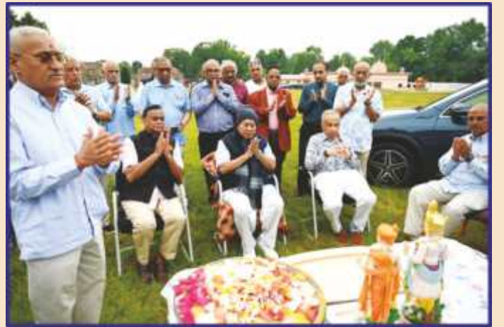
પ.પૂ. મહંત સ્વામી મહારાજે મોકલાવેલ પ્રસાદીપુષ્પની વૃષ્ટિ પૂર્વે પ્રાર્થના