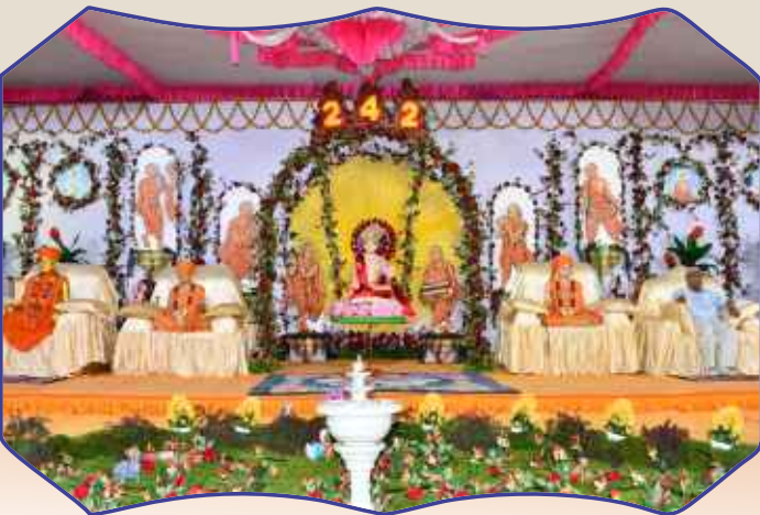
તપોભૂમિ બ્રહ્મજ્યોતિ-મોગરી પર શ્રીહરિ જયંતી પર્વની ઉજવણીના ઉમંગ