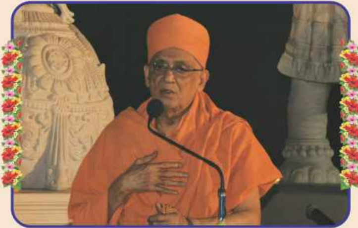
आशीर्दान : स्वामीश्री पूज्य प्रेमस्वर्ण दासज