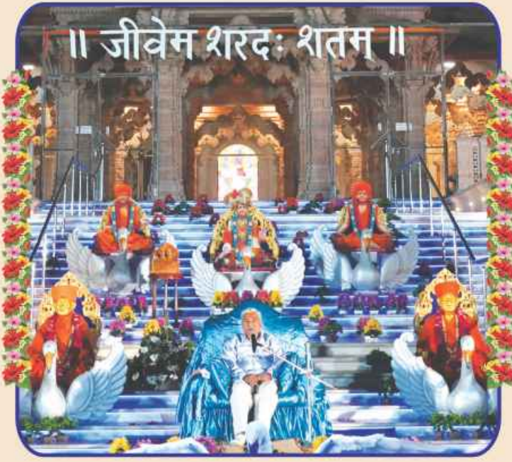
संतभगवंत साहेबजना दिव्य आशीर्वादनी वर्षा