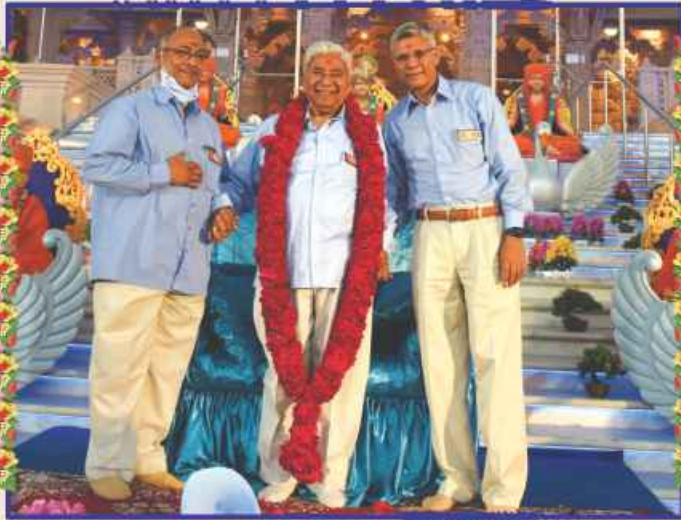
અનુપમ મિશનના સંતો-અક્ષરમુક્તો વતી સાહેબજીને ભાવવંદના અર્પણ