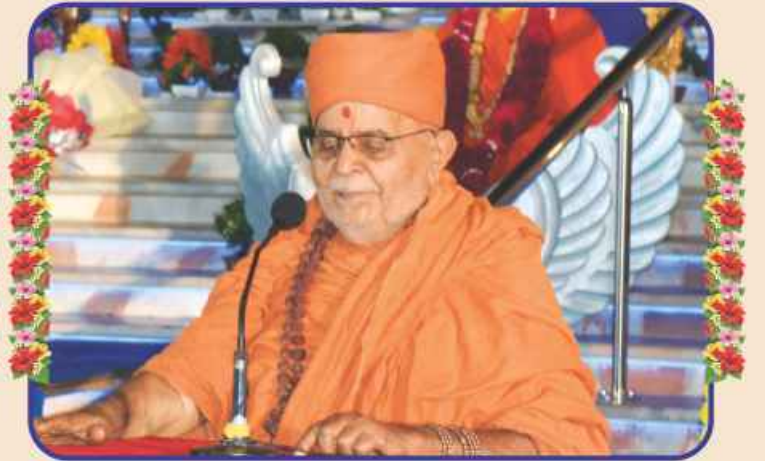
आशीर्दान : स्वामीश्री पूज्य निर्मलजवन दासज