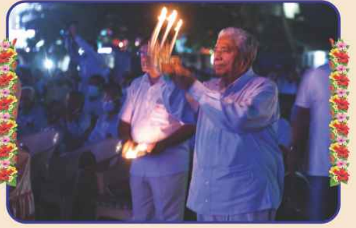
શ્રી ઠાકોરજી મહારાજને આરતી અર્પણ