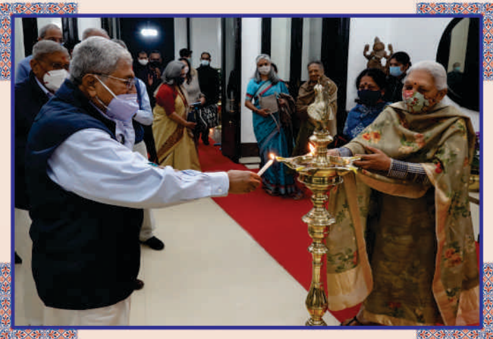
રાજભવનમાં દીપપ્રાગટ્ય સાથે પ્રાર્થના