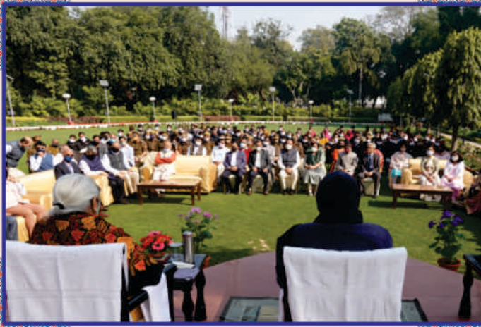
રાજભવનમાં કાર્યરત કર્મચારીઓની સભામાં સાહેબજીનાં આશીર્દાન