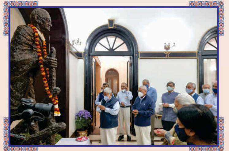
રાજભવનમાં રાષ્ટ્રપિતા ગાંધીજીની મૂર્તિ સમક્ષ મંત્રપુષ્પાંજલિ અર્પણ