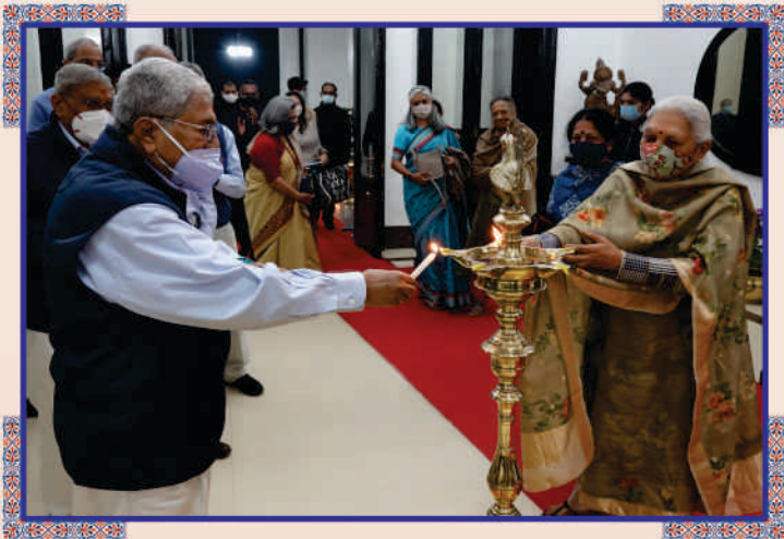
રાજભવનમાં દીપપ્રાગટ્ય સાથે પ્રાર્થના

શ્રીમતી આનંદીબહેને ઉત્તર પ્રદેશનાં રાજ્યપાલ તરીકે સુકાન સંભાળ્યું ત્યારથી સંતભગવંત સાહેબજીનો સંકલ્પ હતો કે, તેઓને છપૈયા-ભગવાન શ્રી સ્વામિનારાયણના પ્રાગટ્ય તીર્થભૂમિનાં દર્શન કરવા લઈ જવાં છે. કળશ મહોત્સવ દરમિયાન ‘શાલીન માનવરત્ન’ સન્માન સ્વીકાર્યા બાદ પોતાના ઉદ્બોધનમાં શ્રીમતી આનંદીબહેને સ્વયં સાહેબજી સાથે છપૈયા દર્શનાર્થે જવાની ભાવના વ્યક્ત કરી અને સંતભગવંત સાહેબજીને પોતાના લખનૌ સ્થિત રાજભવનમાં