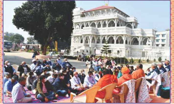
છપૈયા મંદિરના સંતો સાથે મિલનસભામાં સાહેબજીનાં આશીર્વાદ