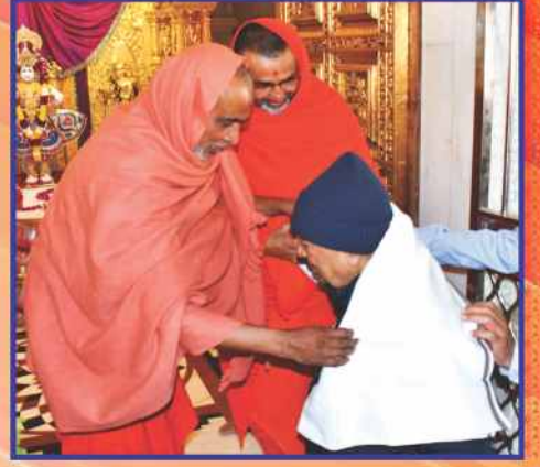
છપૈયા મહાતીર્થમાં સેવાસ્ત સંતોનાં અભિવાદન તેમજ મંદિરના સંતો દ્વારા સાહેબજીને વંદનભાવે શાલ અર્પણ