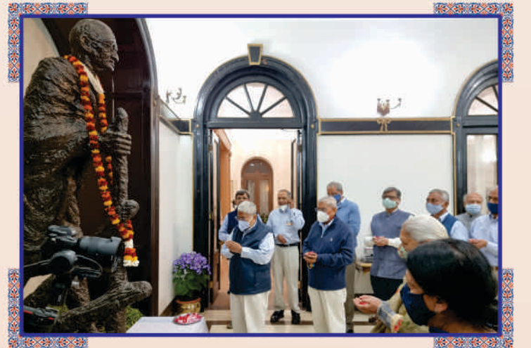
રાજભવનમાં રાષ્ટ્રપિતા ગાંધીજીની મૂર્તિ સમક્ષ મંત્રપુષ્પાંજલિ અર્પણ