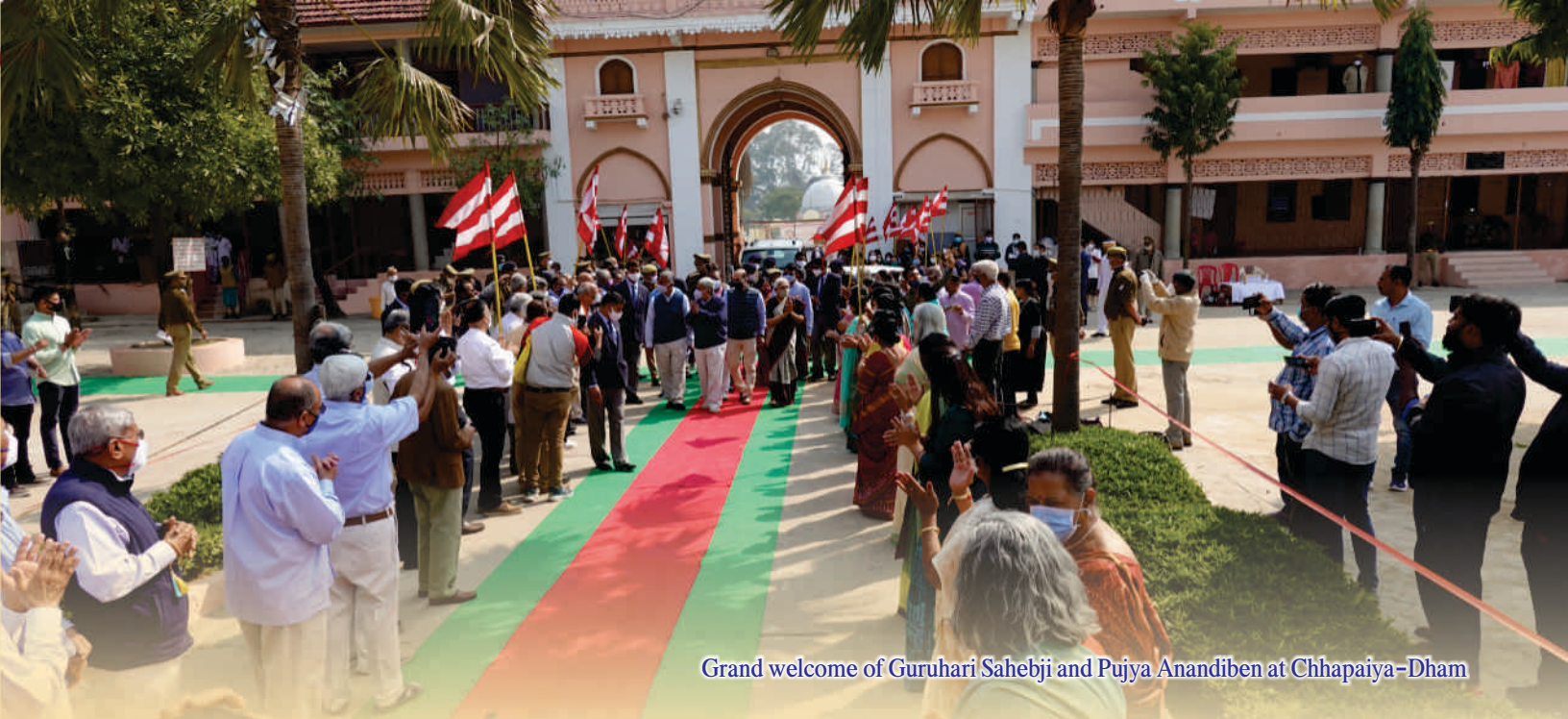
Grand welcome of Guruhari Sahebji and Pujya Anandiben at Chhapaiya-Dham