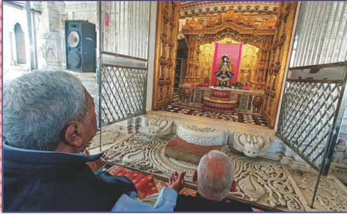
છપૈયા મંદિરે સર્વોપરી શ્રી ઘનશ્યામ મહારાજની મૂર્તિ સમક્ષ ધૂન-પ્રાર્થના