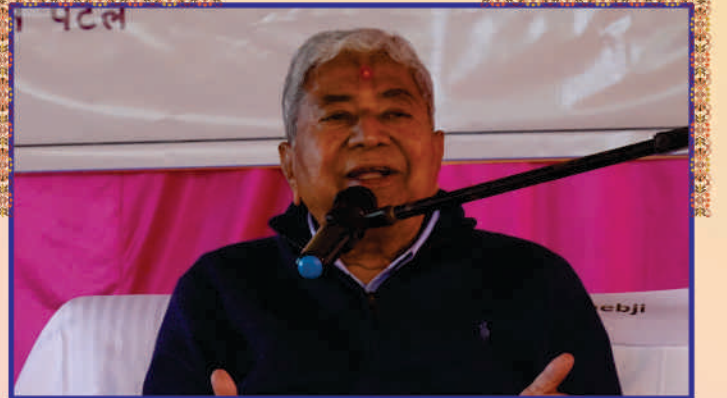
Guruhari Sahebji showering blessings