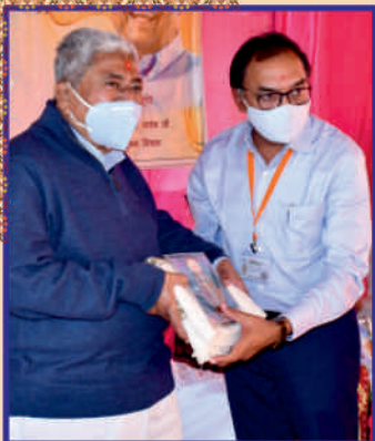
Offering of murti to Guruhari Sahebji by Chhapaiya Mandir