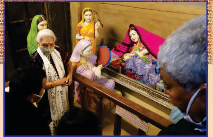
Darshan at Shri Ghanshyam Maharaj's Pragatyasthaan, Chhapaiya