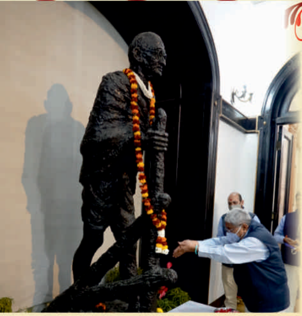
Arrival and Mantra Pushpanjali at entrance of Raj Bhavan