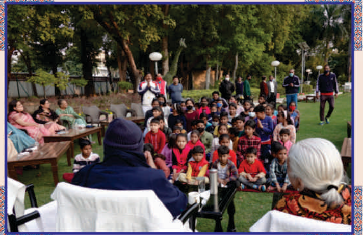
રાજભવનમાં કાર્યરત કર્મચારીઓનાં બાળકોને સાહેબજીનાં આશીર્દાન