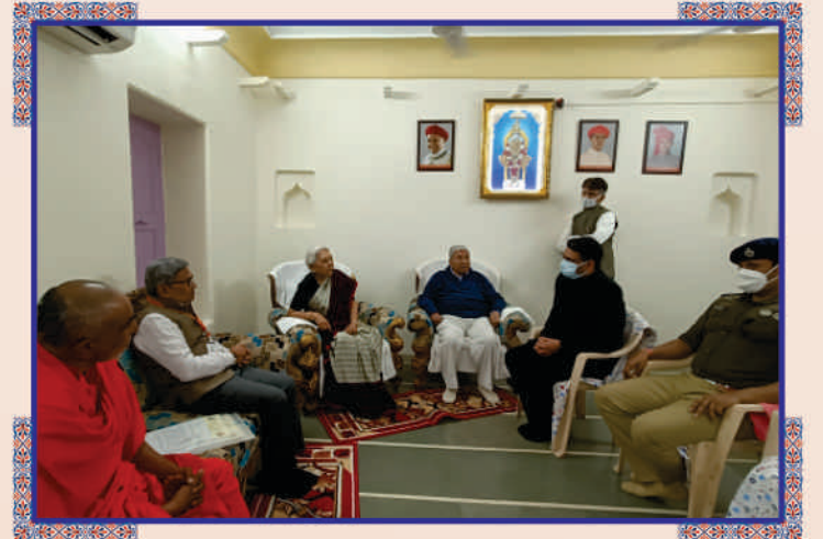
છપૈયા મંદિર અને પરિસરનાં વિકાસકાર્ય માટે રાજ્યપાલશ્રી સાથે વિમર્શ અને માર્ગદર્શન