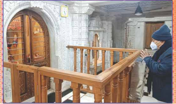
શ્રીહરિ પ્રાદુર્ભાવ સ્થાને પ્રાર્થનાવંદના