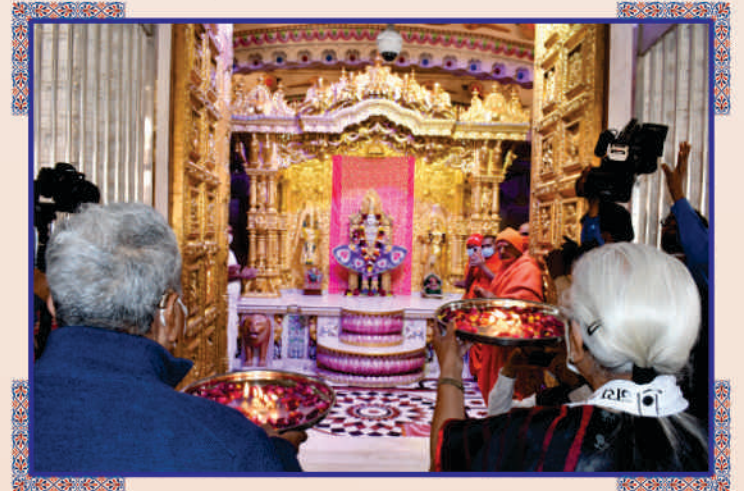
છપૈયા મંદિરના શ્રી ઘનશ્યામ મહારાજને ભક્તિભાવે આરતી અર્પણ