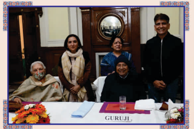
રાજભવનના પ્રસાદગૃહની સ્મૃતિછબિ