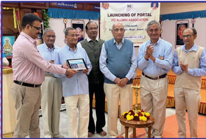
ઈન્ફોર્મેશન ટેકનોલોજી સેન્ટરના ઍલમનાઈ એસોસિએશન પોર્ટલનાં મુક્તાર્પણ

ગુણાતીત સમાજના સંસ્થાપક બ્રહ્મસ્વરૂપ પ.પૂ. કાકાજી મહારાજ ૭ માર્ચ ૧૯૮૬ના રોજ બ્રહ્મલીન થયા. ૭ માર્ચ ૨૦૨૨ના રોજ તેઓના નિર્વાણ સ્મૃતિદિને પારમિતા સભાખંડમાં મંગળા આરતી બાદ મંગલવંદના અર્પણ થઈ. સદ્ગુરુ સંતો પ.પૂ. શાંતિદાદા, પ.પૂ. રતિકાકા, પ.પૂ. હર્ષદદાદાની દિવ્ય ઉપસ્થિતિમાં પ.પૂ. કાકાજીની મૂર્તિને સાધુ પૂ. અશોકદાસજી દ્વારા પૂજન અને સાધુ પૂ. વાસુદેવદાસજી દ્વારા પુષ્પહાર અર્પણ કરવામાં આવ્યાં. સૌએ કાકાજીના મહિમાનાં કીર્તનોનું શ્રવણ કરી પ્રાર્થનાઓ ધરી. અંતે કાકાજી મહારાજ જેમ ધૂન કરાવતા તેની સ્મૃતિ સાથે સૌએ ધૂન કરી મૂર્તિ સમક્ષ મંત્રપુષ્પાંજલિ ધરી અને નૂતન મંદિરે આરતી અર્પણ કરી. કાકાજીના શાશ્વત આશિષસમ બ્રહ્મસમાધિ સ્થાને યુવાનો દ્વારા સુંદર સુશોભન કરવામાં આવ્યું હતું, ત્યાં સ્તુતિ-ધૂન-પ્રદક્ષિણાભક્તિ અર્પણ કરી સૌએ કાકાજીને અંતરની વંદના ધરી. ◆