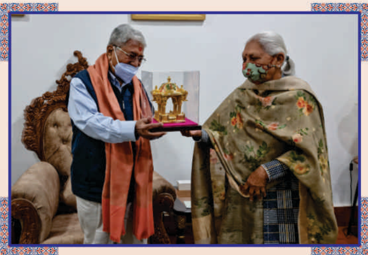
રાજભવનમાં સાહેબજીને સ્મૃતિભેટ અર્પણ

સાહેબજીના રાજભવનના નિવાસ દરમિયાન દરરોજ સવારે તેઓની પ્રાતઃ પૂજાનો લાભ સૌ સંતો-ભક્તો લેતા. શ્રીમતી આનંદીબહેન પણ પૂજામાં પધારતાં અને ભક્તિભાવે લાભ લેતાં.