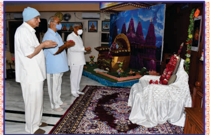
બ્રહ્મસ્વરૂપ કાકાજી મહારાજને વાર્ષિક પુણ્યતિથિ સ્મૃતિદિને મંત્રપુષ્પાંજલિ અર્પણ