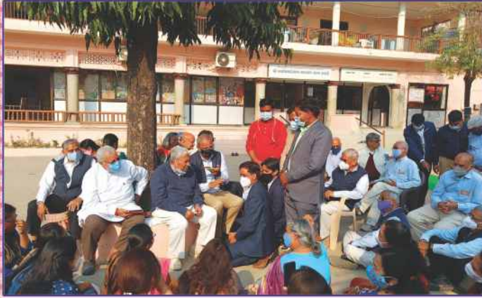
સાહેબજી દ્વારા ભક્તોને સત્સંગગોષ્ઠિ અને આશીર્વાદનું સુખ