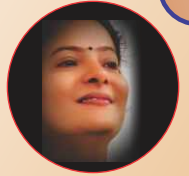
દીર બારોટ ભરૂચ

નવનિર્મિત મંદિરની મહાઆરતી કરવાનો અદ્ભુત અવસર આવ્યો. આખા મંદિર પરિસરમાં સંતભગવંત સાહેબજી મહારાજ, સદ્ગુરુ સંતો, સંતો અને હરિભક્તો દ્વારા અદ્ભુત અને દિવ્ય મહાઆરતી થઈ. સાંજની આ મહાઆરતી તો જાણે મુક્તાનંદ સ્વામી રચિત 'જય સદ્ગુરુ સ્વામી...' આ શબ્દોએ જાણે દેહ ધારણ કર્યો હોય એમ અગણિત નર-નારીઓ સાથે સ્વયં પ્રગટ ગુરુહરિ સાહેબદાદાએ બિરાજીને આ સમગ્ર મંદિરમાં આરતી કરી અને સાહેબદાદાની ઉપસ્થિતિમાં સિદ્ધિ સુગમ થઈ ગઈ હોય એવું લાગતું હતું.