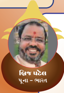
વિજ્ઞ પટેલ પૂના - ભારત

દિવ્ય, ભવ્ય, અલૌકિક, અભૂતપૂર્વ, ઐતિહાસિક અને સર્વોપરી કળશ મહોત્સવ ! કળશની ઉમંગસભર શોભાયાત્રા, મહાયજ્ઞનો અલૌકિક અને પવિત્ર માહોલ, ભજન રમઝટ, અક્ષરપુરુષોત્તમ ઉપાસનાની સર્વોપરી વાતો, સંતભગવંત સાહેબદાદાનાં દિવ્ય મહિમાગાન, સાહેબદાદાની સમાજસેવકોને બિરદાવવાની ઉદાત્ત ભાવના, નૂતન સંતોનાં સમર્પણની સુવાસ, ભવ્ય પૂર્ણાહુતિ સભા, અક્ષરધામતુલ્ય મંદિર પરિસર અને એમાં અદ્ભુત મહા આરતી ! આ બધાંની સાથે સંતભગવંત સાહેબદાદા અને સદ્ગુરુ સંતોનાં પ્રત્યક્ષ દર્શન અને સેવાનો સર્વોપરી લાભ મળ્યો MKM 2022 - જીવનભરની સ્મૃતિ અને સંભારણાં રૂપે !