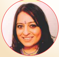
શયના અચિન પોપટ યુ.કે.

The Kalash Mahotsav 2022 was a truly special and divine celebration. The events were so well broadcasted that we felt completely connected and immersed in each ceremony that was taking place. It was so professionally executed and it is a lifetime memory captured for generations to come. Everyone worked with Samp, Suradhbav and Ekta with the ultimate goal of pleasing Shree Thakorji and Sant Bhagwant Sahebji! We are forever grateful to Sant Bhagwant Sahebji to have blessed us with the opportunity to have witnessed the process of the Mandir being built from its foundations to the crowning of the golden Kalash. These memories will always remain in our hearts.