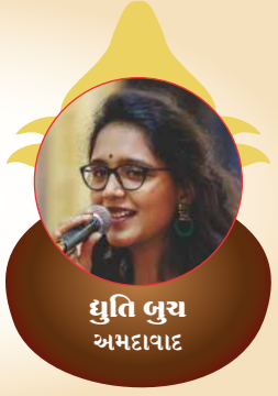
ધ્રુતિ બુવ અમદાવાદ

૧૪ જાન્યુઆરીના દિવસે-વિશિષ્ટ કીર્તન આરાધનાનું આયોજન થયું. 28 જેટલા ગાયક ભક્તોએ વિવિધ કીર્તનો ગાઈ માત્ર દોઢ કલાકના સમયમાં કીર્તન ભક્તિ અર્પણ કરી સંપ, સુહૃદ ભાવ અને એકતાનાં અદ્ભુત દર્શન કરાવી સાહેબદાદાની પ્રસન્નતા જીતી લીધી. આ કીર્તન આરાધનામાં અમારા પરિવારના એક સાથે ચાર સભ્યોને આ વિશિષ્ટ કીર્તન આરાધનામાં સેવામાં જોડાવાની તક મળી. આ અમારા માટે એક ચિરંજીવ સ્મૃતિ બની રહી.