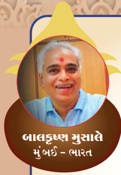
जालक्ष्ण मुसादे मुंबई - भारत

ये मेरा सौभाग्य था कि, ब्रह्मज्योति में नवनिर्मित स्वामिनारायण मंदिर के कलश महोत्सव के पुण्य अवसर पर मैं व्यक्तिगत रूप से उपस्थित रह सका। मैं भावविभोर हो गया। महोत्सव में आयोजित भजन संध्या ने मुझे बहुत प्रभावित किया। मैं समजता हूँ कि, कई वर्ष से आयोजित भजन संध्याओं में ये अति श्रेष्ठ भजन संध्या थी। महोत्सव में मुझे मंदिर के कलश का माहात्म्य, दर्शन और स्पर्शन का तथा गुरुवर्य परमपूज्य साहेबदादा और परम पूज्य अश्विनदादा की पवित्र वाणी से कलशजी की महिमा सुनने का अविस्मरणीय अवसर मिला। संतों के प्रवचन से मुझे मंदिर में भगवान की मूर्तियों की प्राण प्रतिष्ठा और कलश स्थापना का अद्भुत ज्ञान प्राप्त हुआ। इस अवसर पर समस्त विश्व में फैले गुरुवर्य के भक्तों के वर्तन में संप, सुहृद-भाव और एकता का साक्षात् दर्शन कर मैं भावविभोर हो गया। इस कलश महोत्सव में उपस्थित रहने से मैं स्वयं को परम धन्य एवं भाग्यवान मानता हूँ।