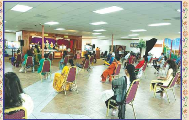
ફ્લોરિડા-યુ.એસ.એ. મંદિરમાં સાહેબજી પ્રાગટ્યોત્સવની ઉજવણી