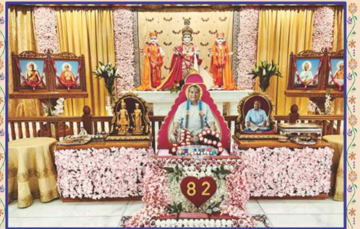
અનુપમ મિશન, યુ.કે. ખાતે સાહેબજી પ્રાગટ્યપર્વનાં ભક્તિભર્યા સુશોભન