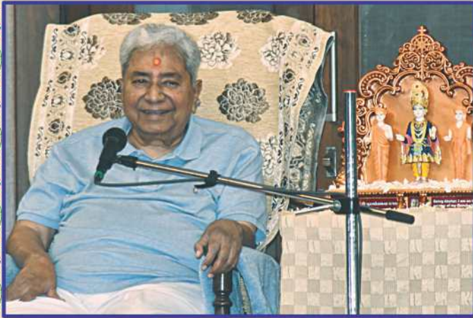
હોલિકા પર્વ-બ્રહ્મસ્વરૂપ ભગતજી મહારાજ પ્રાગટ્યમંગલે સાહેબજીનાં આશીર્દાન

આ ઉપરાંત, સમાહના પ્રત્યેક ગુરુવારે ઈન્ટરનેશનલ યુવકોની ગુરુસભા અને શુક્રવારે ઈન્ટરનેશનલ યુવતીઓની સભાઓ યોજાઈ, તેમાં પણ ઊછરતી પેઢીએ સંતભગવંત સાહેબજીના પ્રાગટ્યમંગલ અવસરે અનુપમ મહિમાદર્શન કરાવ્યાં. ◆