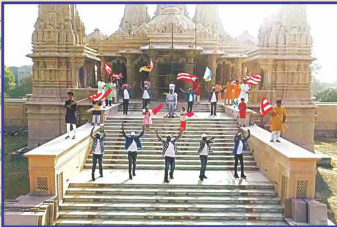
યુવાનોની ગુરુસભામાં પ્રસ્તુત 'ચાલો... સાહેબ પ્રગટાવીએ' કાર્યક્રમની ઝલક