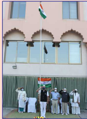
ઉપાસના ધામ અમદાવાદમાં ધ્વજવંદન

હાઈસ્કૂલના, ભીમાણી પ્રાથમિક શાળાના કર્મચારીઓ આદિ હાજર રહ્યા. વી.પી.જી. ગર્લ્સ હાઈસ્કૂલની વિદ્યાર્થિનીઓની બાસ્કેટબૉલ ટીમે ચોથી રાષ્ટ્રીય સ્પર્ધામાં સિલ્વર મેડલ મેળવ્યા તે સૌને સન્માનિત કરાયાં. કોરોના વાયરસની મહામારીના સમયમાં સેવા આપનાર વૉરિયર્સનું સન્માન કરવામાં આવ્યું. સમગ્ર કાર્યક્રમ કોરોના નિર્દેશિકા અનુસાર પૂર્ણ કાળજી સાથે ઊજવવામાં આવ્યો. ◆