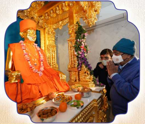
બ્રહ્મસ્વરૂપ પરમ પૂજ્ય શાસ્ત્રીજી મહારાજ, શ્રી ધામ-ધામી-મુક્ત, બ્રહ્મસ્વરૂપ પરમ પૂજ્ય યોગીજી મહારાજને સંતભગવંત સાહેબજી દ્વારા વંદન-પ્રાર્થનાઅર્ધ અર્પણ