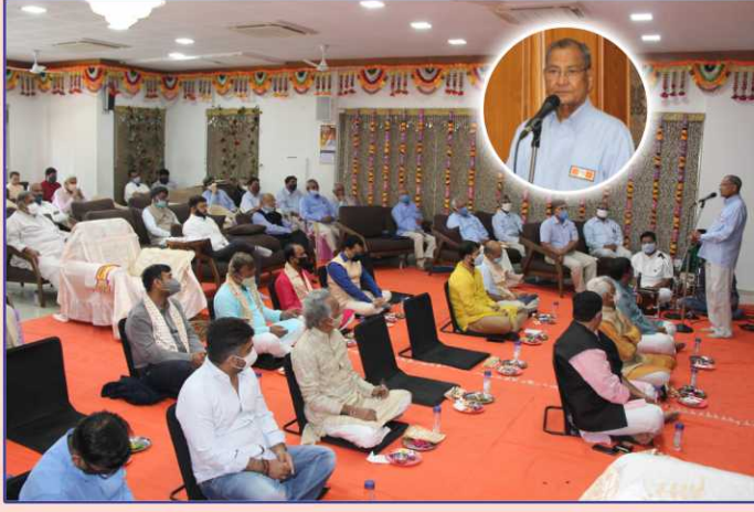
ઉપાસના ધામ, અમદાવાદમાં ચતુર્થ પાટોત્સવ પ્રસંગે પૂ. અશ્વિનદાદાના આશીર્વાન

૧ ફેબ્રુઆરીના રોજ સદ્ગુરુ સંત પૂ. અશ્વિનદાદાના સાંનિધ્યમાં ચતુર્થ પાટોત્સવ ધામધૂમથી ઊજવવામાં આવ્યો. આ પર્વે તપોભૂમિ બ્રહ્મજ્યોતિ, મોગરીથી સાધુ પૂ. વાસુદાસ, સાધુ પૂ. રમેશદાસ દયાળુ, સાધુ પૂ. ઘનશ્યામદાસ, સાધુ પૂ. ભરતદાસ, સાધુ પૂ. હરસુખદાસ, સાધુ પૂ. પીટરદાસ, સાધુ પૂ. ચંદુદાસ આદિ સંતો ખાસ પધાર્યા અને પાટોત્સવ પૂજનવિધિમાં સંમિલિત થયા.