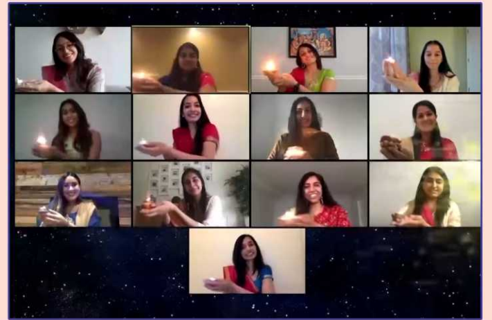
ઈન્ટરનેશનલ યુવતી મંડળ દ્વારા પ્રસ્તુત સાંસ્કૃતિક કાર્યક્રમનું એક દશ્ય

કાર્યક્રમની વિશેષતા એ રહી કે, દરેકને પરફોર્મન્સ માટે ૩૦-૪૦ સેકન્ડથી પણ ઓછો સમય મળતો હોવા છતાં સૌને સહભાગી થવાનો ખૂબ આનંદ આવ્યો. યુવાન દીકરીઓએ આધ્યાત્મિકતાની ઊંચાઈ સાથે