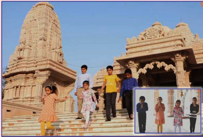
આંતરરાષ્ટ્રીય બાળસભાનાં તારલાઓ દ્વારા પ્રસ્તુત સાંસ્કૃતિક કાર્યક્રમનું દશ્ય