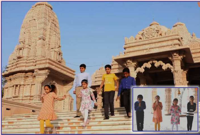
આંતરરાષ્ટ્રીય બાળસભાનાં તારલાઓ દ્વારા પ્રસ્તુત સાંસ્કૃતિક કાર્યક્રમનું દશ્ય

કાર્યક્રમની વિશેષતા એ રહી કે, દરેકને પરફોર્મન્સ માટે ૩૦-૪૦ સેકન્ડથી પણ ઓછો સમય મળતો હોવા છતાં સૌને સહભાગી થવાનો ખૂબ આનંદ આવ્યો. યુવાન દીકરીઓએ આધ્યાત્મિકતાની ઊંચાઈ સાથે