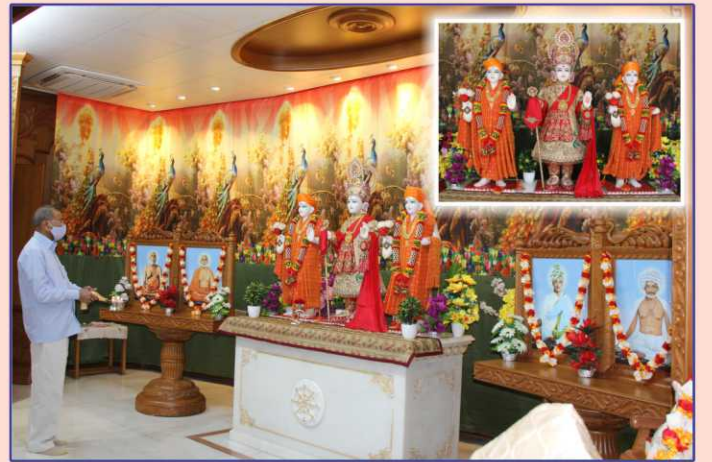
ઉપાસના ધામ, અમદાવાદમાં ચતુર્થ પાટોત્સવ પ્રસંગે પૂ. અશ્વિનદાદા દ્વારા આરતી અર્પણ