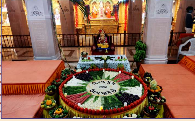
તપોભૂમિ બ્રહ્મજ્યોતિ, મોગરીમાં 'બ્રહ્મમહોલ'માં દેવડી ડેવડી અગિયારસના શુભ દિને સદ્ગુરુ સંતોના સાંનિધ્યે શાકોત્સવની ઉજવણી અને આરતી અર્પણ