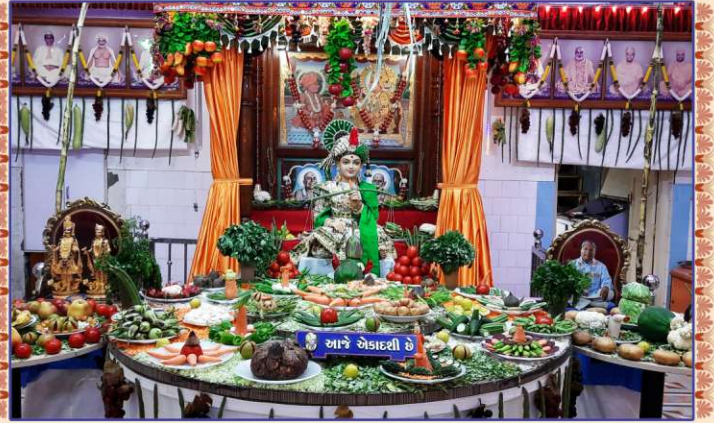
અક્ષરદેરી, માણાવદરમાં શાકોત્સવની ભક્તિભાવે ઉજવણી