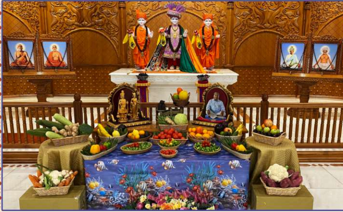
અનુપમ મિશન, ડેન્લમ-યુ.કે. મંદિરમાં શાકોત્સવભક્તિ અર્પણ