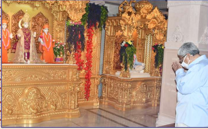
તપોભૂમિ બ્રહ્મજ્યોતિ પર 'બ્રહ્મમહોલ'માં બિરાજમાન શ્રી ઠાકોરજીનાં દર્શન... વંદન