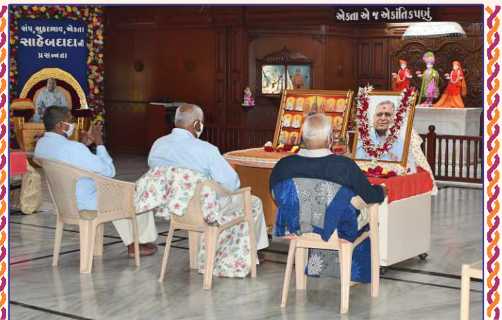
અનુપમ મિશનના અક્ષરનિવાસી સંતોની પારમિતા સભાખંડમાં યોજિત ત્રયોદશી મહાપૂજામાં હૃદયવંદના