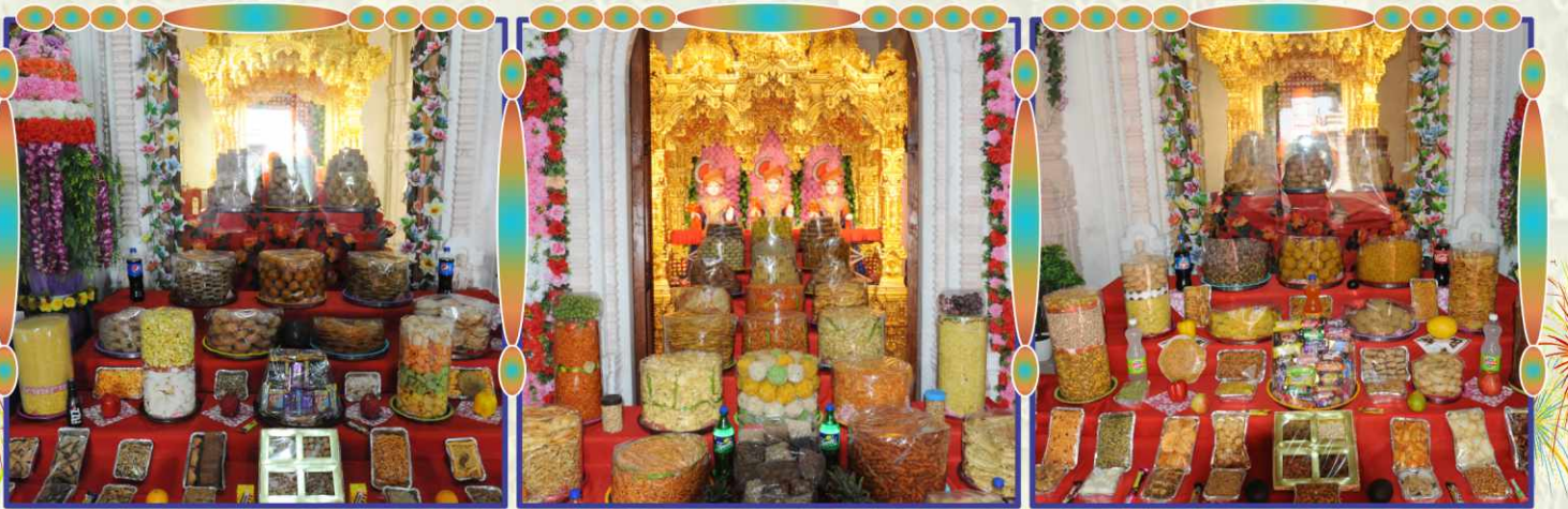
નૂતનવર્ષે શ્રી ધામ-ધામી-મુક્ત, શ્રી શાસ્ત્રીજી મહારાજ અને શ્રી યોગીજી મહારાજને ભક્તિભાવે પ્રથમ અત્રકૂટ અર્પણ

આ વર્ષે અત્રકૂટ ઉત્સવમાં દેશ-વિદેશનાં તમામ કેન્દ્રોના સંતો-ભક્તો ઓનલાઈન માધ્યમથી જોડાયા અને અત્રકૂટ ધરાવ્યા. અનુપમ મિશન-ભારતનાં પ્રત્યેક મંદિરો, અમેરિકા અને યુ.કે.નાં મંદિરોમાં સંતો અને સ્થાનિક ભક્તોએ ભેગા મળી સુંદર વાનગીઓ તૈયાર કરી પ્રભુને અર્પણ કરી. દેશ અને પરદેશના સૌ ભક્તોએ પણ પોતપોતાનાં ઘરમંદિરોમાં જાતે જ ઘરે અનેક વાનગીઓ બનાવી અત્રકૂટ અર્પણ કર્યા ને ભક્તિના અનુપમ ભાવ ધર્યા. ◆