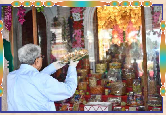
અન્નકૂટ ઉત્સવ પ્રસંગે સાહેબજી દ્વારા આરતી અર્પણ