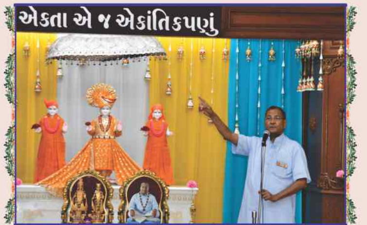
ગુરુસભાના યુવાનો દ્વારા સદ્ગુરુ સંત પૂજ્ય રતિકાકાના ટરમા પ્રાગટ્યપર્વે વહેલી પ્રસન્નતાપૂર્ણ આશિષવર્ષા