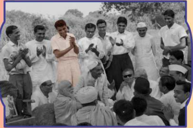
योगीबापानी आसाथी 'साहेब'ना नेतृत्वे 'श्री अक्षरपुरपोत्तम छात्रावय' निर्माणुनी सेवामां पू. रतिकाका