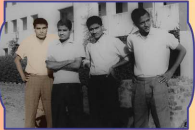
युवावस्थां वल्लभविद्यानगरमां जशुभाई साहेब संग्गाथे सभाओनी दिव्य स्मृति