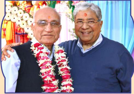
સાહેબજીના દૃઢ આશરે સદ્ગુરુ પ.પૂ. રતિકાકા