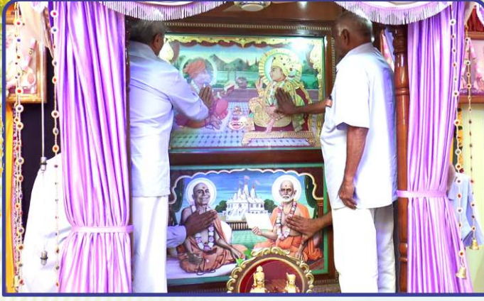
માણાવદર સ્થિત પ્રાસાદિક અક્ષરદેરીમાં શ્રી ઠાકોરજીનાં પાટોત્સવ પૂજન તથા મંત્રપુષ્પાંજલિ અર્પણ