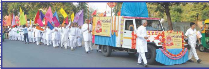
મંદિર મહોત્સવની આહ્વાલેક જગાવતી ભક્તિરેલી