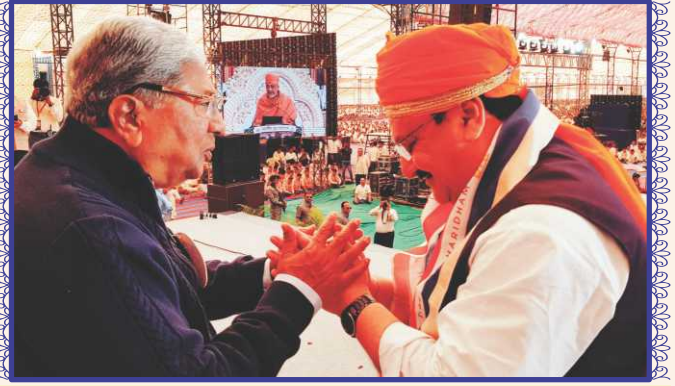
આત્મીય યુવા મહોત્સવમાં શ્રી જે.પી. નડા સાથે મુલાકાત