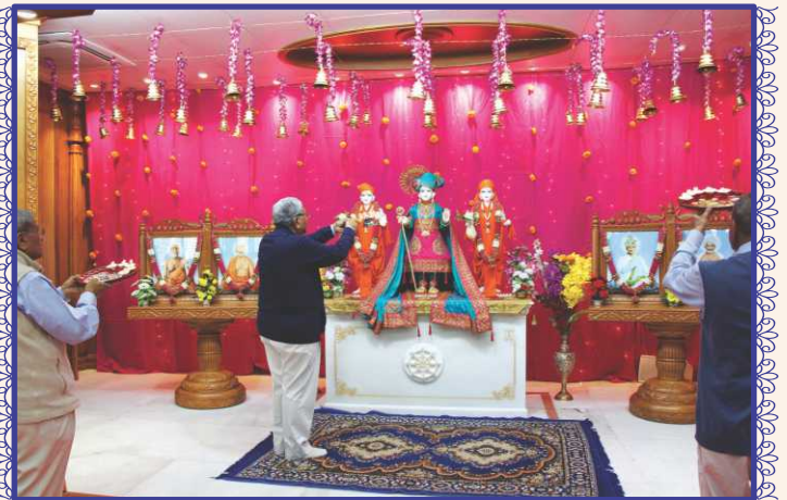
ઉપાસનાધામ, અમદાવાદના તૃતીય પાટોત્સવ પ્રસંગે આરતી અર્પણ