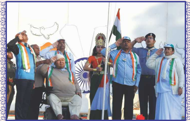
શારદામંદિર, નડિયાદમાં ગણતંત્રદિને રાષ્ટ્રધ્વજને સલામી અર્પણ