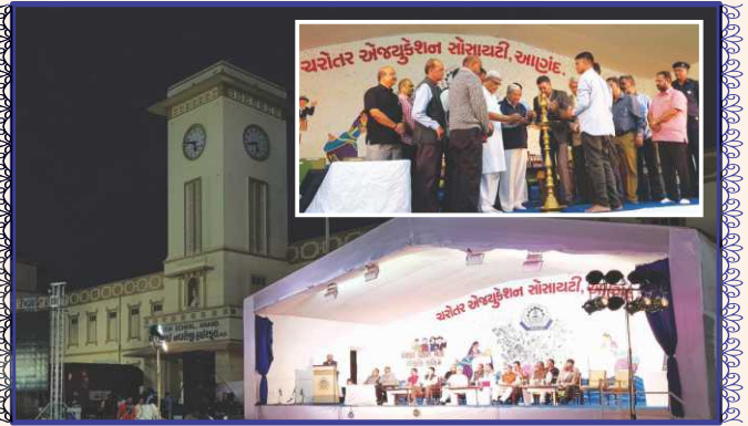
ચરોતર એજ્યુકેશન સોસાયટી દ્વારા યોજિત એલ્યુમની કાર્યક્રમમાં આશીર્વાદ