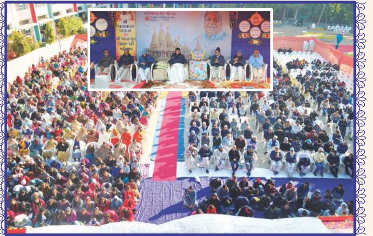
શ્રી વડતાલધામમાં યોજાત માહાત્મ્યસભામાં સાહેબજીનાં આશીર્વાદ