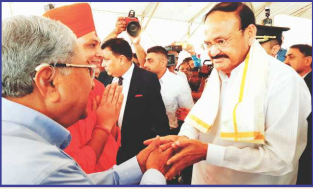
ચારુતર વિદ્યામંડળ અમૃતપર્વ કાર્યક્રમમાં ઉપરાષ્ટ્રપતિ શ્રી વૈક્યા નાયડુ સાથે મુલાકાત