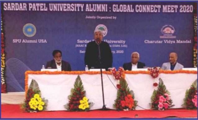
સરદાર પટેલ યુનિવર્સિટીના સ્વૉબલ કનેક્ટ મીટ-૨૦૨૦ના કાર્યક્રમમાં આશીર્વાદ