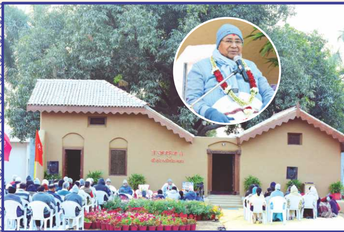
યોગીબાપાના નિર્વાણ સ્મૃતિદિને હૃદયાંજલિ અર્પણ