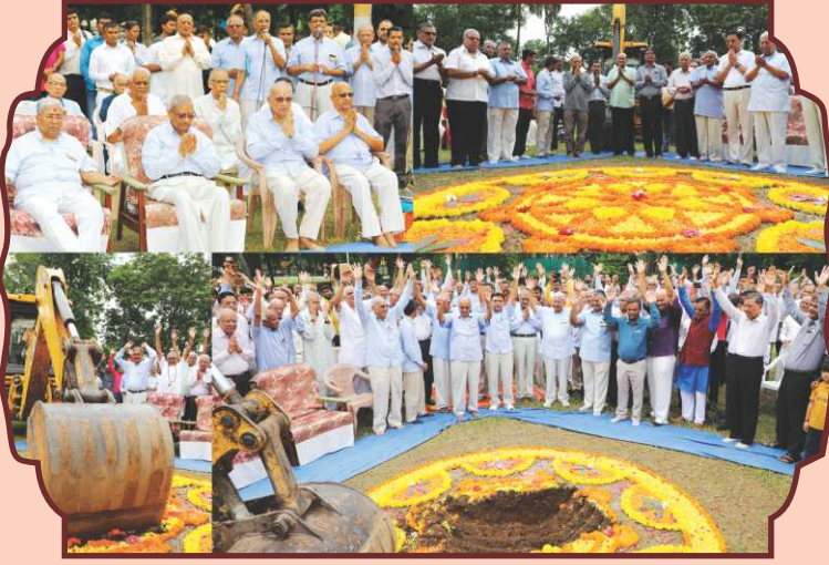
નૂતન મંદિર બાંધકામ શુભારંભ વિધિ