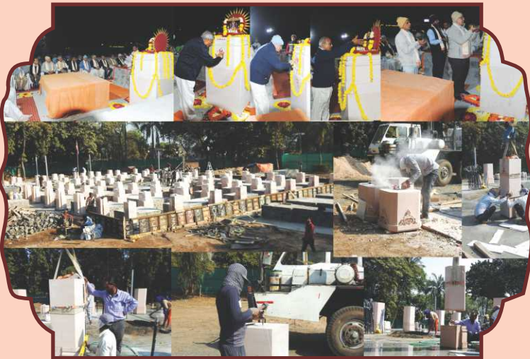
નૂતન મંદિરમાં પ્રથમ સ્તંભ સ્થાપન વિધિ... ૧૫ ડિસેમ્બર ૨૦૧૮

આ મંદિર ભગવાન શ્રી સ્વામિનારાયણથી લઈને પ્રગટ ગુણાતીત સ્વરૂપોનાં જીવન અને કાર્યને પ્રસારાવશે, શ્રી અક્ષરપુરુષોત્તમ ઉપાસનાનો ગોકીરો કરશે!