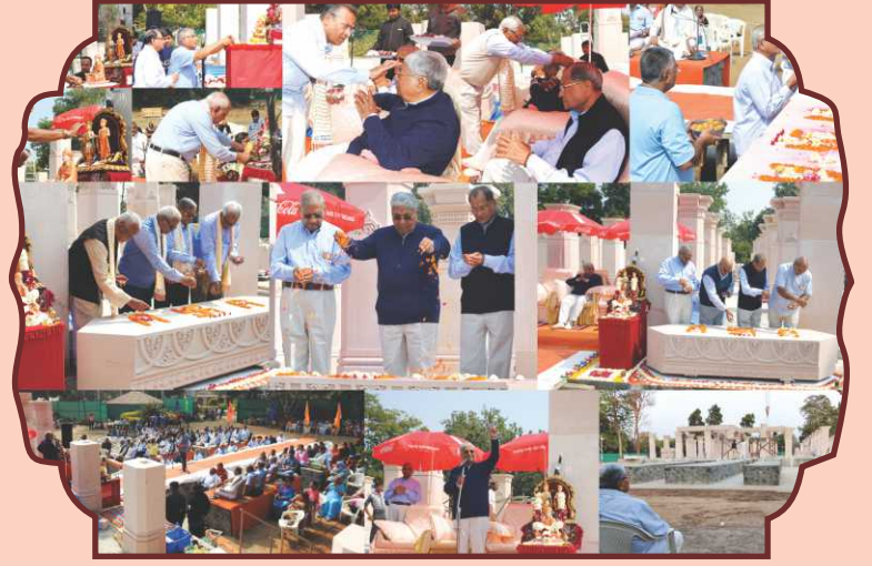
નૂતન મંદિરમાં પ્રથમ આધારદંડ સ્થાપન વિધિ... ૩ ફેબ્રુઆરી, ૨૦૧૯