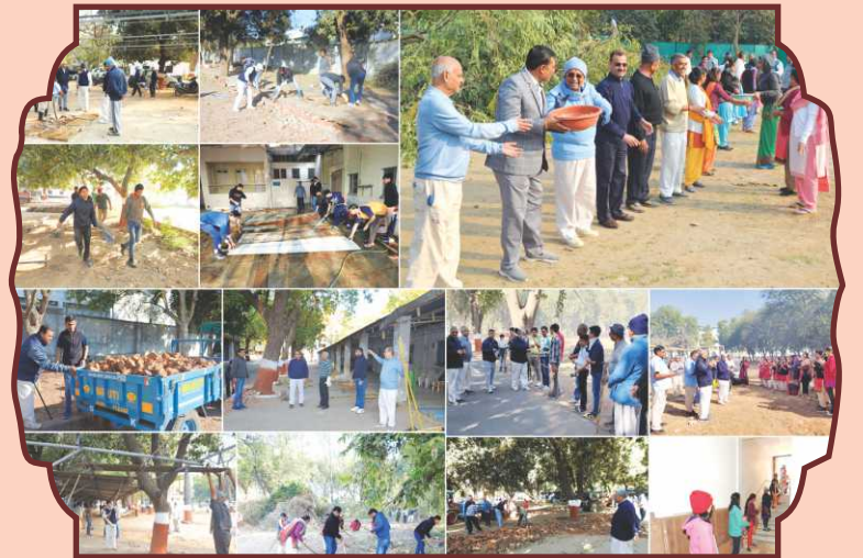
નૂતન મંદિર નિર્માણમાં સૌ સંતો સાથે વિવિધ મંડળોના સૌ ભક્તોએ શ્રમયજ્ઞમાં જોડાઈ ભક્તિ અદા કરી