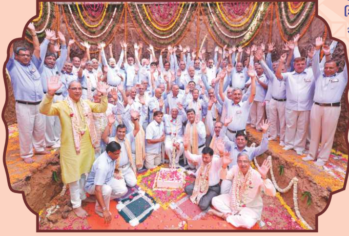
નૂતન મંદિર શિલાન્યાસ મહાવિધિ