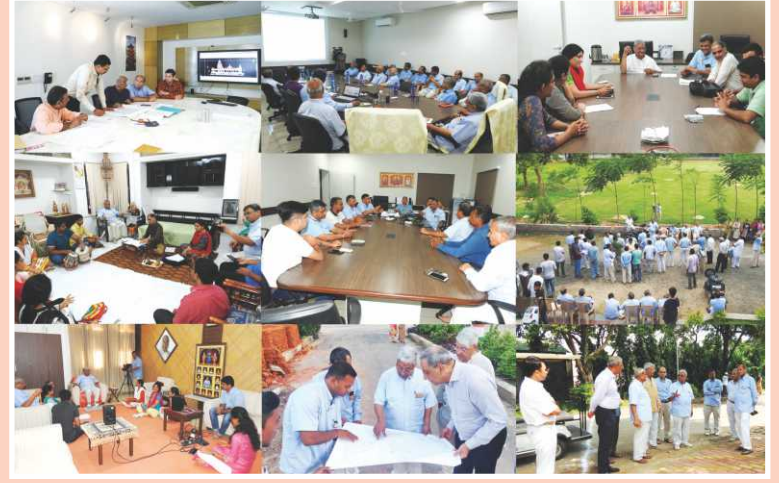
નૂતન મંદિર નિર્માણ તથા મૂર્તિપ્રતિષ્ઠા મહોત્સવનાં આયોજન અંગેની વિવિધ મીટિંગોમાં સંતભગવંત સાહેબદાદા અને સંતોનાં માર્ગદર્શન

વેમારમાં ઉજવાયેલ ભવ્યાતિભવ્ય સંતભગવંત સાહેબજી અમૃતોત્સવના થોડા જ મહિનાઓ બાદ ૨૪ નવેમ્બર ૨૦૧૬ના રોજ આર્કિટેક્ટ-કોન્ટ્રાક્ટર્સ સાથે મંદિર નિર્માણ માટે પ્રથમ મીટિંગ થઈ. વર્ષો પૂર્વે બ્રહ્મજ્યોતિમાં જ્યાં મંદિર કરવાનું નક્કી થયું હતું તે જ સ્થાને નૂતન મંદિર કરવાનું નક્કી થયું. ૨૯ માર્ચ ૨૦૧૭ના રોજ ભૂમિપૂજન થયું અને ૧ એપ્રિલ ૨૦૧૭, અ.નિ. પૂ. ડૉ. વી. એસ. પટેલસાહેબના પ્રાગટ્યદિને ભવ્ય નૂતન મંદિર શિલાન્યાસ મહાપૂજન વિધિ સંપન્ન થઈ. આ પ્રસંગે અનુપમ મિશનના સંતો અને શ્રી ગુણાતીત જ્યોતનાં સંત બહેનોનાં સુભગ સાંનિધ્યે દેશ-પરદેશના અગ્રણી અક્ષરમુક્તોના યજમાનપદે ભવ્ય ખાતવિધિ સંપન્ન થયો. ખૂબ ઊંડા પણ અતિ સુંદર સુશોભિત ખાતગર્તમાં પૂર્ણ કુંભસ્થાપન પણ થયું; જેમાં ભગવાન શ્રી સ્વામિનારાયણથી લઈને પ્રત્યેક ગુણાતીત સ્વરૂપોનાં પ્રાગટ્યસ્થાન, પ્રાસાદિક મંદિરોની તીર્થરજ અને પંચઘાતુ પધરાવવામાં આવી.