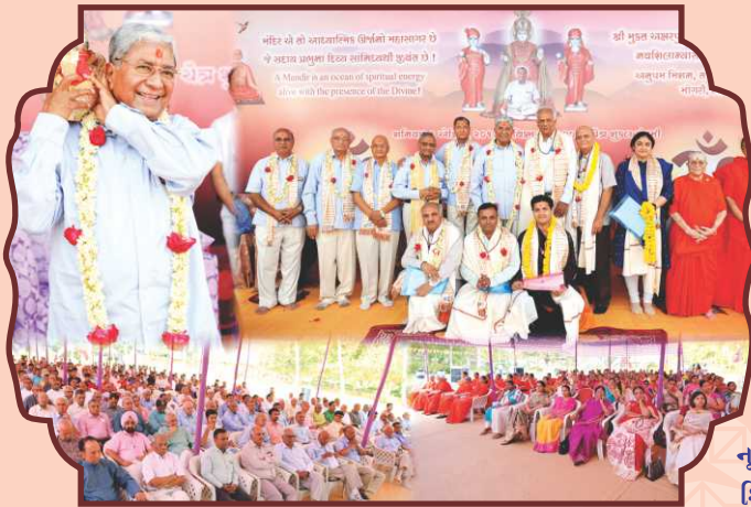
નૂતન મંદિર શિલાન્યાસ મહાવિધિ