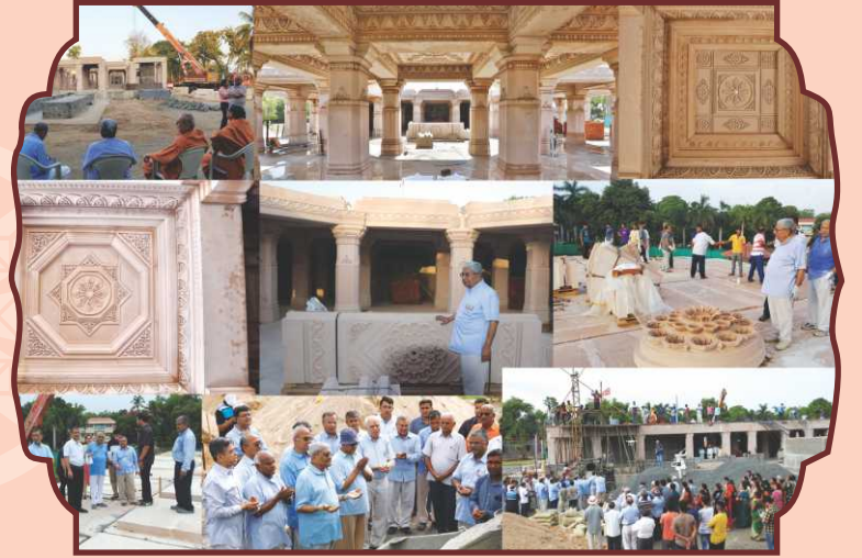
નૂતન મંદિરમાં નિર્માણકાર્ય દરમિયાન સંતભગવંત સાહેબજીએ અને સંતોએ પધારી આશીર્વાદ આપ્યા