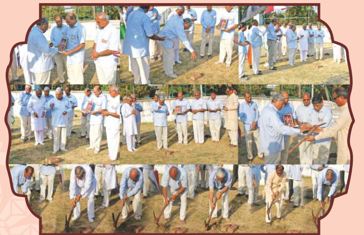
સંતભગવંત સાહેબજી અને સદ્ગુરુ સંતોની પુનિત સંનિધિમાં ૨૯ માર્ચ ૨૦૧૭ના રોજ નૂતન મંદિરનાં ભૂમિપૂજન