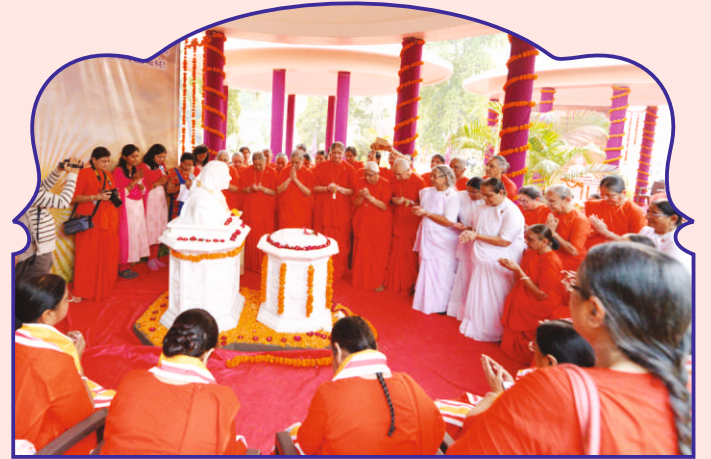
પ.પૂ. સોનાબા સમાધિસ્થાને સંત બહેનો દ્વારા મંત્રપુષ્પાંજલિ અર્પણ