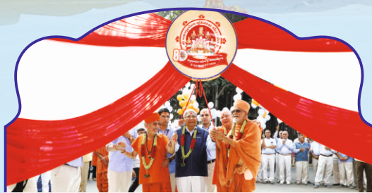
મંદિર મહોત્સવના મુક્તાર્પણ કરતાં સંતસ્વરૂપો

સંતોની સાધનાભૂમિ, મોગરી સ્થિત તપોભૂમિ બ્રહ્મજ્યોતિમાં દિવ્યાતિદિવ્ય શ્રી અક્ષરપુરુષોત્તમ મહારાજ મૂર્તિ પ્રતિષ્ઠા મંદિર મહોત્સવ, સંતભગવંત સાહેબજી અષ્ટદશાબ્દી પ્રાગટ્ય મહોત્સવના શુભારંભ ૭ જાન્યુઆરી ૨૦૨૦ની પાવન સંધ્યાએ થયા. જેની વર્ષોથી રાહ જોવાઈ રહી હતી તેવા હૃદયમંદિર નિર્માણના આ ભવ્ય મહોત્સવના શુભારંભ પણ ભવ્યાતિભવ્ય રહ્યા. શાશ્વતકાળ સુધી તેની સ્મૃતિઓ હૃદયમાં અંકિત રહેશે તેવા સૌને અનુભવ થયા.