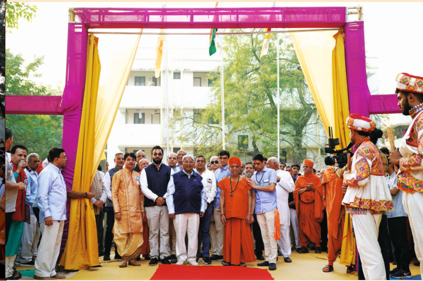
મંદિરજી પ્રવેશદ્વારે સંતસ્વરૂપોએ તેમજ દેશ-પરદેશના ભક્તોએ ત્રિરંગો ધ્વજ, મહોત્સવ ધ્વજ અને અનુપમ મિશનનો ધ્વજ ફરકાવી મંદિરજી પરિસરનાં મુક્તાર્પણ કર્યાં