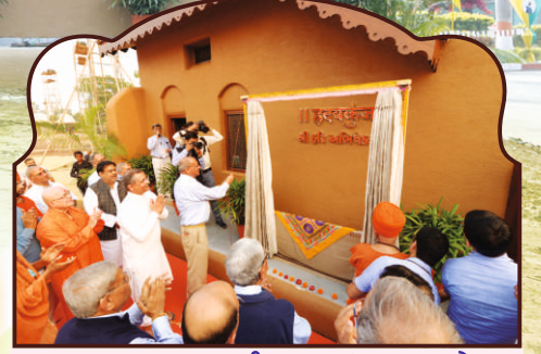
प.पू. गुरुजी, प.पू. दिनकरभाईना वरद हस्ते हृदयकुंज - श्री हरि अभिषेक मंडपनां दिव्य मुक्तार्पण