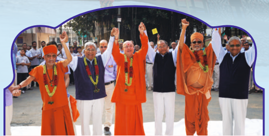
મંદિર મહોત્સવના મુક્તાર્પણ અવસરે જયનાદ

સંતોની સાધનાભૂમિ, મોગરી સ્થિત તપોભૂમિ બ્રહ્મજ્યોતિમાં દિવ્યાતિદિવ્ય શ્રી અક્ષરપુરુષોત્તમ મહારાજ મૂર્તિ પ્રતિષ્ઠા મંદિર મહોત્સવ, સંતભગવંત સાહેબજી અષ્ટદશાબ્દી પ્રાગટ્ય મહોત્સવના શુભારંભ ૭ જાન્યુઆરી ૨૦૨૦ની પાવન સંધ્યાએ થયા. જેની વર્ષોથી રાહ જોવાઈ રહી હતી તેવા હૃદયમંદિર નિર્માણના આ ભવ્ય મહોત્સવના શુભારંભ પણ ભવ્યાતિભવ્ય રહ્યા. શાશ્વતકાળ સુધી તેની સ્મૃતિઓ હૃદયમાં અંકિત રહેશે તેવા સૌને અનુભવ થયા.