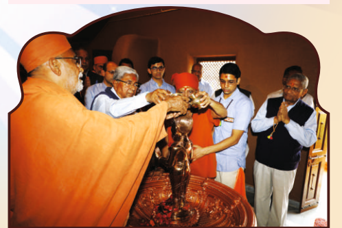
विश्व शांति अने सर्व कल्याण अर्थे श्रीहरि अभिषेक