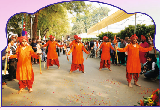
મહારાષ્ટ્રીયન શૈલીમાં સ્વાગત કરતા મુંબઈ મંડળના યુવાનો