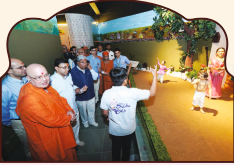
શ્રી ઘનશ્યામ પ્રભુની દિવ્ય લીલાનાં દર્શન