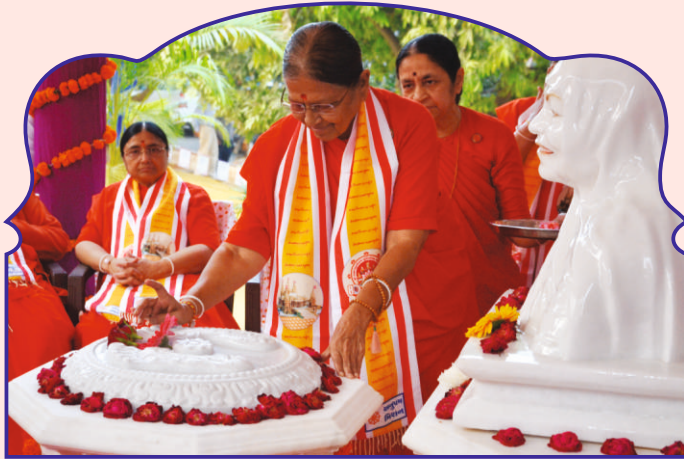
પૂ. દેવીબહેન દ્વારા પ.પૂ. સોનાબા સમાધિસ્થાને ચરણારવિંદનાં પૂજન