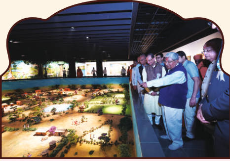
છપૈયા ધામ-મોડેલ વિલેજનાં દિવ્ય દર્શન