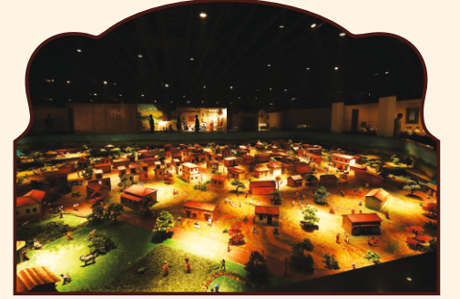
ધારી ધામ-મોડેલ વિલેજનાં દિવ્ય દર્શન