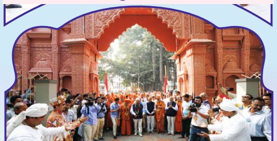
મહોત્સવ પ્રવેશદ્વારે સ્વાગતભાવ ધરતા યુવાનો-ભક્તો