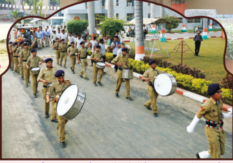
ज्ञानयज्ञ विधातयना अ.न.सी.सी. कॅडेट्स द्वारा बॅण्ड परेड