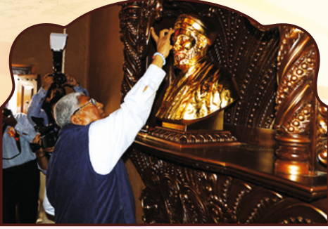
साहेबजी द्वारा श्री गुरुदेव पूजनम्... वंदनम्...