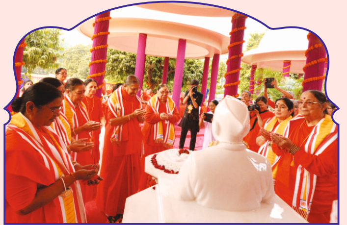
प.पू. काकाश्री समाधिस्थाने संत बहेनो द्वारा मंत्रपुष्पांजलि अर्पण