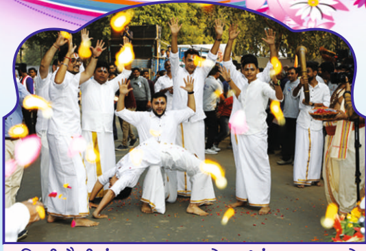
દક્ષિણી શૈલીમાં સ્વાગત કરતા ચેન્નાઈ મંડળના યુવાનો