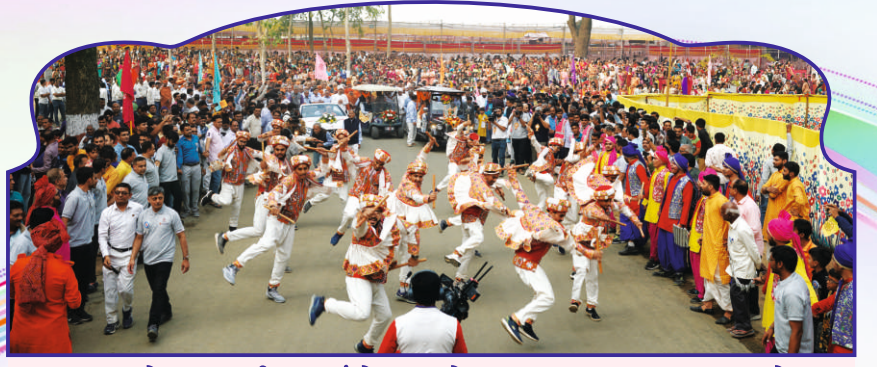
રાસ અને રાજસ્થાની નૃત્ય સંયોજન સાથે સ્વાગત કરતા ગુરુસભાના યુવાનો