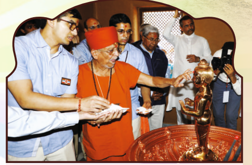
प.पू. गुरुजी द्वारा श्रीहरि पूजनम्... वंदनम्...