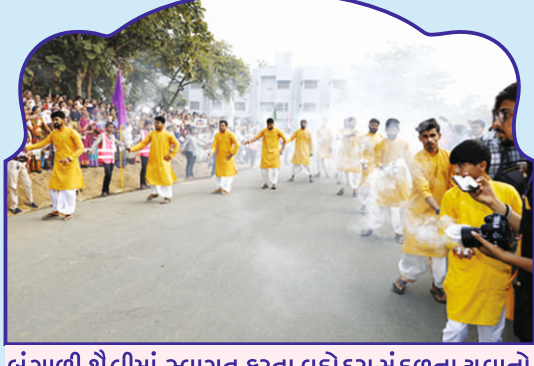
બંગાળી શૈલીમાં સ્વાગત કરતા વડોદરા મંડળના યુવાનો