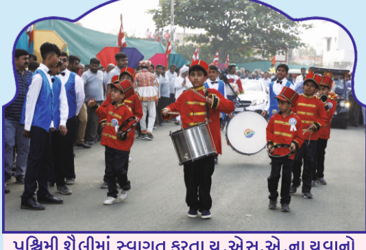
પશ્ચિમી શૈલીમાં સ્વાગત કરતા યુ.એસ.એ.ના યુવાનો