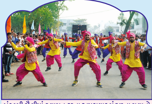
પંજાબી શૈલીમાં સ્વાગત કરતા અમદાવાદ મંડળના યુવાનો