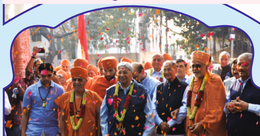
મહોત્સવમાં પધારેલા સંતસ્વરૂપોના સ્વાગત અર્થે પુષ્પવર્ષા