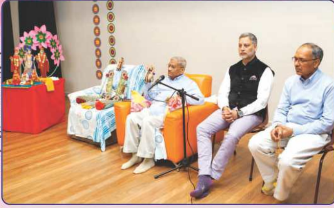
ઓસ્ટ્રેલિયા - સિડનીમાં પૂ. શાંતિદાદાના સાંનિધ્યે જાહેર સત્સંગસભા