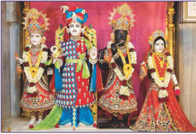
સારંગપુર મંદિરમાં પ્રતિષ્ઠિત દક્ષિણાખંડમાં શ્રી હરિકૃષ્ણ મહારાજ અને સેવક મુકુન્દવર્ણી તેમજ ઉત્તરખંડમાં મધ્યમાં શ્રી ઘનશ્યામ મહારાજ સહિત ધર્મકુળ