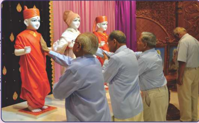
યુ.કે. મંદિરના શ્રી ઠાકોરજીનાં ભાવપૂર્ણ પાટોત્સવ પૂજન