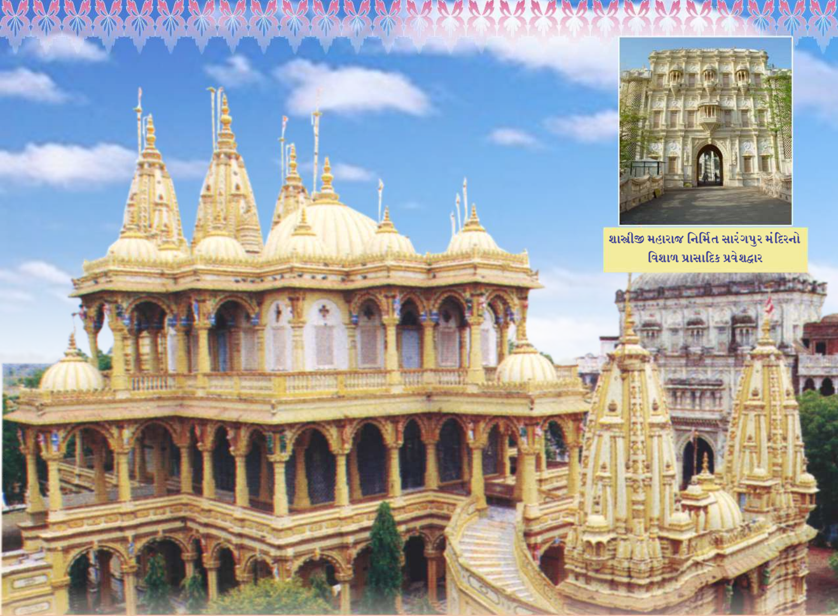
શાસ્ત્રીજી મહારાજ નિર્મિત સારંગપુર મંદિરનો વિશાળ પ્રાસાદિક પ્રવેશદ્વાર