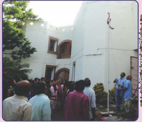
ઉપાસના ધામ અમદાવાદ, શારદા મંદિર-નડિયાદ અને યોગીજી મહારાજ મહાવિદ્યાલય-ધારીમાં ભારતના ૭૩મા સ્વાતંત્ર્યતા પર્વની ઉજવણી