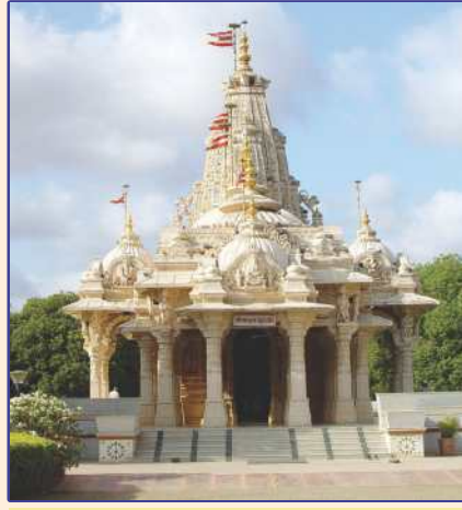
સારંગપુરમાં શાસ્ત્રીજી મહારાજના સ્વધામગમન સ્થાને નિર્મિત 'શ્રી યજ્ઞપુરુષ સ્મૃતિ મંદિર'

સંવત ૨૦૦૨માં પોતાના અતિ પ્રિય આ મંદિરના કોઠારીપદે નવયુવાન શાસ્ત્રી નારાયણસ્વરૂપદાસજી - પ્રમુખ સ્વામીની નિયુક્તિ કરી. તે વખતે શાસ્ત્રીજી મહારાજને અપાર આનંદ હતો ને તેઓએ કહ્યું