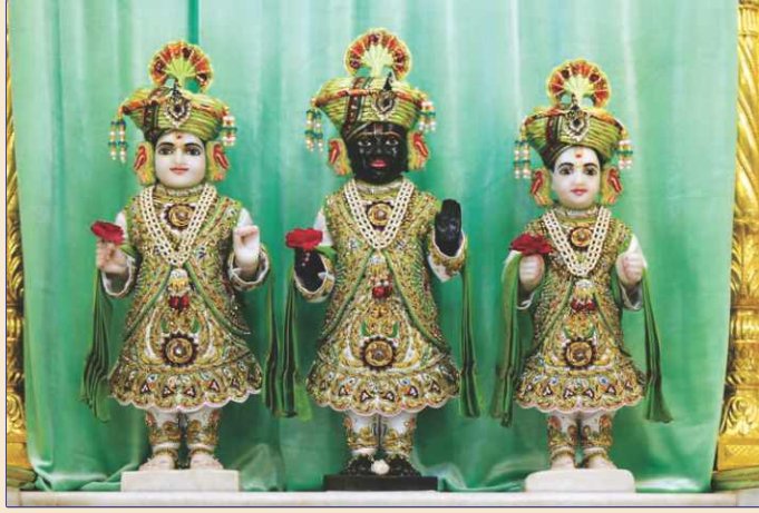
અક્ષરમંદિર, ગોંડલમાં બિરાજમાન શ્રી મુક્ત અક્ષરપુરુષોત્તમ મહારાજની મહાપ્રતાપી મૂર્તિ

અક્ષરદેરીનો પ્રતાપ અનુપમ છે ! યોગીબાપા કહેતા કે, 'અક્ષરદેરીનો મહિમા અકલ્પ્ય છે. અક્ષરદેરીમાં એક પ્રદક્ષિણાએ એક યજ્ઞનું ફળ મળે. અક્ષરદેરીમાં સેવા કરનાર નિર્દોષ થઈ જાય અને એકાંતિક ધર્મ સિદ્ધ કરે. અક્ષરદેરીમાં જે સંકલ્પો કરે તે સિદ્ધ થાય જ ! જેણે અક્ષરદેરીનો સમાગમ કર્યો તેની વાસના ટળી ગઈ, પણ શ્રદ્ધા વિના કામ ન થાય ! અક્ષરદેરીમાં તો મોટા કેસ પતે છે. જે ડોક્ટરથી ન મટે તે આ અક્ષરદેરીનાં પાણી અને પુષ્પથી મટે છે. આ દેરી નથી આ સાક્ષાત્ ધામ