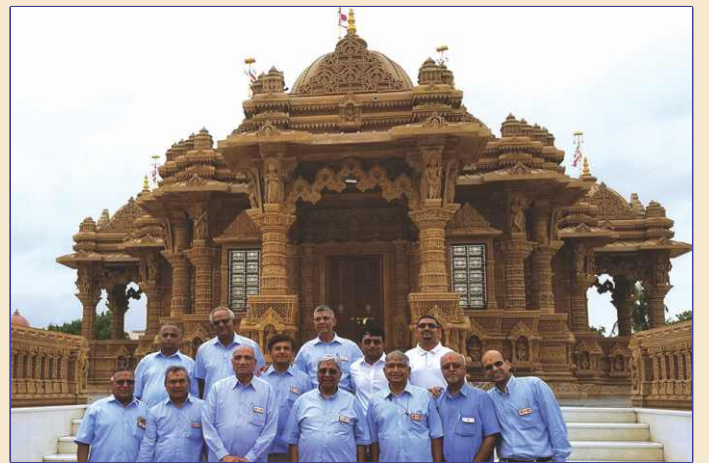
શ્રી યોગી સ્મૃતિ મંદિરનાં દર્શનાર્થે પધારેલ સંતભગવંત સાહેબજી અને સંતો