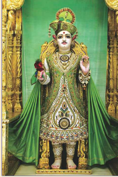
અક્ષરમંદિર, ગોંડલમાં બિરાજમાન શ્રી ઘનશ્યામ મહારાજની મહાતેજસ્વી મૂર્તિ