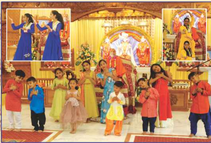
ઈંગ્લેન્ડના બાળમંડળ દ્વારા ગુરુચરણે નૃત્યભક્તિ સ્વરૂપે પ્રાર્થનાભાવ અર્પણ