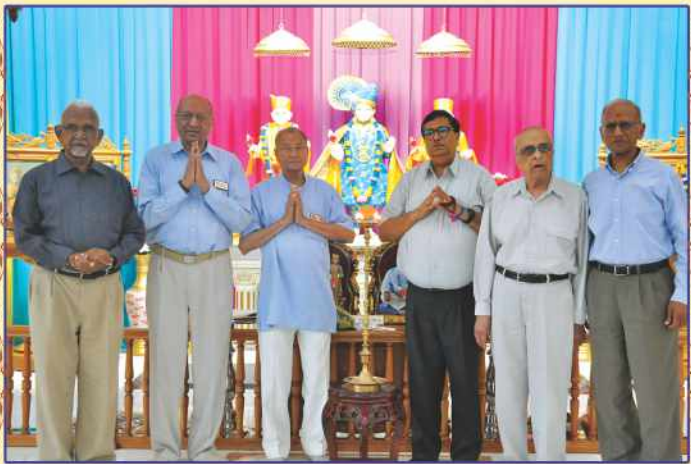
ઍલનટાઉન મંદિરે યોગી જ્ઞાનશિબિરના દીપપ્રાગટ્ય દ્વારા શુભારંભ

૨૦ જુલાઈના રોજ ઍલનટાઉન મંદિરના શ્રી ઠાકોરજીનો ૧૬મો પાટોત્સવ અને ગુરુપૂર્ણિમા પર્વનું સુંદર આયોજન કરાયું. સંતો તથા ભક્તોએ યજમાન સ્વરૂપે પાટોત્સવવિધિમાં બિરાજી ભક્તિઅર્થ અર્પણ