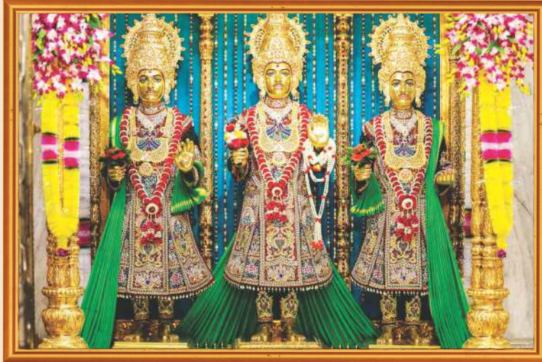
મધ્યમંદિરમાં બિરાજમાન શ્રી મુક્ત અક્ષર પુરુષોત્તમ મહારાજનાં દિવ્ય દર્શન