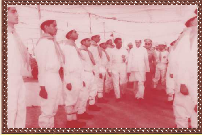
એકસરખાં વસ્ત્રોમાં સેવારત વલ્લભ વિદ્યાનગર યુવકમંડળના ૨૫૧ સ્વયંસેવકો

સમૈયામાં મુખ્ય મહેમાન તરીકે ભારતના પૂર્વ પ્રધાનમંત્રી અને તે સમયના રેલવે મિનિસ્ટર આદરણીય શ્રી ગુલઝારીલાલ નંદાસાહેબ પધાર્યા હતા. સાહેબજીના યુવા સેનાનીઓએ વિશિષ્ટ સફેદ પરિવેશમાં દબદબાભેર મહેમાનોનું સલામી આપી સુંદર સ્વાગત કર્યું, સેવાઓ કરી.