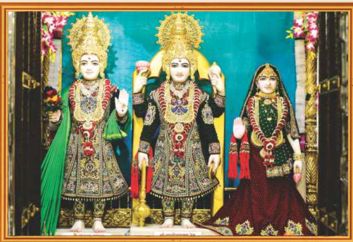
અટલાદરા મંદિરે બિરાજમાન શ્રી લક્ષ્મીનારાયણ દેવ તથા શ્રી હરિકૃષ્ણ મહારાજ

બીજા દિવસે શાસ્ત્રીજી મહારાજની ટપમી જન્મજયંતીની સભા થઈ, જેમાં માહાત્મ્યની અદ્ભુત વાતો થઈ. યજ્ઞ થયો, જેમાં ટપ લાખ