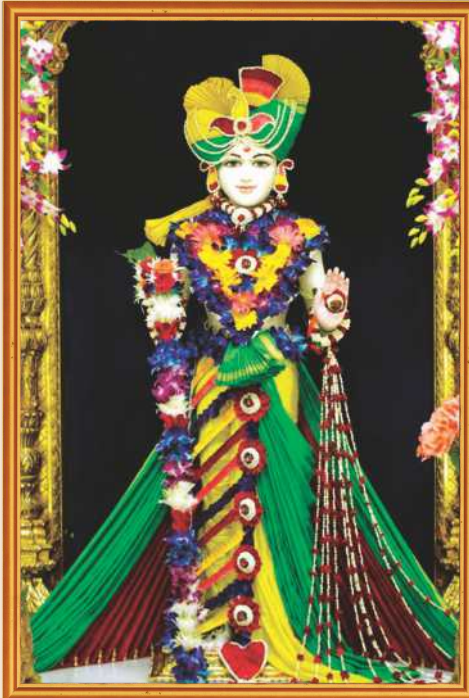
મંદિરે સોહામણાં દર્શન આપતા શ્રી ધનશ્યામ મહારાજ

સત્સંગી ભાઈઓ-બહેનોએ યથાશક્તિ અને શક્તિ ઉપરાંત પણ ધન અને સુવર્ણની સેવાઓ કરી અકલ્પ્ય સમર્પણની હેલી વરસાવી. યોગીજી મહારાજ અને નિર્ગુણદાસ સ્વામીએ તે માટે સૌને ખૂબ પ્રેરણા આપી. સત્સંગના મોભી મુકતોએ પણ ખૂબ સેવાઓ કરી ધન-સંપદાનાં સમર્પણની, ભક્તિભાવની હેલી વરસાવી. આક્રિકામાં સત્સંગનો સૂરજ પૂર્ણ કળાએ પ્રકાશી ચૂક્યો હતો, તેથી ત્યાંના ભક્તો પણ સેવાઓ કરવા