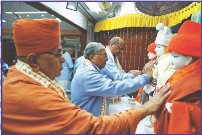
બ્રહ્મજ્યોતિ, મોગરી સ્થિત પારમિતા મંદિરના શ્રી ઠાકોરજીની પાટોત્સવ વિધિ