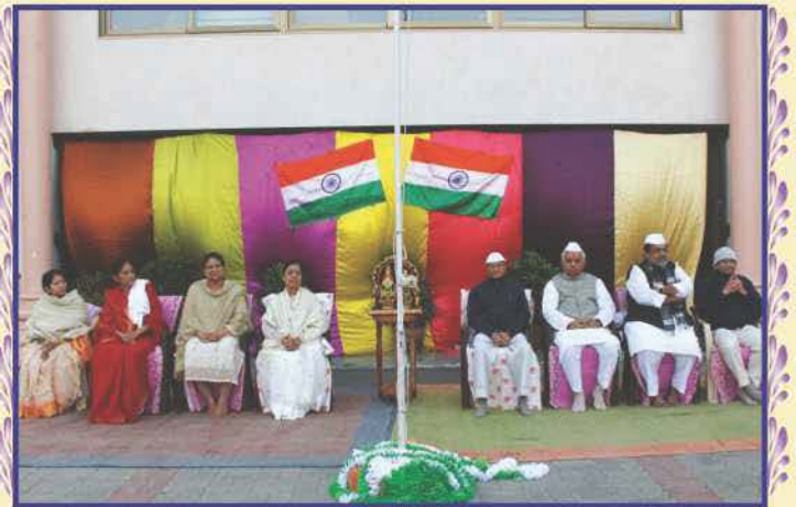
પૂ. અશ્વિનદાદાના સાંનિધે ઉપાસનાધામ, અમદાવાદમાં પ્રજાપત્તાક પર્વ