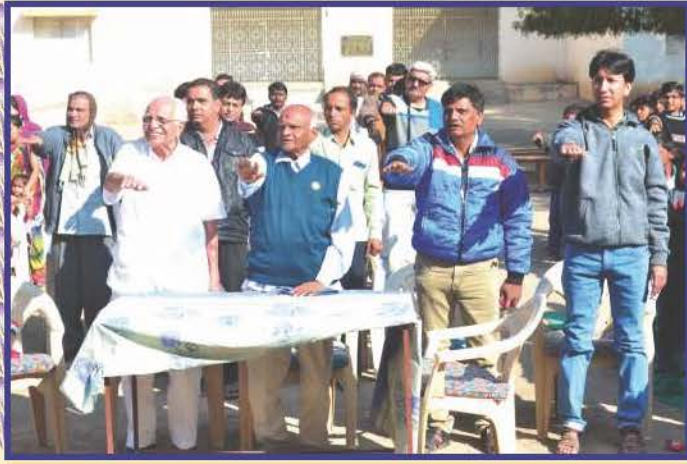
ધારીમાં જણાંતંત્રદિનની ઊજવણી