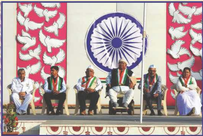
શારદા મંદિર, નડિયાદમાં જણાંતંત્રદિનની ઊજવણી

સંતોના આશીર્વાદ પામી સૌ ધન્ય થયાં. આખું વર્ષ તન, મન, ધન અને આત્માથી સેવા કરવાના સંકલ્પ સાથે સૌ વિસર્જિત થયાં. ◆